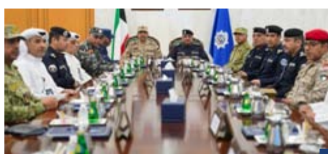
جانب من الاجتماع الجهات الأربع، واستعراض الخطط المتعلقة برفع مستوى الجاهزية

الأمنية في البلاد. كما تناول الاجتماع آليات توحيد الجهود وتكامل الأدوار بين المؤسسات العسكرية والأمنية، وسبل رفع كفاءة العمل الميداني المشترك، بما يضمن سرعة الاستجابة والتعامل مع مختلف الظروف والمستجدات. واختتم الاجتماع بالتأكيد على أهمية استمرار التنسيق وتكثيف العمل المشترك بين الجهات العسكرية والأمنية، بما يحقق أعلى مستويات الجاهزية ويعزز الأمن والاستقرار في البلاد.