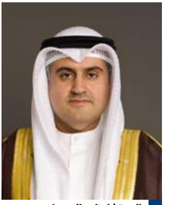
المستشار ناصر السميث

أعلن وزير العدل المستشار ناصر السميث الاثنين إطلاق المرحلة الأولى من النظام الإلكتروني للقضايا الجزائية البسيطة التي يجوز إنهاؤها بالفرامة فقط وفي مقدمتها بعض المخالفات المرورية دون الحاجة إلى إجراءات المحاكمة التقليدية مع بقاء حق من صدر ضده الأمر في الطعن عليه وفقاً للقانون. وبين أن وزارة الداخلية أحالت إلكتروني إلى وزارة العدل عبر النظام الجديد نحو ٨٨٣ ألف أمر جزائي تعود إلى مخالفات مرورية ودقة.