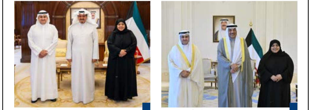
سمو رئيس الوزراء يستقبل وزير العدل ووكيلة الوزارة

(طالع التفاصيل في موقع «الوفاق» https://alwifaqkw.com )