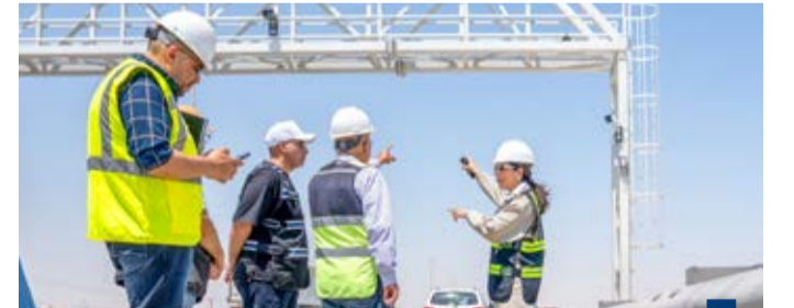
وزيرة الأشغال تتفقد الموقع

الذهب يستقر قرب أعلى مستوى في أسبوعين مع تراجع توقعات رفع الفائدة الأمريكية