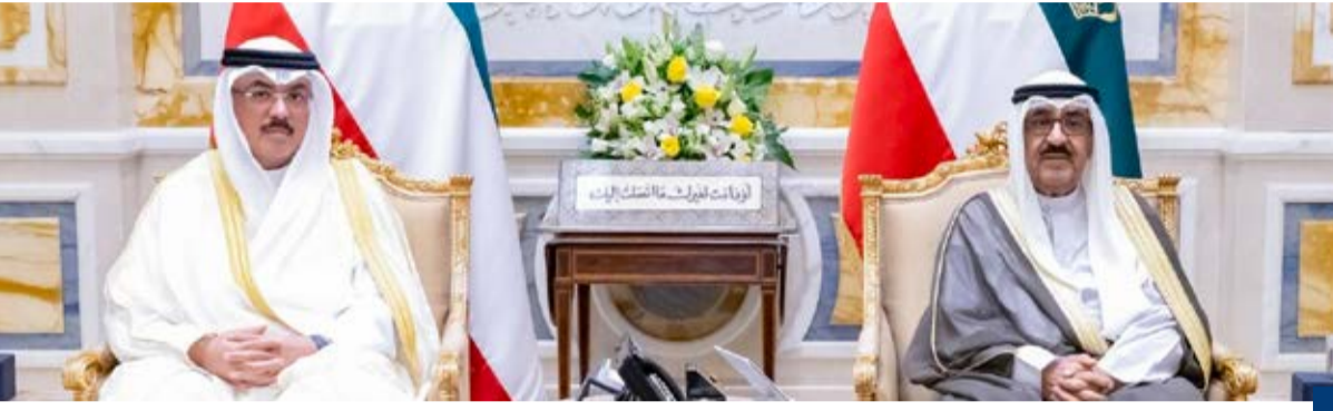
سمو الأمير يستقبل وزير التربية

والارتقاء بها ومنها المتابعة الميدانية والوقوف على كافة التحديات والمعوقات ومعالجتها والاستعداد المبكر للعام الدراسي المقبل من خلال تهيئة وتأهيل الكوادر التربوية وتجهيز المدارس ومرافقها ومواصلة تطوير الكتب الدراسية بما يواكب متطلبات العصر ويعزز قيم ومبادئ الهوية الوطنية والارتقاء بمهارات الطلبة نحو آفاق الإبداع والابتكار وتطوير البيئة المدرسية والاهتمام بالتقنيات الحديثة والذكاء الاصطناعي بما يساهم في إعداد وتأهيل أجيال قادرة على المنافسة والإسهام في نهضة الوطن متمنياً سموه لهم ولأبنائهم الطلاب والطالبات المزيد من التفوق والسداد. واستقبل سمو ولي العهد الشيخ صباح خالد الحمد الصباح، وزير التربية سيد جلال سيد عبدالحسن الطبطبائي