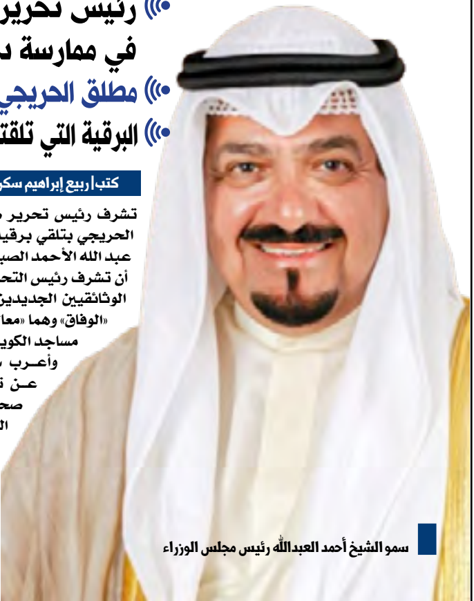
سمو الشيخ أحمد عبدالله رئيس مجلس الوزراء