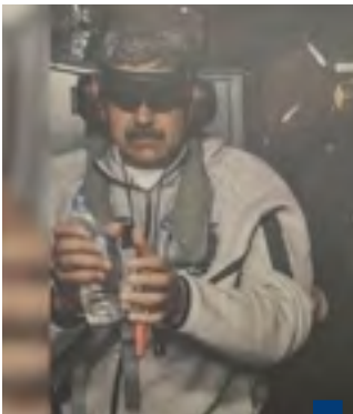
ترامب نشر صورة للرئيس الفنزويلي وهو معتقل على متن سفينة أمريكية

روسيا تطالب الولايات المتحدة بالإفراج عن الرئيس الفنزويلي وزوجته