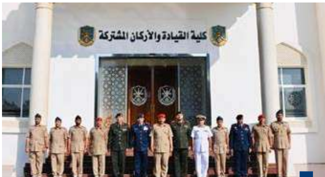
جانب من الزيارة

قام وفد من كلية مبارك العبدالله للقيادة والأركان المشتركة برئاسة أمر الكلية اللواء الركن طيار فهد الخرينج بزيارة إلى كلية القيادة والأركان المشتركة في سلطنة عمان الشقيقة في إطار تعزيز أوجه التعاون الثنائي العسكري والأكاديمي وتبادل الخبرات.