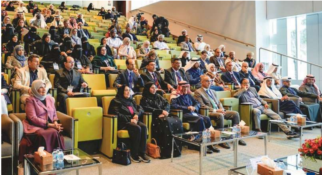
جانب من افتتاح المؤتمر

التقنيات الحديثة يفتح آفاقاً جديدة لحلول مبتكرة تعزز كفاءة التشغيل وتطور آليات التخطيط بما يساهم في تعزيز الأمن المائي. وأوضح أن تنظيم هذه الورشة يعكس التزام معهد الأبحاث بتبني أحدث التقنيات العالمية والارتقاء بالقدرة الوطنية مشيراً إلى أن الذكاء الاصطناعي لم يعد مجرد خيار تقني بل أصبح عاملاً محورياً في بناء أنظمة مائية ذكية قادرة على التكيف مع التغيرات المناخية والبيئية. ونوه الحميدان بالقضايا المحورية التي تتناولها جلسات الورشة وتشمل الجاهزية الوطنية للذكاء الاصطناعي والسيادة الرقمية وأمن البيانات والنمذجة الذكية، وصولاً إلى التطبيقات المستدامة وتعزيز الوعي المجتمعي بما يساهم في توليد أفكار مبتكرة وصياغة استراتيجيات عملية. من جانبه أكد ممثل الأمانة العامة لمجلس التعاون لدول الخليج العربية الدكتور محمد الرشدي في كلمته، أن ملف المياه من أكثر الملفات الاستراتيجية أولوية لدى دول المجلس لارتباطه المباشر بالأمن المائي والغذائي ومتطلبات التنمية المستدامة. وقال الرشدي، إن دول «التعاون» وضعت خارطة طريق واضحة