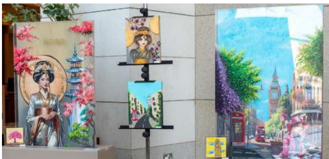
جانب آخر من الافتتاح

المكانة الثقافية الرفيعة التي تحظى بها دولتنا، ويؤكد دورها التاريخي في إحياء تراثنا العربي العريق كما يبرز جهودها الواسعة في دعم الفكر والمعرفة والإبداع واحتضان المبادرات الثقافية العربية. وتمت العازمي أوجه التعاون البناء بين المجلس الوطني للثقافة والفنون والآداب وجمعية المكتبات والمعلومات الكويتية، معربة عن بالغ التقدير لدور الجمعية وجهودها المتميزة في تنفيذ الحركة الثقافية وترسيخ ثقافة القراءة ودعم المبادرات المعرفية والتدريبية المتخصصة. من ناحيته قال رئيس مجلس إدارة جمعية المكتبات والمعلومات