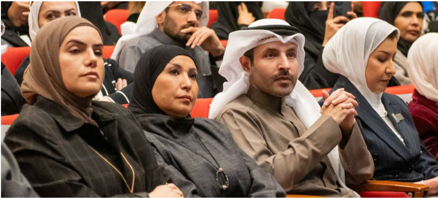
جانب من افتتاح الملتقى

تحوّلت زيارة رئيس جمهورية موزمبيق، دانييل فرانسيسكو تشاويو، إلى العاصمة الإيطالية روما إلى حديث واسع على مواقع التواصل الاجتماعي، بعد لقطة لافتة جمعت بينه وبين رئيسة الوزراء الإيطالية جورجيا ميلوني داخل قصر كيجي، مقر الحكومة. وأظهرت عدسات الصحفيين لحظة المصافحة بين الجانبين، حيث بدا فرق الطول واضحاً، ما دفع ميلوني إلى رفع نظرها للأعلى بابتسامة حاولت من