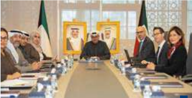
جانب من الاجتماع بين «المالية» وبعثة الصندوق

قائد رئيس مجلس الوزراء بالإنابة وزير الداخلية الشيخ فهد اليوسف، الثلاثاء، بكمثبه الوهيب رتبة لواء، وذلك بمناسبة صدور مرسوم ترفيته من رتبة عميد إلى رتبة لواء وتعيينه وكيلاً لوزارة الداخلية بدرجة وكيل وزارة. وهذا اليوسف اللواء عبدالوهاب الوهيب على نياله ثقة القيادة السياسية، متمنيا له التوفيق والسداد في مهام منصبه الجديد، وبذل المزيد من الجهد والعطاء وتطبيق سيادة القانون، بما يحفظ أمن الوطن والمواطنين. وأكد أهمية مواصلة تطوير