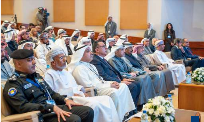
جانب من الحضور في ورشة العمل الإقليمية