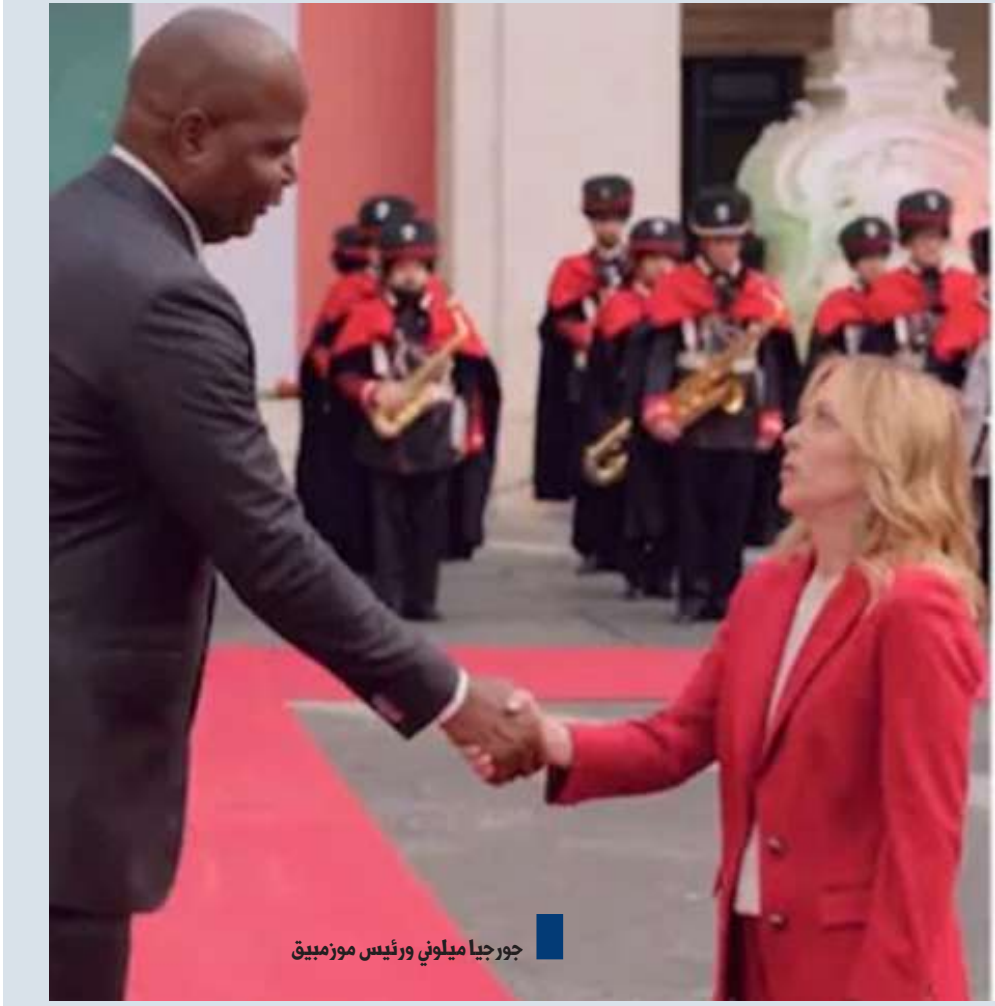
جورجيا ميلوني ورئيس موزمبيق