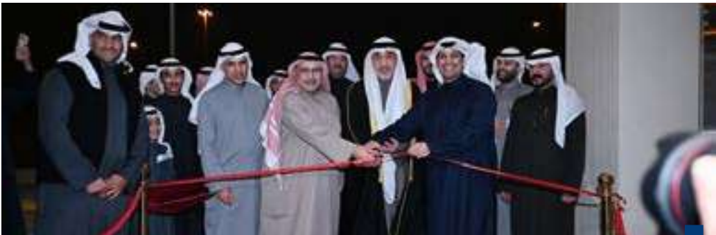
اليوسف يفتتح الاستاء بحضور المطيري

احتفل في قصر بيان بتسلم حضرة صاحب السمو أمير البلاد الشيخ مشعل الأحمد الجابر الصباح حفظه الله ورعاه أوراق اعتماد كل من السفير ويريش رامسوك سفيرا لمملكة هولندا والسفير محمد جابر أبو الوفا سفيرا لجمهورية مصر العربية والسفير غادي الخوري سفيرا للجمهورية اللبنانية والسفير قدسي رشيد سفيرا للمملكة المتحدة لبريطانيا العظمى وشمال أيرلندا والسفير مكسيم صيغ سفيرا لجمهورية أوكرانيا وذلك كسفراء لبلادهم لدى دولة الكويت.