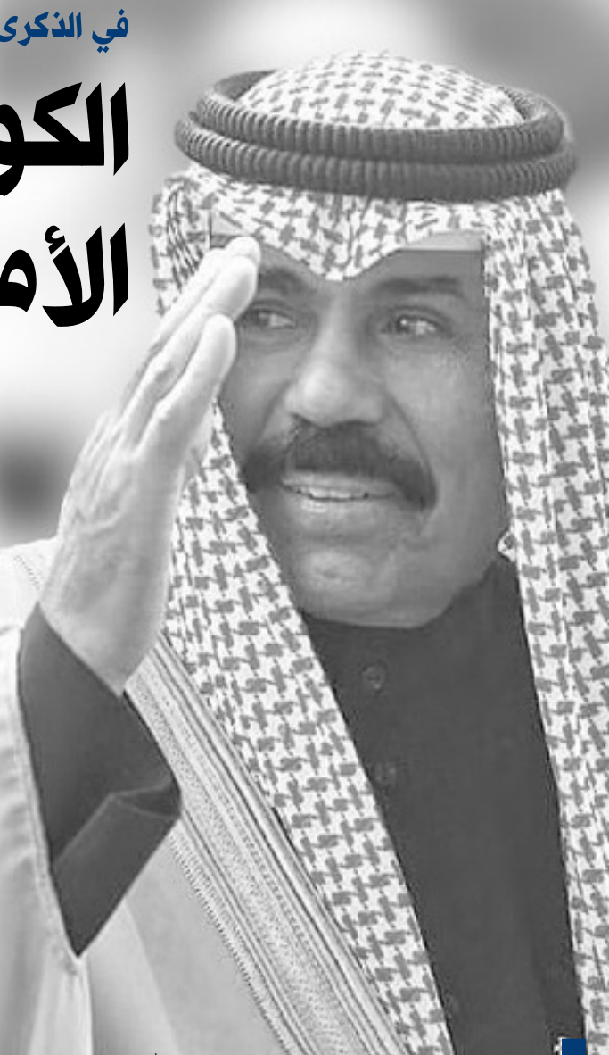
سمو الأمير الراحل الشيخ نواف الأحمد الجابر الصباح طيب الله ثراه

كوئنا - في الذكرى الثانية لوفاته سمو الأمير الراحل الشيخ نواف الأحمد الجابر الصباح طيب الله ثراه الثلاثاء تستحضر الكويت بالوفاء والعرفان مناقبه العطرة ومسيرته الزاخرة بالعطاء من أجل رفعة البلاد وتطورها واستقرارها وإعلاء شأنها إقليمياً ودولياً. ففي ١٦ ديسمبر عام ٢٠٢٣ ودع أهل الكويت فقيدهم الكبير سمو الأمير الراحل الشيخ نواف الأحمد طيب الله ثراه مجمعين على أن ذكراه وإنجازاته وخصاله الحميدة ستبقى خالدة في تاريخ البلاد ووجدان أهلها لتكون مثارة للأجيال تستلهم منها دروس البذل والعطاء وتقديم الغالي والنفيس من أجل عزّة الكويت ورفعتها وحمايتها على أمنها وأمانها. وعلى مدى ستة عقود وضع الأمير الراحل بصمات خالدة في مختلف الجهات والمناصب التي تولّاها وحرص على تطويرها واعداد كوادرها وتعزيز دورها بما