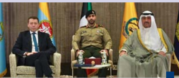
وزير الدفاع يستقبل المبعوث التجاري للمملكة المتحدة

الطقس وصور الأقمار الاصطناعية والنماذج العددية تشير إلى تأثر البلاد بامتداد مرتفع جوي ينحسر تدريجياً اليوم ليصبح بتقدم امتداد منخفض جوي سطحي من جهة الجنوب الغربي. وأضاف العلي أن هذا المنخفض يتعمق تدريجياً متزامناً مع انخفاض آخر في طبقات الجو العليا مصحوباً بكتلة هوائية باردة نسبياً ورطبة تتكاثر