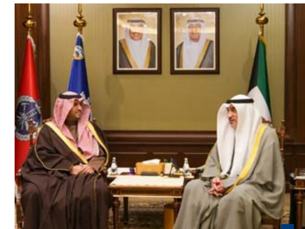
رئيس مجلس الوزراء بالإنابة يستقبل الأمير تركي بن محمد بن فهد

السنة الثانية ( العدد ٤٦٢ ) - الثلاثاء ٢٥ جمادى الآخرة ١٤٤٧ هجري - ١٦ ديسمبر ٢٠٢٥