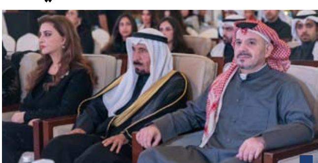
جانب من الحفل

«العدل»: إطلاق خدمة الحصول على «منطوق الحكم» عبر تطبيق «سهل» وذكرت الوزارة في بيان صحفي، أن خدمة الحصول على منطوق الحكم بالكامل أصبحت متاحة للأفراد مباشرة عبر تطبيق «سهل» دون الحاجة لمراجعتها، وذلك لتقديمها إلى الجهات الحكومية والجهات التي تتطلبها.