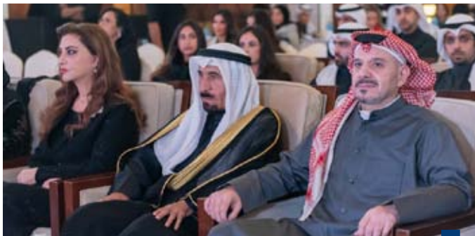
جانب من حفل برعاية الشيخ علي جابر الأحمد الصباح

إحياء ذكراهم ونقل سيرتهم العطرة للأجيال القادمة. وقال الشيخ علي الجابر «إنه تم في المؤتمر الثالث تكريم والده الأمير