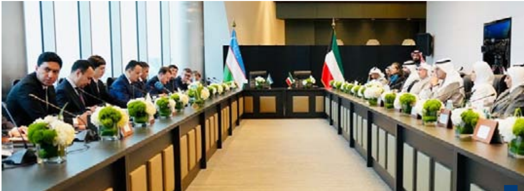
جانب من اجتماع اللجنة الوزارية الكويتية - الأوزبكية