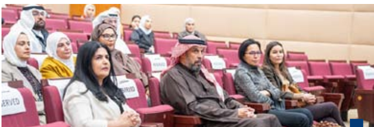
جانب من البرنامج التدريبي

خدمة مؤسسات الدولة الوطنية والارتقاء بمستوى الأداء القانوني والإداري ومواكبة أفضل الممارسات المعاصرة في هذا المجال. وأوضحت أن إدارة الفتوى والتشريع تحرص من خلال البرامج التدريبية المتخصصة على تنمية الكفاءات القانونية الوطنية وتعزيز قدراتها المهنية، بما يواكب التطورات