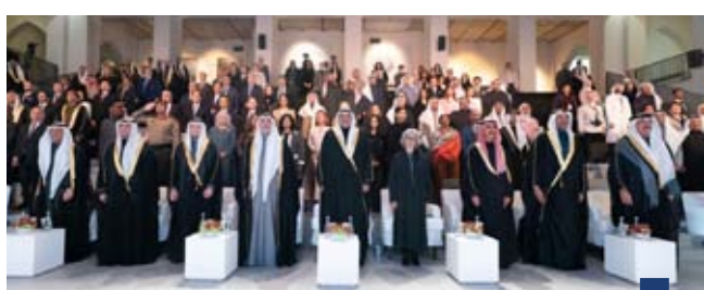
سمو ولي العهد يفتتح معرض نشأة دار الآثار الإسلامية بالكويت