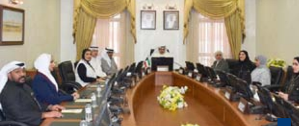
جانب من اجتماع أمين «البحار المركزي» مع وفد «السكنية»

حضر اللقاء رئيس الأركان العامة للجيش الفريق الركن خالد الشريهان ووكيل وزارة الدفاع الشيخ الدكتور عبدالله مشعل الصباح ومساعد وزير الخارجية لشؤون أوروبا السفير صادق معرفي وسفير المملكة المتحدة لدى البلاد قدسي رشيد.