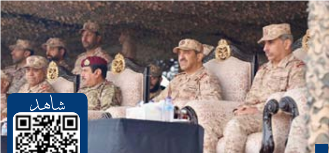
جانب من التمرين

العنصر البشري من أولويات العمل العسكري لما له من أثر مباشر في تعزيز الجاهزية وتحقيق أعلى مستويات الأداء والانضباط بما يضمن تنفيذ المهام بكفاءة واحتراف. ووفق البيان فقد جاء التمرين ضمن خطة الحفاظ على الجاهزية والتدريب على التخطيط والتنسيق في إدارة العمليات وتعزيز وتطوير مستوى القدرات والسيطرة