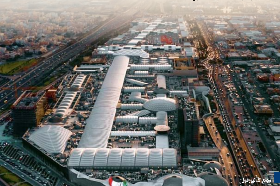
مجمع الأفنيوز مول

أكدت مصادر لـ «الموقف» أن ديوان المحاسبة تلقى عدة طلبات من الهيئة العامة للصناعة للموافقة على توقيع عقود تخصيص القسائم التي تشرف عليها الهيئة وبلغ ما أمكن حصره من إيرادات تلك العقود نحو ٤٠ مليون دينار، وأبرز تلك العقود هو عقد عائد لشركة الشايح «عقارات الري» وهي الشركة المالكة لمجمع الأفنيوز مول بقيمة إيرادات العقد « بديل التخصص» نحو ٣٦,٦ مليون دينار. ورجحت مصادر لـ «الموقف» أن تكون مدة العقد ٥ سنوات وهي المدة المتبعة في تخصيص قسائم هيئة الصناعة، وشركة عقارات الري