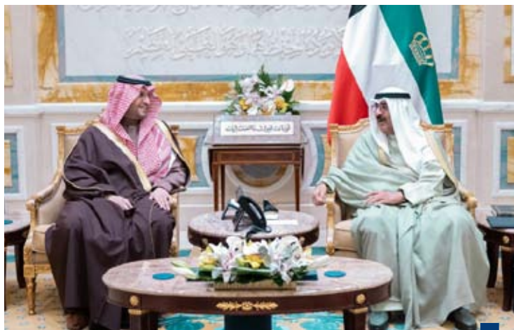
سمو الأمير يستقبل الأمير تركي بن محمد

العايفة ولشعب الكويت المزيد من التقدم والرفي. هذا وقد حمله سمو أمير البلاد الشيخ مشعل الأحمد، تحياته لخادم الحرمين الشريفين، والأمير محمد بن سلمان ولي العهد رئيس مجلس الوزراء، وتمنياته لهما بموفقور الصحة ودوام العافية، سانلا سموه المولى تعالى أن ينعم على المملكة العربية السعودية وشعبها الشقيق بمزيد من النمو والازدهار تحت ظل القيادة الحكيمة لأخيه خادم الحرمين الشريفين.