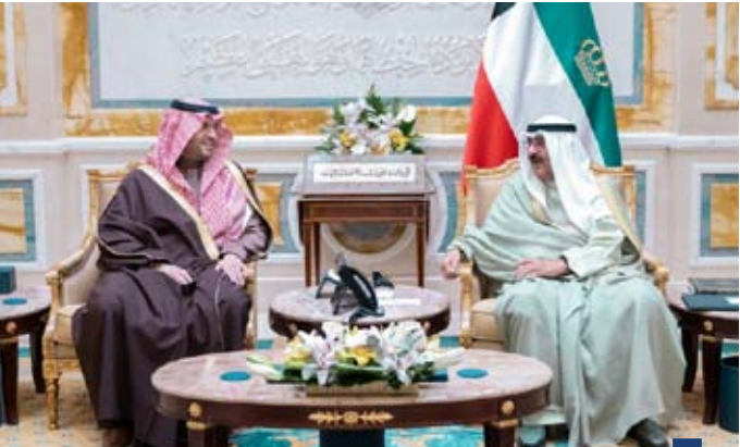
سمو الأمير يستقبل الأمير تركي بن محمد