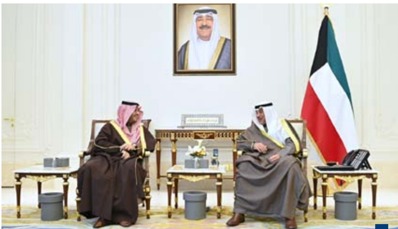
سمو ولي العهد يستقبل وزير الدولة عضو مجلس الوزراء السعودي

جرى خلال اللقاء استعراض العلاقات الوطيدة وأوجه التعاون المختلفة تعزيزاً للتشاور الثنائي المستمر وترسيخاً للشراكة الاستراتيجية بما يصب في صالح البلدين والشعبين الشقيقين. حضر المقابلة رئيس ديوان رئيس مجلس الوزراء عبدالعزيز دخيل الدخيل وصاحب السمو الأمير سلطان بن سعد بن خالد آل سعود سفير خادم الحرمين الشريفين لدى دولة الكويت.