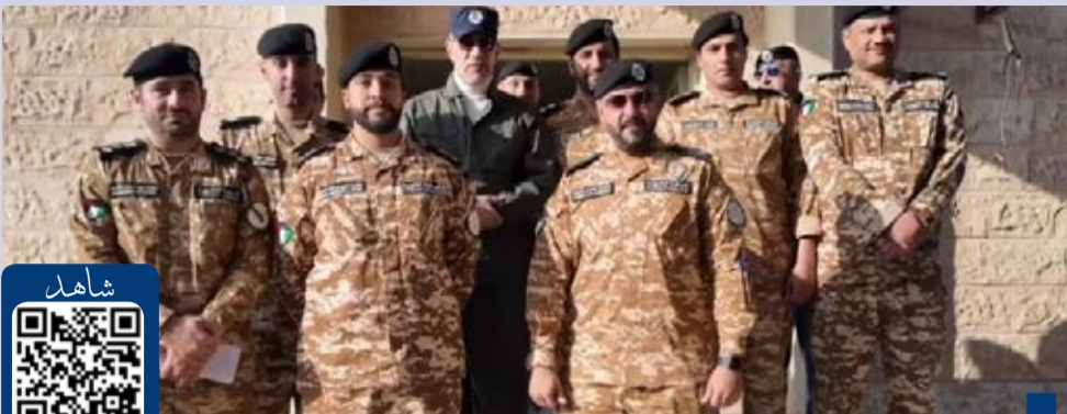
جانب من الجولة التفقدية

أعربت وزارة الخارجية عن إدانة دولة الكويت وبإشاد العبارات لاقترام قوات الاحتلال الإسرائيلي مقر وكالة الأمم المتحدة لغوث وتشغيل اللاجئين الفلسطينيين في الشرق الأدنى «الأونروا» في حي الشيخ جراح بالقدس الشرقية. وقالت الخارجية في بيان صحفي، إنها إذ تؤكد على أن هذا الاقتحام يعد خرقا