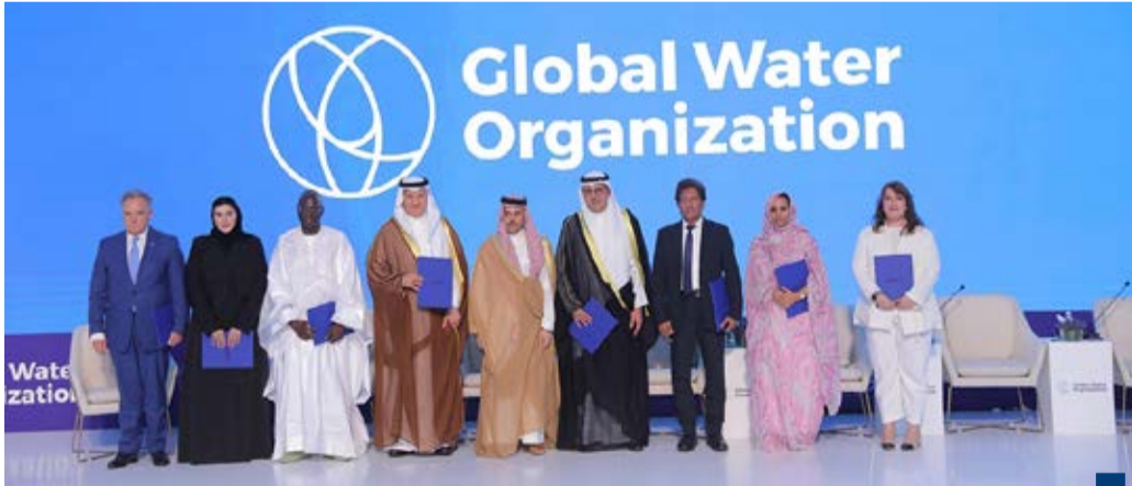
الكويت تشارك في توقيع ميثاق انضمام الدول للمنظمة العالمية للمياه

في المجال الثقافي والاحتفاء عام ٢٠٢٦ بالذكرى الخامسة والستين للعلاقات الدبلوماسية بين البلدين الصديقين.