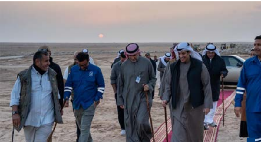
جانب من الزيارة التفقدية إلى موقع (جيوبارك الكويت)