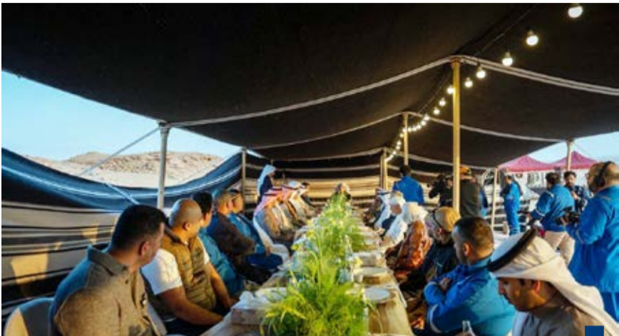
جانب آخر من الزيارة التفقدية