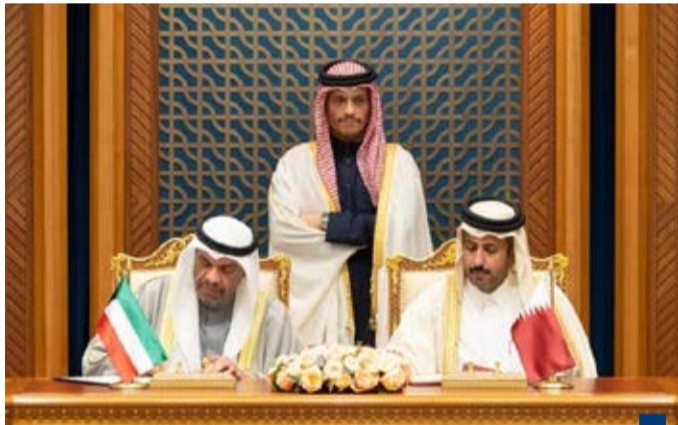
توقيع ٢ مذكرات تفاهم وبرنامج تنفيذي بين الكويت وقطر في فبراير ٢٠٢٥