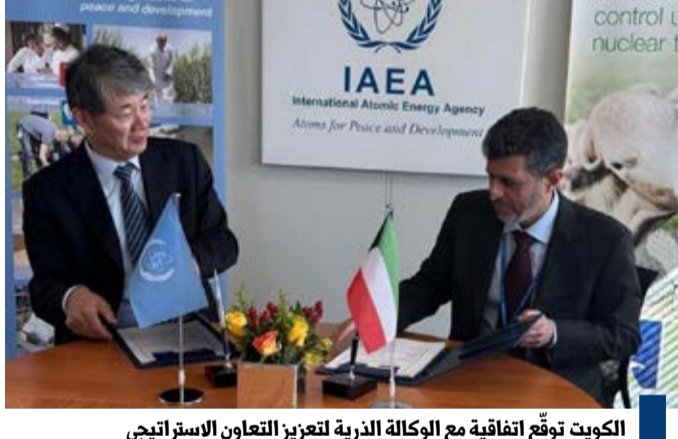
الكويت توقع اتفاقية مع الوكالة الذرية لتعزيز التعاون الاستراتيجي

واستهدفت البلاد تحقيق أهداف التنوع الاقتصادي والتحول الرقمي من خلال استثمارات نوعية في التكنولوجيا والشراكات الآسيوية والأوروبية ويأتي في مقدمة ذلك اتفاقية الشراكة الاستراتيجية مع (مايكروسوفت) لإنشاء بيانات الذكاء الاصطناعي ومركز التميز للحوسبة السحابية علاوة على ملحق مذكرة تفاهم مع مجلس تنمية الخدمات المالية في هونغ كونغ يعني بالذكاء الاصطناعي والتقنيات المالية.