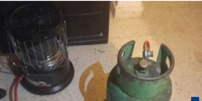
المدفأة المعروفة بالـ«شموسة»

الكوفيات خلال 24 ساعة والغاز المتسرب هو القاسم المشترك في الحوادث بعد وفاة 9 أشخاص اختناقاً.. الأمن الأردني يحذر من «الشموسة»