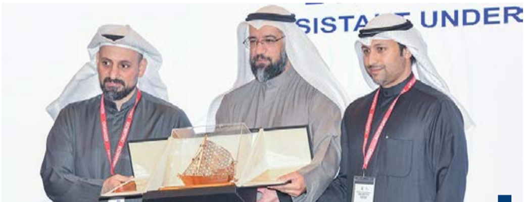
جانب من المؤتمر

لها أشقائنا من مسؤولين ومواطنين كويتيين من مختلف فئات هذا الشعب الشقيق وأصبحت بنندا مهما في برنامجنا الدبلوماسي». وتقدم السفير الخروصي في تصريحه بأطيح التهنائي للمسؤولين في وزارة الإعلام والثقافة والمجلس الوطني للثقافة والفنون والآداب بمناسبة إدراج ملف الديوانية ضمن القائمة التمثيلية لمنظمة يونسكو للتراث الثقافي غير المادي للإنسانية.