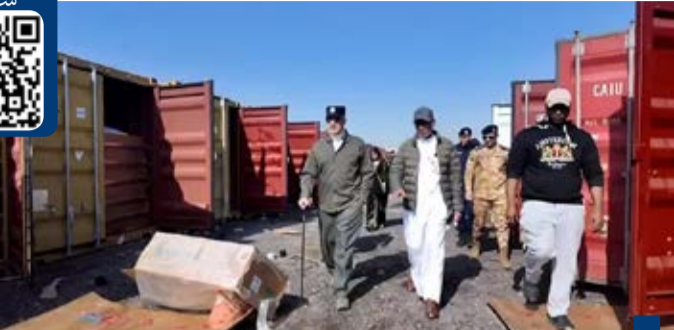
اليوسف يشرف بنفسه على ضبط المزرعة

القبض على 9 أشخاص من بينهم مواطن يشتبه بإدارته لأعمال غير المشروعة