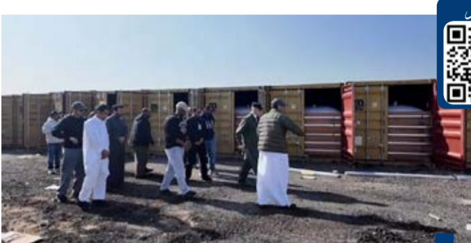
جانب آخر من عملية الضبط

الرابط الموحد للمنصات الاخبارية لصحيفة الوفاق على مواقع التواصل : https://linktr.ee/alwifaqkw