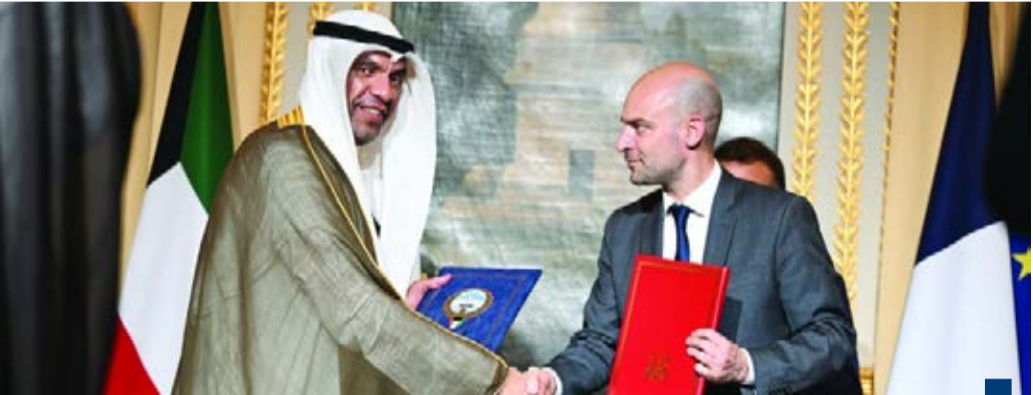
وقعت الكويت مع فرنسا اتفاقيات في يوليو ٢٠٢٥

وقال السفير الخروصي في تصريح له، «كونا»، أن نجاح الكويت الشقيقة في إدراج الديوانيات في هذه المنظومة الدولية يؤكد الأهمية