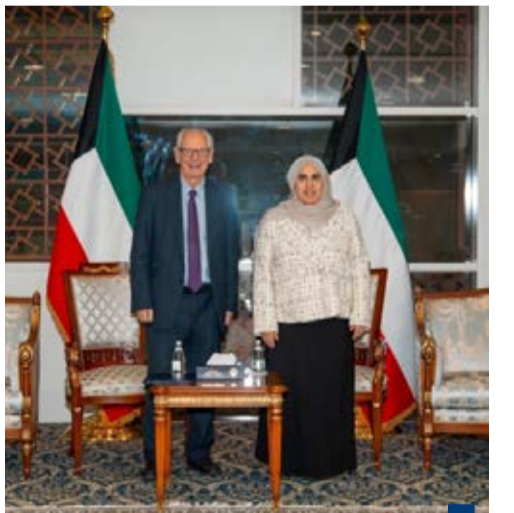
جانب من الاجتماع

تشير آخر البيانات المتوفرة لدى وزارة العدل -إدارة التسجيل العقاري والتوثيق- (بعد استبعاد كل من النشاط الحرقي ونظام الشريط الساحلي) إلى انخفاض في سيولة سوق العقار في نوفمبر ٢٠٢٥ مقارنة بسيولة أكتوبر ٢٠٢٥، حيث بلغت جملة قيمة التداولات لشهر نوفمبر نحو ٣٢٩,٩ مليون دينار كويتي، وهي قيمة أدنى بما نسبته ٢,٩٪ عن مستوى سيولة شهر أكتوبر البالغة نحو ٤٠٤,٧ مليون دينار كويتي، بينما أعلى بما نسبته ٢١,٩٪ مقارنة مع سيولة نوفمبر ٢٠٢٤ عندما بلغت آنذاك نحو ٣٢٢,٢ مليون دينار كويتي. وقال تقرير مركز الشال الاقتصادي -وبلغ عدد الصفقات في شهر نوفمبر ٥٦٩ صفقة، ضمنها حصدت محافظة حولي أعلى عدد بـ ١٦٨ صفقة وممثلة بنحو ٢٩,٥٪ من الإجمالي، تلتها محافظة الأحمد بـ ١٥٥ صفقة ومثلت نحو ٢٧,٢٪ في حين حظيت محافظة الجهراء أدنى عدد من الصفقات بـ ٥٥ صفقة وممثلة بنحو ٩,٧٪.