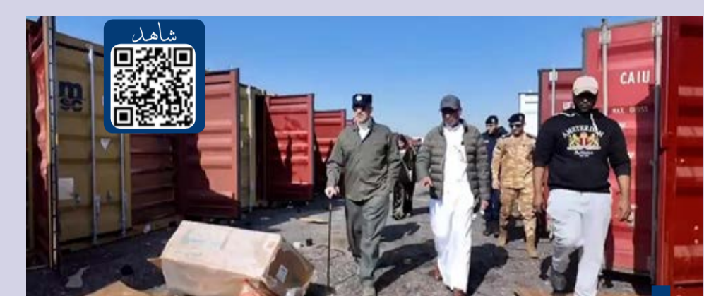
اليوسف يشرف بنفسه على ضبط المزرعة

«٥» أطع على النظام الجديد لمراقبة وحماية الحدود وتقنياته الحديثة في مواجهة التسلل وتهريب الممنوعات