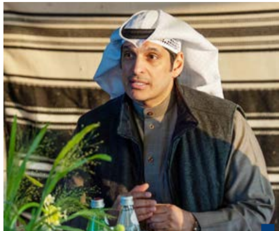
وزير الإعلام والثقافة والشباب عبدالرحمن المطيري

زار موقع المشروع وأكد أنه سيكون أحد الوجهات المميزة للسياح