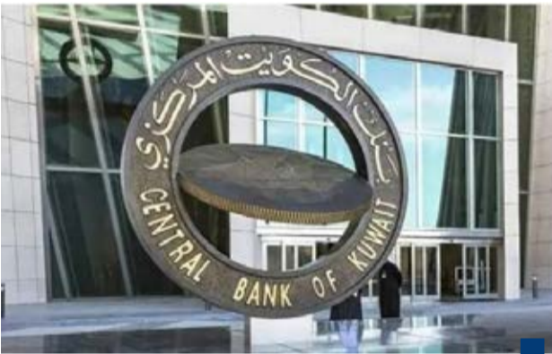
بنك الكويت المركزي

لحضر النمو مقارنة بقلها حول التضخم. وقد سارعت البنوك المركزية للدول الست مجتمعة هذه المرة بخفض أسعار الفائدة المقابلة لديها برقع النقطة مئوية أيضا، خلافا لخفض شهر أكتوبر الفات حيث أيقت الكويت حينها سعر خصمها ثابت، وكانت يومها الاستثناء الوحيد. ودول الاقليم تبقي أسعار فاندتها عالية لسعره على الدولار الأمريكي لاجتناب خطر آخر وهو احتمال نزوح أرصدها بعمالتها المحلية إلى الدولار إن أصبح هاش حدثت أعلى ذلك مبرر لأن خمس من الدول الست يرتبط سعر صرف عمالاتها بالكامل بالدولار الأمريكي، وسلة عملات السادة نقل أو هيمنة لوزن الدولار الأمريكي فيها. وأصبح سعر الفائدة الأساس على الدولار الأمريكي ٣,٢٥-٣,٧٥. ومع خفض سعر الخصم على الدينار الكويتي في الكويت ليبلغ ٣,٢٥، أصبح مماثلا لحد الأدنى لسعر الفائدة الأساس على الدولار الأمريكي، ونعتقد بصحة قرار بنك الكويت المركزي.