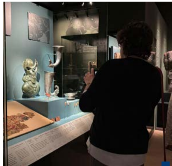
جانب آخر من مقتنيات الكويتية المعروضة

ومن بين القطع الفنية المعارة في المعرض من مجموعة الصباح الآثرية لوحة مذهبة من حضارة وادي الأوكسوس تعود إلى القرن الرابع قبل الميلاد إلى جانب طبق فضي ذي مركز مذهب من العصر الهلنستي الشرقي (القرن ٣-٢ قبل الميلاد) وتشارك المجموعة أيضا بـ أوان فضية وزجاجية من شرق إيران تعود إلى القرون من الرابع إلى الثالث قبل الميلاد وأخرى من القرن الخامس الميلادي. كما تشمل الإعارة قطعاً تمثل الهارة الفنية الرفيعة للحرفيين من الفترة ما بين القرن (٢-٣ قبل الميلاد) وتأتي هذه الأعمال المختارة لتمتّع الزوار فرصة نادرة لتكشف على مراحل فنية متتالية تكشف عمق الحضارات الشرقية وترابطها بالعالم القديم.