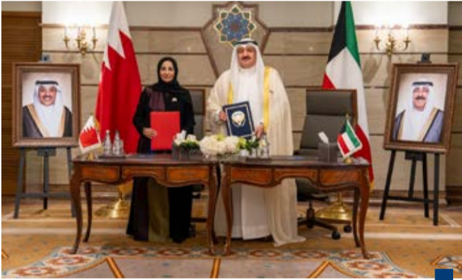
الكويت والبحرين وقعتا مذكرة تفاهم صحية في أكتوبر