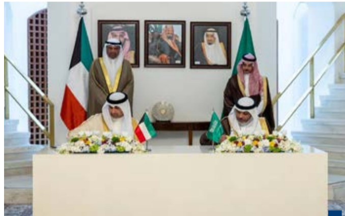
الكويت والسعودية توقعان ٤ اتفاقيات ومذكرات تفاهم في نوفمبر ٢٠٢٥

«دولة الكويت عقدت في العام 2025 شراكات واتفاقيات مع دول ومنظمات ومؤسسات عالمية رائدة