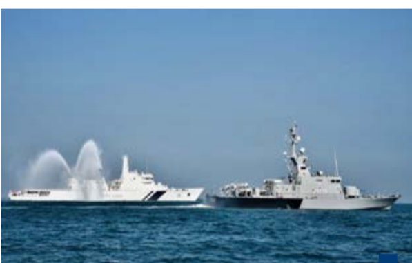
جانب من التمرين

وأضاف أن هذا المؤتمر يساهم في إرساء سياسة وطنية موحدة تستند إلى أحدث الأدلة العلمية وإلى توصيات الهيئات والمنظمات العالمية من أجل تطوير منظومة الوقاية وتخفيض معدلات العدوى وتحسين مخرجات العمليات الجراحية. ولفت الحساوي إلى أن الوزارة أولت