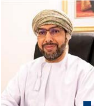
السفير الدكتور صالح الخروصي

الخاصة لما تمثله الدواوين من قيمة كبيرة في الحياة الاجتماعية ومن الآثار الإيجابية المتعددة في سلوك وحياة الأفراد والمجتمع ككل. وأوضح أن من ذلك غرس قيم التآزر والترابط والتكافل الاجتماعي وتبادل الآراء والأفكار بين مختلف فئات وأطياف المجتمع بشكل يجسد معاني الشورى ويمثل المعنى الحقيقي للحياة البرلمانية.