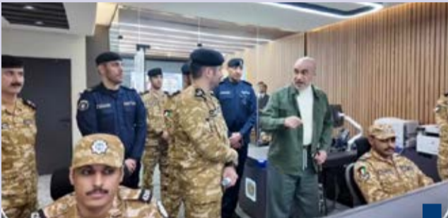
جانب آخر من الجولة

تسهم في رفع مستوى الجاهزية الأمنية وتعزيز كفاءة الرصد المبكر والاستجابة السريعة بما يدعم إحكام السيطرة الأمنية على مختلف القطاعات الحدودية ويسهم في التصدي لمحاولات التسلل وتهريب الممنوعات وحماية البلاد. وأشارت إلى أن الشيخ فهد اليوسف قام بزيارة مركز البحث الحدودي حيث أطلع على جاهزية المركز والإجراءات الأمنية المتبعة واستمع إلى شرح حول آلية العمل الميداني ودور المركز في تعزيز أمن الحدود ورفع كفاءة التنسيق والاستجابة.