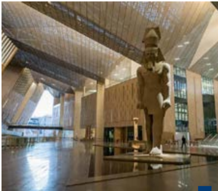
المتحف المصري الكبير

من مياه الأمطار إلى البهو في أثناء هطولها يعد أمراً متوافقاً مع التصميم ومتوقعاً في مثل ذات الوقت من العام. وأكدت الوزارة أن المتحف المصري يواصل استقبال زائريه بانتظام وفقاً لمواعيد العمل الرسمية المعمول بها منذ افتتاحه للجمهور في يوم ٤ من نوفمبر الماضي، دون أي تغيير، وأن حركة الزيارة تسير بصورة طبيعية ومنظمة. ونوهت بأن «المتحف شهد منذ افتتاحه إقبالاً ملحوظاً من الزائرين المصريين والأجانب، بما يعكس الاهتمام الكبير بهذا المشروع الحضاري الفريد»، موضحة أن متوسط عدد الزائرين بلغ حتى الآن ١٥ ألف زائر يومياً، «وهو ما يتناسب مع مخافة القصور لاستيعاب الزائرين والكثافة في مختلف أوقات الزيارة» وفق البيان. وافتتحت مصر المتحف الكبير الذي صمم ليكون أكبر متحف في العالم يحيي آثار حضارة واحدة، مطلع نوفمبر الماضي في حفل ضخم حضره عدد من كبار الشخصيات حول العالم.