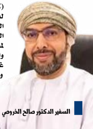
السفير الدكتور صالح الخروصي

(كوئا) - أشاد سفير سلطنة عمان لدى البلاد الدكتور صالح الخروصي، السبت، بدور الكويت في إدراج ملف الديوانية ضمن القائمة التمثيلية لمنظمة الأمم المتحدة للتربية والعلم والثقافة «يونسكو» للتراث الثقافي غير المادي للإنسانية. وقال السفير الخروصي في تصريح له «كونا» أن نجاح الكويت الشقيقة في إدراج الديوانيات في هذه المنظومة الدولية يؤكد الأهمية الخاصة