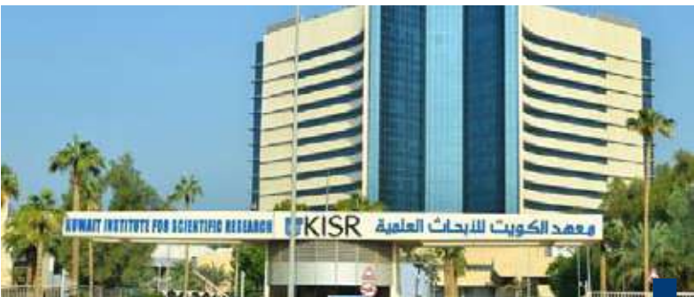
معهد الكويت للأبحاث العلمية

مستقبلية تستهدف مضاعفة الإنتاج مشيراً إلى أن الشركة تهدف للحصول على حصة سوقية «مؤثرة» تكمل دور القطاع الخاص ولا تنافسه وتقدم خياراً ثالثاً للمستهلك يختلف عن المياه المحلاة حكومياً والمياه الجوفية الطبيعية. وأشاد الدويسان بالدعم الكبير والمرونة التي أبدتها الهيئة العامة للغذاء والتغذية في إجراءات الترخيص لهذا المنتج النوعي الجديد مؤكداً أن عوائد المشروع ستوجه وفق خطة (النمو العضوي) للتوسع في مشاريع الشركة واستثماراتها المستقبلية بما يعزز من الموارد المالية للمعهد. وطمأن المستهلك الكويتي بأن مياه (كاظمة) «خضعت لخصوصات دقيقة في مختبرات عالمية ومحلية بشكل يومي لتقدم نموذجاً للمنتج الوطني القائم على أسس علمية رصينة تعزز الثقة في الكفاءات الكويتية وقدرتها على ابتكار حلول مستدامة لمستقبل البلاد».