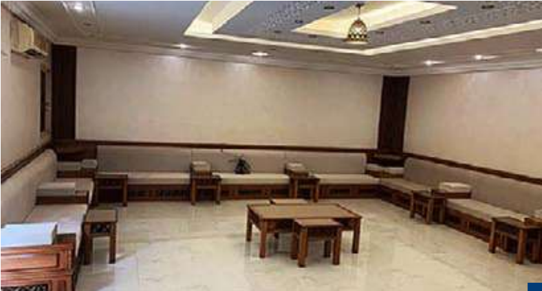
«الديوانية» الكويتية الحديثة