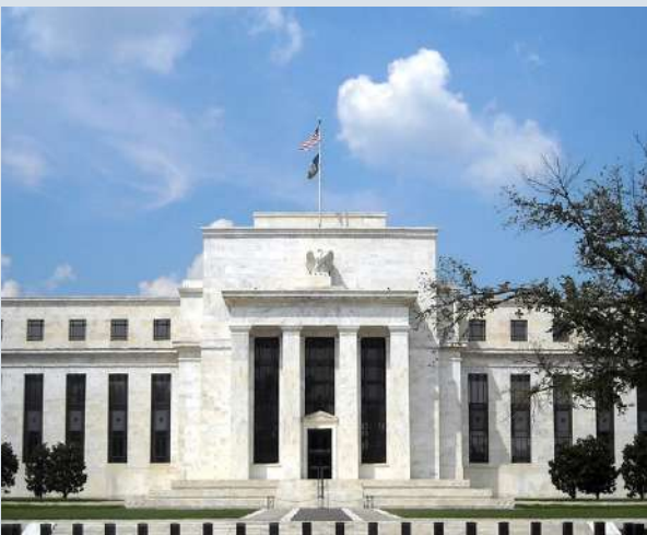
مجلس الاحتياطي الفدرالي الأمريكي

وشدد أشعيا على ضرورة تطوير تشريعات دولية فعالة للحيلولة دون تحول هذه التقنيات إلى أدوات للتصعيد أو الانتهاكات.