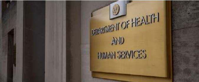
وزارة الصحة الأمريكية

براساد الموظفين في مذكرة الشهر الماضي، أن لقاحات «كوفيد ١٩» ربما ساهمت في وفاة ما لا يقل عن ١٠ أطفال بسبب