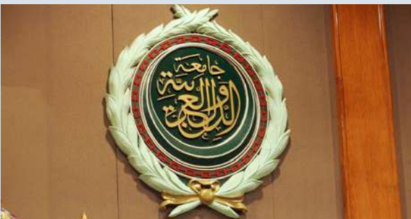
جامعة الدول العربية

ويتضمن برنامج عمل الاجتماع الذي تستضيفه الأمانة العامة لمجلس التعاون الخليجي والمركز الإحصائي لدول مجلس التعاون في الرياض خلال الفترة من ١٠ إلى ١١ ديسمبر ٢٠٢٥ مناقشة استراتيجية العمل الإحصائي الخليجي المشترك (٢٠٢٦-٢٠٣٠) لدعم تطوير