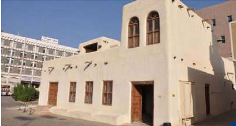
الديوانية، الكويت القديمة

إلى جانب إدراج «البشت» الخليجي والعربي.. وطبق «الكشري» من مصر