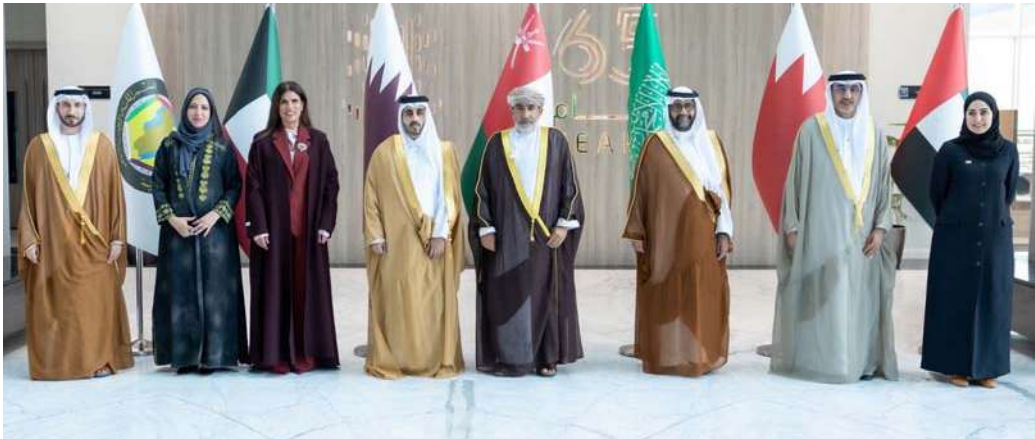
جانب من الاجتماع

العمل الإحصائي في دول مجلس التعاون ككتل إقليمي وإبراز دور الأجهزة الإحصائية الخليجية في منظومة العمل الإحصائي الدولية. ويستعرض البرنامج مستجدات