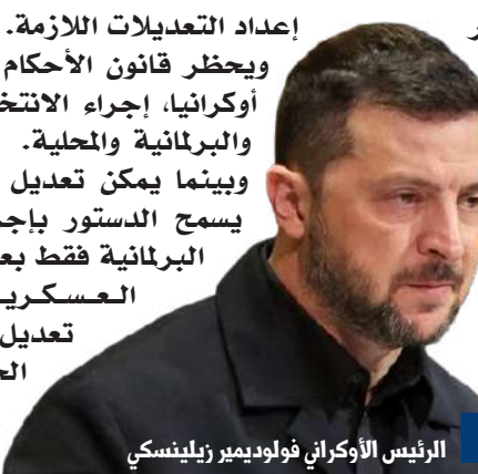
الرئيس الأوكراني فولوديمير زيلينسكي

إعداد التعديلات اللازمة. ويحظر قانون الأحكام العسكرية في أوكرانيا، إجراء الانتخابات الرئاسية والبرلمانية والمحلية. وبينما يمكن تعديل القانون نفسه، يسمح الدستور بإجراء الانتخابات البرلمانية فقط بعد رفع الأحكام العسكرية، كما يمنع تعديل الدستور أثناء الحرب.