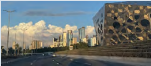
السحب ترزين سماء الكويت