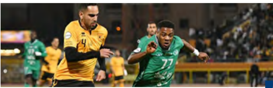
جانب من المباراة

شهدت الساعات الماضية تعرّض عدد من البيانات الداخلية الخاصة للنادي الأهلي لعملية اختراق سيرياني من جهة مجهولة، وهذه المخترقون يتسرب عدد من البيانات السرية الخاصة بالنادي من ضمنها عقود اللاعبين المحترفين بالنادي والأجهزة الفنية والإدارية والعاملين في النادي. ما يندّر بمشكلة كبيرة سيدخل بها النادي. وذكرت صحيفة «عكاظ» السعودية أن هناك اجتماعات مع وزارة الرياضة والجهات المختصة لمعالجة الموقف ومعرفة حجم الأضرار. وكان المخترقون قد هددوا باختراق بيانات عدد من الأندية المحلية والخليجية الأخرى إضافة إلى قاعدة البيانات الخاصة بالاتحاد الآسيوي لكرة القدم وسط تخوف من حدوث تسريبات لمقود وبيانات داخلية للأندية ربما تضعها في مشكلات قانونية مع جهات خارجية.