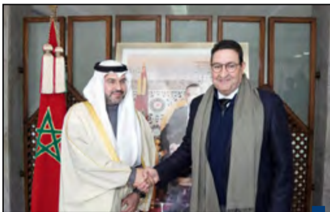
جانب من المقابلة

بحث رئيس الطيران المدني في دولة الكويت الشيخ المهندس حمود مبارك الصباح الأربعاء مع وزير النقل واللوجستيك المغربي عبد الصمد قيوح سبل تعزيز التعاون بين الكويت والمغرب في مجال الطيران المدني.