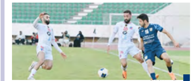
جانب من المباراة