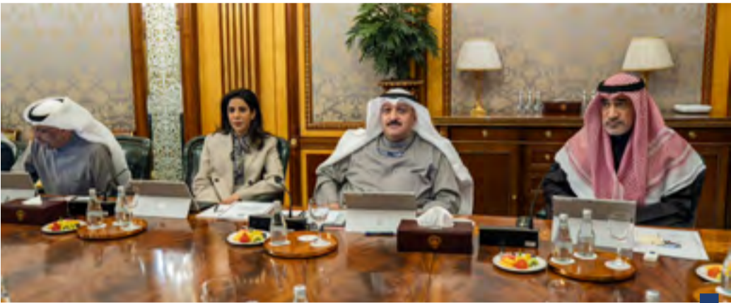
اجتماع المجلس برئاسة رئيس مجلس الوزراء بالإبانة الشيخ فهد اليوسف

«ل يوفق الله الأمير ويسد خطاه لكل ما من شأنه رفعة وتقدم الكويت