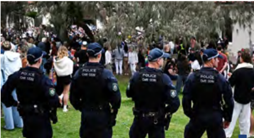
الشرطة تحرس موقع الهجوم

وذكر رئيس الوزراء الأسترالي أنتوني ألباني في بيان أن الأب والابن اللذين نفذًا عملية إطلاق النار كانا مدفوعين «بفكر تنظيمي داعش». وأوضح شرطة تلنكانة أنها لا تملك «سجلاً سلبياً» لساجد عن الفترة التي قضاها في الهند قبل المغادرة.