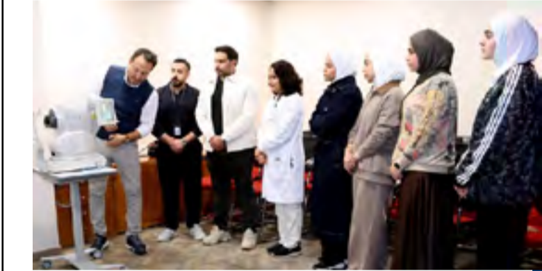
دسمان للسكري، يعقد ورشة حول اعتلال شبكية العين

للإصابة باعتلال الشبكية السكري وعلاطات الإصابة به، وكيفية تشخيص الإصابة به وكذلك مراحل تطور الاعتلال الشبكي وقراءة فحوصات شبكية العين وأحدث التوصيات المتبعة فيما يخص هذا المرض. والعمل هذه باستمرار لما لها من دور حيوي في الاسهام بتطوير خدمات ورعاية طب العيون والارتقاء بمستوى الخدمات العلاجية المقدمة للمرضى، حيث تتناول ورشة العمل هذه عدة محاور من بينها عوامل الخطورة