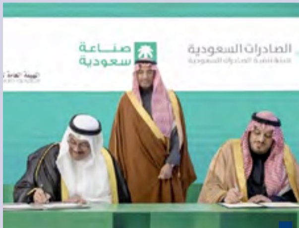
جانب من التوقيع

أعمال البنود المستحدثة والمضافة. ووافق ديوان المحاسبة موافقة مشروطة على مناقصة استئجار مركبات متنوعة لوزارة الأشغال العامة بقيمة نحو ٥ ملايين دينار.