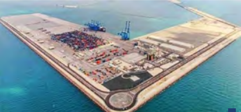
مشروع ميناء مبارك الكبير

وافق ديوان المحاسبة موافقة مشروطة على طلب وزارة الأشغال العامة بالموافقة على توقيع العقد المباشر «عقد الهندسة والتوريدات والبناء لاستكمال مشروع ميناء مبارك الكبير» المرحلة الأولى الجزء (١٠A STAGE - PHASE). وتبلغ قيمة العقد مليار و٢١٨ مليون دينار» ما يعادل أكثر من ٤ مليارات دولار أمريكي.»