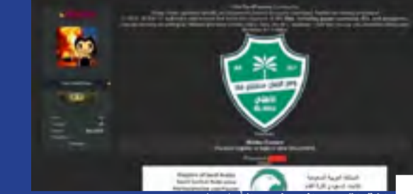
اختراق سيرياني يضرب الأهلي السعودي

شهدت الساعات الماضية تعرّض عدد من البيانات الداخلية الخاصة للنادي الأهلي لعملية اختراق سيرياني من جهة مجهولة، وهذه المخترقون يتسرب عدد من البيانات السرية الخاصة بالنادي من ضمنها عقود اللاعبين المحترفين بالنادي والأجهزة الفنية والإدارية والعاملين في النادي. ما يندّر بمشكلة كبيرة سيدخل بها النادي. وذكرت صحيفة «عكاظ» السعودية أن هناك اجتماعات مع وزارة الرياضة والجهات المختصة لمعالجة الموقف ومعرفة حجم الأضرار. وكان المخترقون قد هددوا باختراق بيانات عدد من الأندية المحلية والخليجية الأخرى إضافة إلى قاعدة البيانات الخاصة بالاتحاد الآسيوي لكرة القدم وسط تخوف من حدوث تسريبات لمقود وبيانات داخلية للأندية ربما تضعها في مشكلات قانونية مع جهات خارجية.