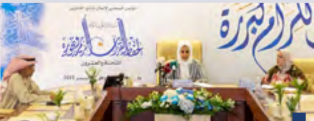
المؤتمر الصحفي للإعلان عن الفائزين