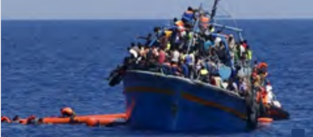
مركب يحمل مهاجرين

وذكرت بعض المصادر أنه تم نقل الوثائق الموجودة في المركز بعد الحريق إلى متحف دمشق الوطني، ثم أعيد قسم منها للمركز لاستئناف العمل عليها بالترميم والرقمنة وغير ذلك.