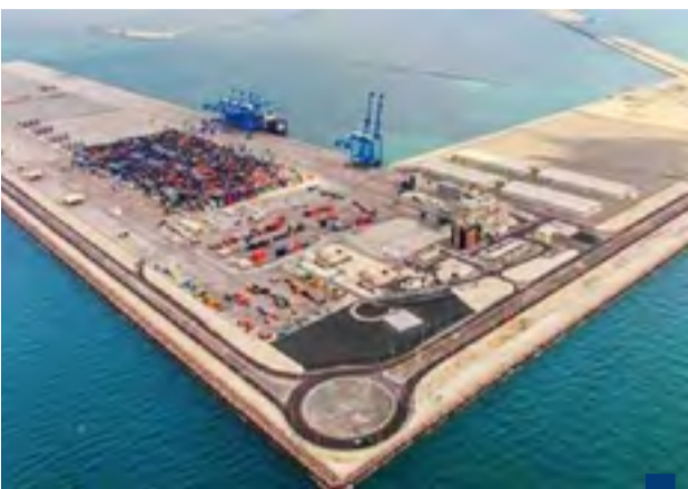
مشروع ميناء مبارك الكبير

وافق ديوان المحاسبة موافقة مشروطة على طلب وزارة الأشغال العامة بالموافقة على توقيع العقد المباشر «عقد الهندسة والتوريدات والبناء لاستكمال مشروع ميناء مبارك الكبير»- المرحلة الأولى الجزء (١ - PHASE A STAGE ٥A). وتبلغ قيمة العقد مليار و٢١٨ مليون دينار. وبعد موافقة الديوان أصبح من حق وزارة الأشغال توقيع العقد المباشر مع الشركة التي ستنفذ المشروع وهي الشركة الصينية الحكومية للإنشاءات والمواصلات التابعة لوزارة النقل الصينية CHINA COMMUNICATION CONSTRUCTION COMPANY,CCCC.