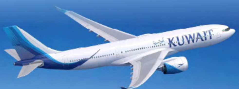
الخطوط الجوية الكويتية

ذكرت الخطوط الجوية الكويتية، الأربعاء، أن هناك احتمالية لإعادة جدولة بعض الرحلات، من مساء يوم الخميس حتى مساء الجمعة. وقالت في بيان على منصة «إكس» إنه نظرا لاحتوائية عدم استقرار الأحوال الجوية في منطقة الخليج العربي من مساء غد الخميس حتى مساء الجمعة المقبلة، وتطبيقا لمعايير سلامة المسافرين والطائرات، تود الخطوط الجوية الكويتية الاعلان عن