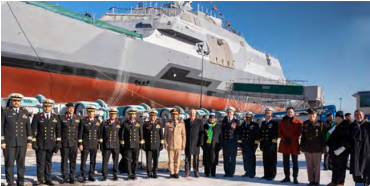
السعودية تعمّم أولى سفنها القتالية

وشدد عبدالعاطي على أهمية ضمان استدامة وقف إطلاق النار في غزة وتنفيذ استحقاقات المرحلة الثانية من خطة الطول (٤٩١٥٧٢) شرقاً. وأوضح أن أسباب حدوث هذه الهزة تعود إلى الضغوط التكنولوجية الناتجة عن تصادم الصفيحة الجيولوجية لشبه الجزيرة العربية والصفيحة الجيولوجية الأوراسية عند منطقة جبال زاغروس في إيران التي أدت إلى تنشيط الصدوع الموجودة بالقشرة الأرضية بالمنطقة الشرقية بالملكة مسببة حدوث هذه الهزة.