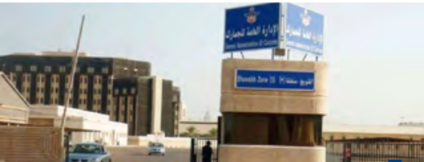
الإدارة العامة للجمارك

رئيس الجمارك لشؤون المنافذ وشؤون البحث والتجري الجمركي إضافة إلى تغيير مسمى نائب المدير العام للشؤون الإدارية والمالية إلى