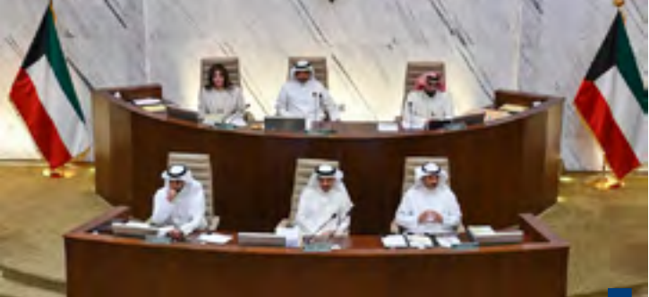
جلسة المجلس البلدي

من البلدية للمدارس الخاصة في مناطق السكن الخاص في نهاية العام الدراسي ٢٠٢٧ - ٢٠٢٨ ليتيم إغلاق تلك المدارس من قبل وزارة التربية.