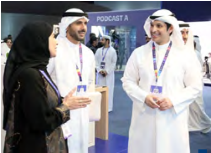
وزير الإعلام في قمة «بريدج ٢٠٢٥»