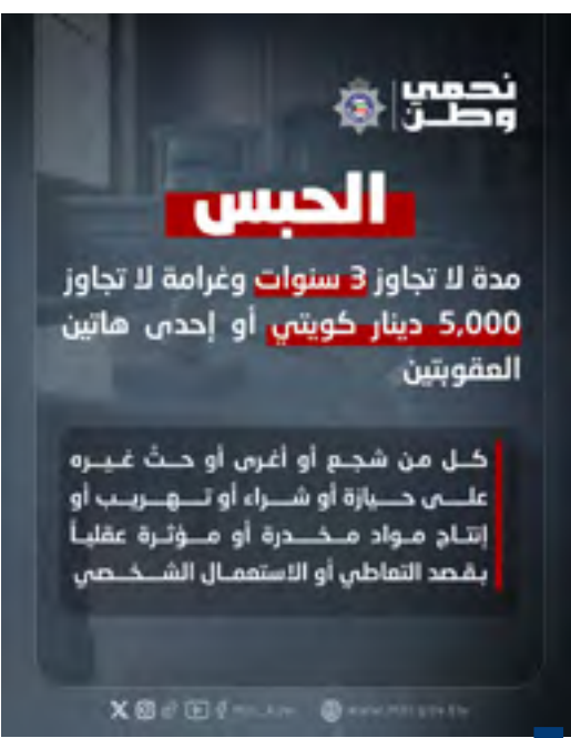
بوستر التوعية بقانون المخدرات الجديد