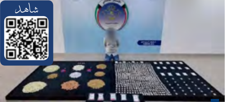
جانب من المضبوطات

الآفة الدماره شديدة على أن يد القانون تستل إلى الجرمين أينما كانوا وأن عمليات الرصد والمتابعة قائمة على مدار الساعة.