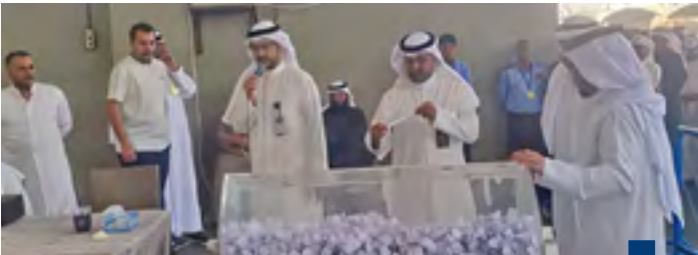
جانب من القرعة

البسطات لمدة ٦ أشهر فقط وفقا للشروط والضوابط الواردة في لائحة الأسواق العامة الصادرة بالقرار الوزاري رقم (٢٠٠٦/١٥١). وأشار إلى أن عدد الطلبات التي تقدمت