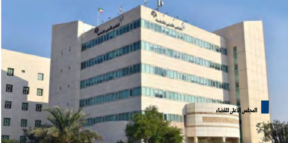
المجلس الأعلى للقضاء

أعلن المجلس الأعلى للقضاء الاثنين أن محكمة التمييز فصلت بدواورها الختامة خلال شهر نوفمبر الماضي في عدد ١٧٧٥ طعنا وذلك تنفيذا لخطة معالجة إشكالية تراكم الطعون أمام محكمة التمييز مع المحافظة على جودة الأحكام. وذكر المجلس الأعلى للقضاء في بيان أنه امتثالا للتوجيهات السامية بسرعة البت في القضايا والفصل فيها والحفاظ على حقوق المتقاضين. وأشارت إحصائية محكمة التمييز عن شهر نوفمبر الماضي (الجلسات والطعون المفضول القضايا والفصل فيها وفي إطار الجهود المبذولة والرامية إلى الحفاظ على حقوق المتقاضين فقد فصلت محكمة التمييز في عدد ١٧٧٥ طعنا شاملة (الأحكام الجزائية ١٧٧٥ طعنا بجلسات دوائر الجزائي.