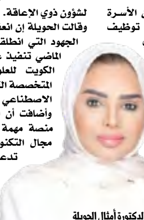
الدكتورة أمثال الحويلة

(كونا) - أكدت وزيرة الشؤون الاجتماعية وشؤون الأسرة والطفولة الدكتورة أمثال الحويلة، الاثنين، أن توظيف التكنولوجيا المساندة في تمكين الأشخاص ذوي الإعاقة أصبح اليوم عنصرا أساسيا في منظومة حقوقهم وجهود دمجهم الشامل في المجتمع. جاء ذلك في كلمة ألقتها الحويلة لافتتاح أعمال المؤتمر الدولي الثاني لتكنولوجيا ذوي الاحتياجات الخاصة، والمؤتمر الدولي العاشر لتكنولوجيا الوصول والتمكين» اللذان تستضيفهما كلية الكويت للعلوم والتكنولوجيا بتنظيم مشترك مع مكتب الأمم المتحدة في الكويت ومنظمة الأمم المتحدة للتربية والعلم والثقافة «يونسكو» والمنظمة العربية للتربية والثقافة والعلوم «الألكسو» بالتعاون مع الهيئة العامة