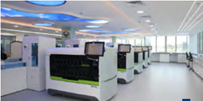
المختبر الوطني لشلل الأطفال

(كونا) - أعلنت وزارة الصحة، الاثنين، تحقيق المختبر الوطني لشلل الأطفال إنجازا نوعيا يحصله على نسبة ١٠٠% بأول اختبار كفاءة للعينات البيئية بمنظمة الصحة العالمية.