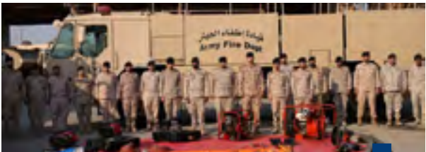
جانب من الإطعام التنسيق