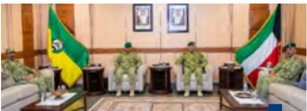
جانب من الزيارة

وأضافت أن الاجتماع عقد برئاسة مساعد آمر قوة الواجب العميد الركن بدر الشطي بمشاركة عدد من ضباط وحدات الجيش المختلفة.