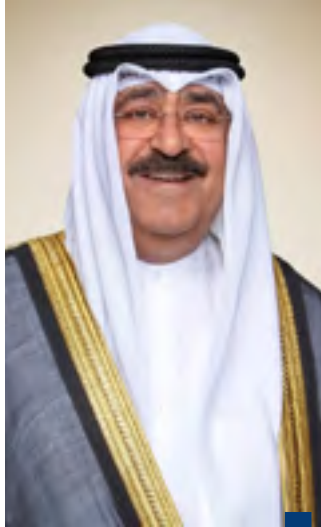
سمو الأمير مشعل الأحمد

صباح خالد الحمد الصباح ببرقية تهنئة إلى الرئيس أحمد الشرع رئيس الجمهورية العربية السورية الشقيقة ضمنها سموه خالص تهانيه بمناسبة ذكرى يوم التحرير لبلاد. تمنينا سموه لفخامته موفور الصحة والعافية وللجمهورية العربية السورية وشعبها الشقيق المزيد من التقدم والتمناه. كما بعث سمو الشيخ أحمد عبدالله الأحمد الصباح رئيس مجلس الوزراء ببرقية تهنئة إلى فخامة الرئيس أحمد الشرع رئيس الجمهورية العربية السورية الشقيقة بمناسبة ذكرى يوم التحرير لبلاد.