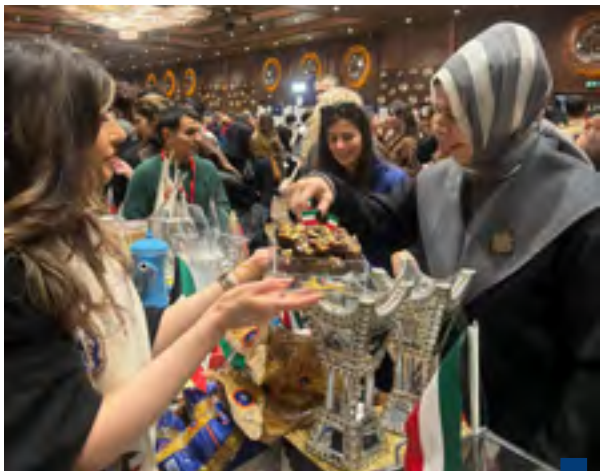
جانب من البازار الخيري السنوي