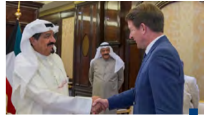
بمناسبة زيارته للبلاد

صدر الأحد في الجريدة الرسمية «الكويت اليوم» قرار مجلس الوزراء رقم ١٤٨٢ لسنة ٢٠٢٥ بسحب شهادة الجنسية الكويتية من ٧ أشخاص. ونص على سحب الجنسية الكويتية ممن يكون اكتسبها مع حامل تلك الشهادة بطريقة التبيعية. واستند قرار مجلس الوزراء إلى المادة ٢١ مكرراً «٥» من قانون