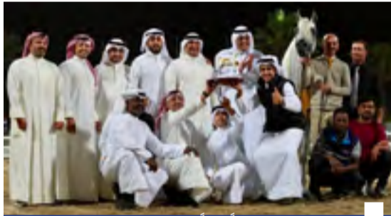
مربط الحمد يحقق نجاحاً كبيراً

الجائزة الرائدة لأفضل مزرعة إنتاج وخمس ميداليات ذهبية للخيول مربط الحمد يحقق نجاحاً كبيراً في بطولة الخيل العربي الوطنية لجمال الخيل العربي