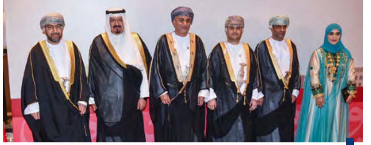
سمو رئيس الوزراء مشاركا في حفل سفارة عمان