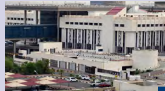
وزارة التجارة والصناعة

(كويتا) - أعلنت وزارة التجارة والصناعة الأحد رصدتها عدداً من المخالفات في قطاعات العقار والتجارة والذهب والمعادن الثمينة وذلك في إطار حرصها على تعزيز الشفافية ودعم منظومة مكافحة غسل الأموال وتمويل الإرهاب. وأوضحت الوزارة في بيان صحفي أن ذلك يأتي انطلاقاً من مسؤوليتها الوطنية وواجبها القانوني بهدف تعزيز الردع العام ورفع مستوى التزام المنشآت بالقوانين والتنظيمات مبيّنة أنها فرضت جزاءات مالية عن الأشهر الماضية لأغسطس وسبتمبر وأكتوبر. وقالت الوزارة إن نشاط سماسة العقار شهد مخالفة عدم تقديم دراسة تقييم المخاطر مستوفية متطلبات القانون والقرارات الوزارية ذات الصلة وتم فرض غرامة مالية بقيمة ٥٠٠ ديناراً كويتي (نحو ١٦٢٧ دولاراً أمريكياً) على ثلاث شركات. وأضافت أن نشاط سماسة العقار أيضاً سجل مخالفة عدم الالتزام بوضع السياسات والإجراءات والنظم والضوابط الداخلية الخاصة بمكافحة غسل الأموال وتمويل الإرهاب وتم فرض غرامة مالية بقيمة ٥٠٠ ديناراً (نحو ١٦٢٧ دولاراً أمريكياً). وتلقت أن النشاط ذاته سجل مخالفة التعامل مع المبالغ النقدية التي تزيد على ٣٠٠٠ ديناراً كويتي (نحو ٩٧٧٠ دولاراً) لتؤاثير أقل من ٥٠ فاتورة وتم فرض غرامة مالية بقيمة ١٠٠٠ ديناراً (نحو ٣٢٥٥ دولاراً). وأضافت بأن النشاط سجل أيضاً مخالفة عدم تطبيق تدابير العناية الواجبة للتأثير التي تزيد قيمتها على ٣٠٠٠ ديناراً (نحو