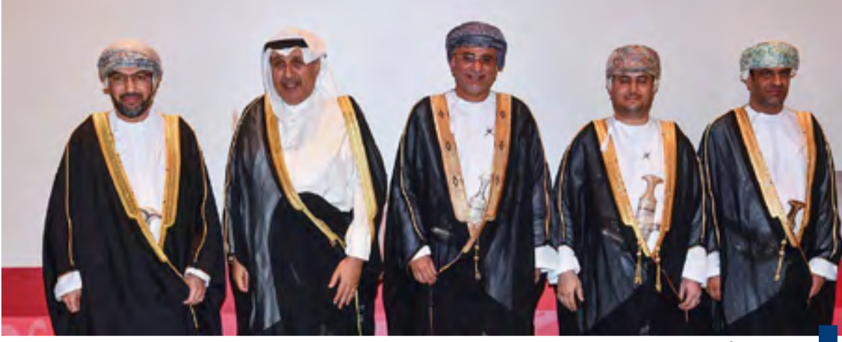
وزير الديوان الأميري الشيخ حمد جابر العلي مشاركا في حفل