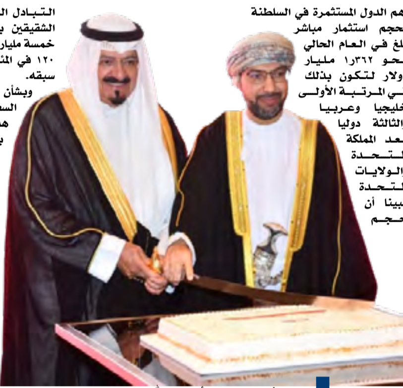
السفير العماني وسمو الشيخ أحمد العبدالله خلال الحفل

أحد سفير سلطنة عمان لدى دولة الكويت الدكتور صالح الخروصي خلال حفل أقامته سفارة الكويت في سلطنة عمان بالتميز التاريخي الوثيقة والعلاقات القائمة بين البلدين الشقيقين والتي تحظى برعاية خاصة وتوجيهات سامية من لادن القيادة السياسية فيهما. جاء ذلك في كلمة ألقاها السفير الخروصي خلال حفل أقامته سفارة عمان لدى دولة الكويت بمناسبة اليوم الوطني للسلطنة بحضور سمو الشيخ أحمد عبدالله الأحمد الصباح رئيس مجلس الوزراء وليض من الشيوخ والسؤولين ورؤساء البعثات الدبلوماسية. وقال السفير إن العلاقات الكويتية - العمانية «أخوية راسخة ومتجددة» مضيفاً أن قيادتي البلدين اتخذتا خطوات سياسية واقتصادية وثقافية عززت مسارات التعاون الثنائي. وذكر أن العام الحالي شهد خطوات مهمة في مسار التعاون السياسي