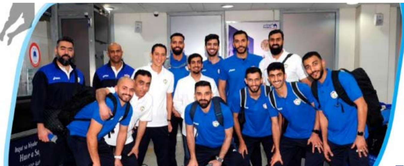
منتخب الكويت للطائرة