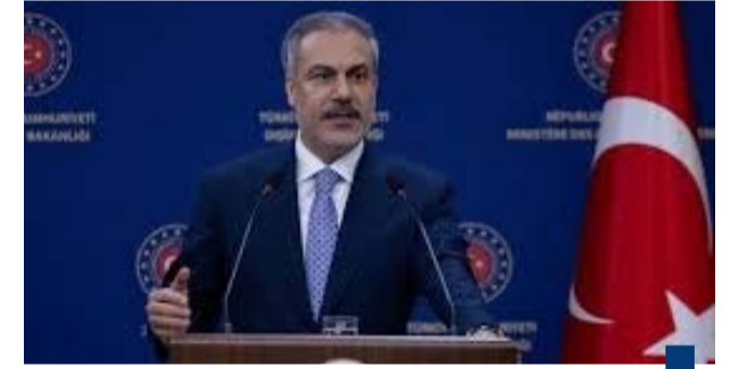
وزير الخارجية التركي

وأضافت بروس ان إنشاء ممر للمساعدات الإنسانية هو أمر «اتفق عليه الطرفان بالفعل» مشيرة إلى ان زيارة ويتكوف ستضع المسات الأخيرة على هذا الاتفاق. وأكدت ان الرئيس الأميركي لا يزال يتطلع إلى تحقيق السلام في قطاع غزة ويعتبره «الهدف الاسمي» مشيرة إلى ان ترامب «أمله كبير بأن نطرح وقفاً جديداً لإطلاق النار بين الطرفين».