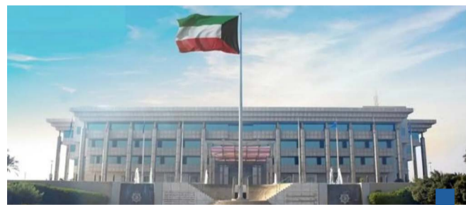
مبنى وزارة الداخلية

تمكنت الإدارة العامة لمباحث شؤون الإقامة من كشف شبكة منظمة متورطة في تسهيل إصدار الإقامات بصورة غير قانونية مقابل مبالغ مالية، والتزوير في المحررات الرسمية، واستغلال بيانات غير صحيحة في أذونات العمل.