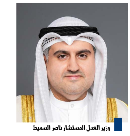
وزير العدل المستشار ناصر السميطة

(كويتا) - أصدر وزير العدل المستشار ناصر السميطة قراراً بإلغاء كل أعمال لجنة اختيار وظيفة باحث مبتدئ قانوني (المؤهلة لوظيفة وكيل نيابة) والفريق المعاون المشكلين بموجب القرارين رقمي (١٦٠٢) و(١٦٠٣) لسنة ٢٠٢٤ وما ترتب عليهما من إجراءات ونتائج واعتبارها كأن لم تكن مع إعادة تنظيم الاختبارات التحريرية والمقابلات الشخصية للمتقدمين وفق آلية تعلن لاحقاً. وقال الوزير السميطة لوكالة الأنباء الكويتية (كويتا) الأربعاء إن ذلك يأتي انطلاقاً من حرص (العدل) على ترسيخ مبدأ تكافؤ الفرص وتحقيق العدالة والشفافية في تولي الوظائف القضائية وحفاظاً على ثقة المجتمع في رسالة القضاء. وأضاف أن الوزارة ستعيد تنظيم الاختبارات التحريرية والمقابلات الشخصية للمتقدمين وفق آلية جديدة يتم إعلانها لاحقاً بما يضمن سلامة الإجراءات