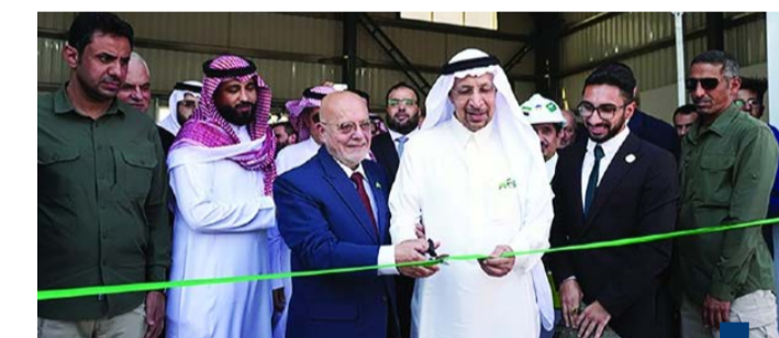
افتتاح أول مصنع للأسمنت الأبيض في ريف دمشق

إعمار البلاد. وقد أوقفت الحكومة الجديدة الضرائب المفروضة على الأسمنت المنتج محلياً بهدف تعزيز قدرته التنافسية وتحفيز الشركات على زيادة الإنتاج. وقال الرئيس التنفيذي لمجموعة عبيد سبيعي، خلال حفل التدشين إن المصنع الجديد يوفر 130 فرصة عمل غير مباشرة، وأكثر من 1000 فرصة عمل غير مباشرة، في القطاعات اللوجستية الساندة والمستفيدة. ووقعت شركة «أسمنت الجوف» السعودية في يناير الماضي، عقداً