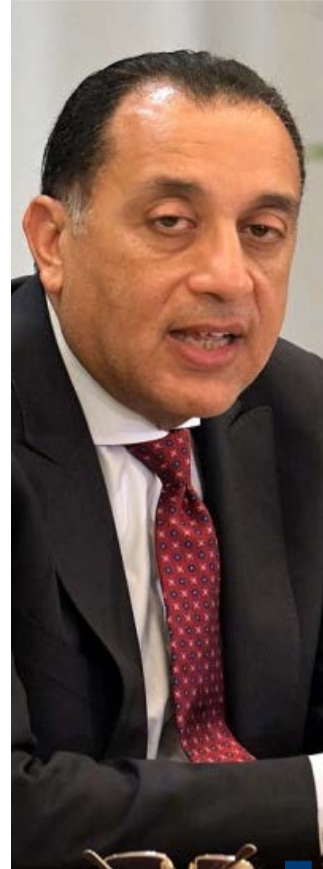
الدكتور مصطفى مدبولي

(كونا) - أكد رئيس الوزراء المصري الدكتور مصطفى مدبولي الأربعة عمق العلاقات بين بلاده والمملكة العربية السعودية مشيراً إلى أن قوة هذه العلاقات وعمقها تعد من الثوابت الأساسية للسياسة المصرية ورؤية القيادة السياسية في البلدين. وقال مدبولي خلال المؤتمر الصحفي الذي عقده عقب الاجتماع الأسبوعي لمجلس الوزراء أن العلاقة مع السعودية علاقة استراتيجية أخوية مبنية على الوحدة. وأشار إلى أن مصر تتشارك مع السعودية في العديد من القضايا والتحديات مضيئاً أن الأهم توافق الرؤى في التعامل مع التحديات والقضايا التي تواجه الأمة العربية والإسلامية. وأضاف أن القيادة السياسية في البلدين لديها علاقة شديدة التميز تحمك التواصل