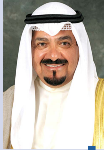
سمو رئيس الوزراء

وبعث سمو الشيخ أحمد عبدالله الأحمد الصباح رئيس مجلس الوزراء ببرقية تهنئة إلى الرئيس عبدالفتاح السيسي رئيس جمهورية مصر العربية