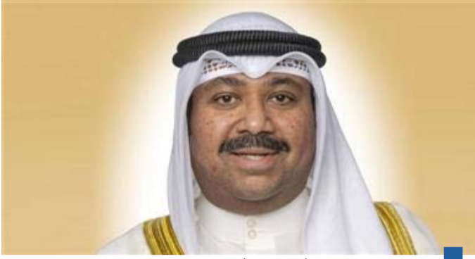
وزير الدفاع الشيخ عبدالله علي عبدالله الصباح

مؤكد عمق علاقات الأخوة والعمل المشترك بين البلدين الشقيقين