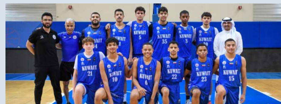
منتخب الكويت لكرة السلة

يستهل فريق كرة القدم بنادي الكويت تحضيراته للموسم الجديد، مساء الخميس، ويستعد الفريق موسم حافل يدافع فيه عن الألقاب المحلية التي فاز بها في الموسم الماضي بفوزه بـ «دوري زين» الممتاز وكأسي سمو ولي العهد، والسوبر، فيما كان اللقب الرابع متاحاً له، قبل أن يتم تأجيل المباراة النهائية لكأس سمو الأمير أمام العربي إلى الموسم المقبل. كما سيخوض الفريق منافسة خارجية عبر