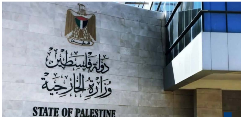
وزارة الخارجية والمغتربين الفلسطينية

الاحتلال هي امعان في تقويض فرصة تطبيق حل الدولتين خاصة بعد قرار الكنيست رفض الدولة الفلسطينية كما أنها دعوة صريحة لتصعيد دوامة الحروب والعنف. وطالبت في هذا الصدد الدول والمجتمع الدولي بالتعامل بمنتهى الجدية مع تلك التحركات الداعية لتكريس ضم الضفة وإدانتها بقوة واتخاذ ما يلزم من إجراءات لوقفها فوراً خاصة مع اقتراب عقد المؤتمر الأممي لحل الدولتين. وأرسلت الهيئة الخيرية الأردنية، بالتعاون مع منظمات دولية إغاثية وبالتنسيق مع القوات المسلحة الأردنية - الجيش العربي، قوافل مساعدات برية إلى قطاع غزة. ووفق وكالة الأنباء الأردنية (بترا)، الأربعة، «كانت القوافل محملة بالمواد الغذائية، وبشكل أساسي مادة الطحين» مشيرة إلى أن الأردن يستعد لإرسال المزيد من القوافل الإغاثية، بعد الحصول على ضمانات لإيصال المواد، وتوزيعها على مستحقيها.