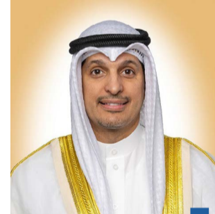
الوزير عبد الرحمن المطيري

وجه وزير الإعلام والثقافة وزير الدولة لشؤون الشباب رئيس المجلس الوطني للثقافة والفنون والآداب عبد الرحمن المطيري باستحداث فكرة «اللقاء التعريفي» للعروض المسرحية المجازة من قبل المجلس الوطني.