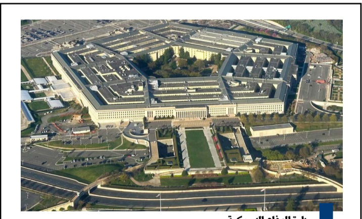
وزارة الدفاع الأمريكية

أفادت صحيفة «واشنطن بوست» نقلاً عن مصادرهما بأن إدارة الرئيس الأمريكي دونالد ترامب توقف برامج مساعدة الأفغان على الهجرة إلى الولايات المتحدة. وحسب مسؤولين في الخارجية الأمريكية والوثائق التي اطلعت عليها «واشنطن بوست»، فإن واشنطن توقف برامج مساعدة أكثر من ٢٥٠ ألفاً من الأفغان. ويخشى كثيرون ممن شملتهم تلك البرامج ترحيلهم إلى أفغانستان حيث قد يواجهون أعمالاً انتقامية من جانب حركة «طالبان». وأشارت الصحيفة إلى أنه تم بتوجيه تقليص عدد الكوادر في الخارجية الأمريكية إغلاق المكتب الذي كان معنياً بمساعدة الأفغان. وكانت السلطات الأمريكية قد وعدت في وقت سابق بمساعدة الأفغان الذين فرروا مغادرة البلاد بعد استيلاء حركة «طالبان» على السلطة في عام ٢٠٢١.