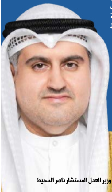
وزير العدل المستشار ناصر السميطة

(كويتا) - أصدر وزير العدل المستشار ناصر السميطة قرارا بإلغاء كل أعمال لجنة اختيار وظيفة باحث مبتدئ قانوني (المؤهلة لوظيفة وكيل نيابة) والفريق المعاون المشكلين بموجب القرارين الوزاريين رقمي (١٦٠٢) و(١٦٠٣) لسنة ٢٠٢٤ وما ترتب عليها من إجراءات ونتائج واعتبارها كأن لم تكن مع إعادة تنظيم الاختبارات التحريرية والمقابلات الشخصية للمتقدمين وفق آلية تعلن لاحقا.