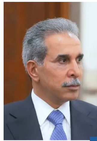
رئيس مجلس القضاء الأعلى في العراق، فائق زيدان

«قرار المحكمة بإلغاء اتفاقية خور عبدالله أثار تداعيات قانونية ودولية لا يستهان بها» «الاتحادية العراقية» تجاوزت صلاحيتها بإلغاء الاتفاقية وافترق قرارها في 2023 إلى الأساس الدستوري والقانوني