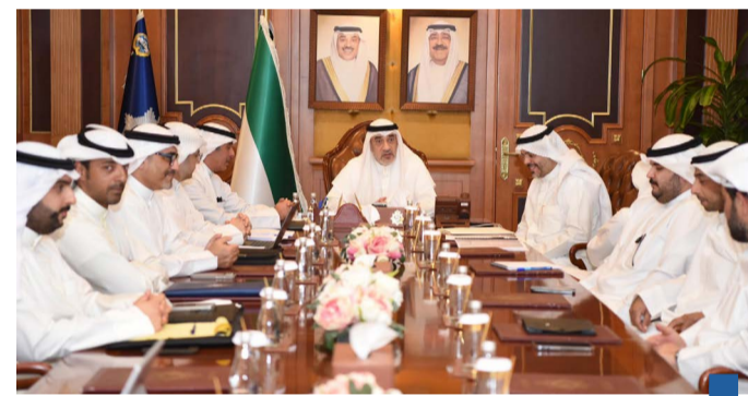
الاجتماع برئاسة اليوسف

عقدت لجنة تنظيم العمل الإنساني والخيري اجتماعها السابع الأربعاء برئاسة النائب الأول لرئيس مجلس الوزراء وزير الداخلية الشيخ فهد يوسف سعود الصباح وبمشاركة ممثلي الجهات الحكومية المعنية.