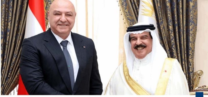
جانب من جلسة المباحثات

(كونا) - أعلن العاهل البحريني الملك حمد بن عيسى الأربعة إقامة بعثة دبلوماسية دائمة لبلاده في بيروت فيما أكد أهمية تفعيل اللجنة البحرينية - اللبنانية المشتركة لتنفيذ مذكرات التفاهم والاتفاقات المبرمة واستكشاف المزيد من الفرص الواعدة التي تخدم مصالح البلدين. ونقلت وكالة أنباء البحرين (بنا) عن الملك حمد القول في كلمة خلال جلسة مباحثات موسعة مع الرئيس اللبناني جوزاف عون بحضور كبار المسؤولين في البلدين بالنامة «يسرنا أن نتزامن زيارتكم الكريمة مع الذكرى ٥٢ لإقامة العلاقات الدبلوماسية بين بلدينا الشقيقين واستئناف التمثيل الدبلوماسي لمملكة البحرين في لبنان». وتابع «وبهذه المناسبة نعلن بكل اعتزاز عن قرارنا بإقامة بعثة دبلوماسية