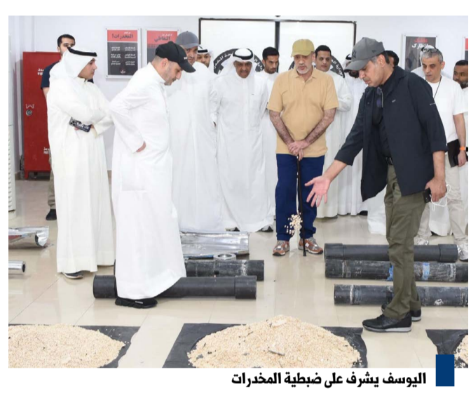
اليوسف يشرف على ضبطية المخدرات

في إطار الجهود الأمنية المتواصلة لتصدي لآفة المخدرات وحماية المجتمع من سمومها، تمكن قطاع الأمن الجنائي ممثلاً في الإدارة العامة لمكافحة المخدرات، وبالتعاون مع الإدارة العامة للجمارك وقوة الإطفاء العام، من إحباط محاولة تهريب كمية ضخمة من المؤثرات العقلية تقدر بحوالي (٤) مليون حبة من مادة الكبتاجون، وتبلغ قيمتها السوقية نحو (١٢) مليون دينار كويتي، حيث كانت مخبأة بطريقة مبتكرة داخل أنابيب مخصصة لمعالجة المياه. وتعود تفاصيل الواقعة إلى ورود معلومات سرية للإدارة العامة لمكافحة المخدرات تفيد باعتراف تهريب كمية كبيرة من الكبتاجون إلى البلاد بطريقة مبتكرة، حيث تم على الفور التنسيق مع الإدارة العامة للجمارك لتسهيل خروج الشحنة ومتابعة خط سيرها وضبط المتورطين. وقد أسرت الجهود عن ضبط متهم داخل البلاد، في حين أن المتهم الرئيسي خارج البلاد، وتم التنسيق مع جهاز مكافحة مخدرات نظير في إحدى الدول لضبطه