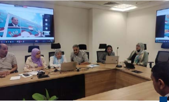
جانب من الاجتماع في وزارة العمل المصرية

الجانب الكويتي أكد ترحيبه الدائم بالعمالة المصرية وأشاد بمهنتها وجدارتها في العمل الجانب المصري جدد تأكيده الجاهزية لتوفير الكوادر المدربة لسوق العمل الكويتي في كافة المجالات