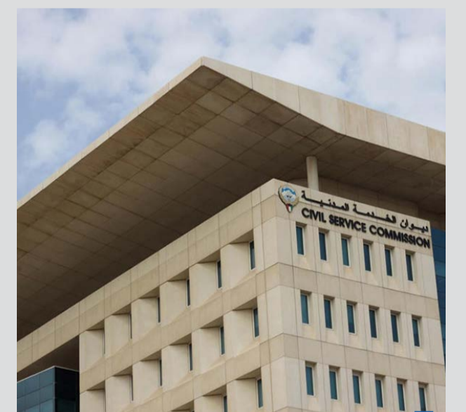
ديوان الخدمة المدنية

أعلنت المؤسسة العامة للرعاية السكنية تشغيل إنارة الطرق في ضاحية جنوب عبدالله المبارك. وأضافت المؤسسة في بيان صحافي أن إنارة الطرق في ضاحية جنوب عبدالله المبارك هو أول عقد يتم تغذيته من مصادر الطاقة المتجددة على مستوى مشروعات المؤسسة. وأكدت المؤسسة حرصها على توفير وترشيد استهلاك الطاقة في استخدامات عدة داخل مشروعات الرعاية السكنية سواء من خلال إنارة الطرق أو المباني العامة الذكية. وأشارت إلى أنها تتابع تنفيذ ٣١ مبنى عام في ضاحية جنوب عبدالله المبارك إلى جانب ١٨٦ مبنى آخر في المدن السكنية