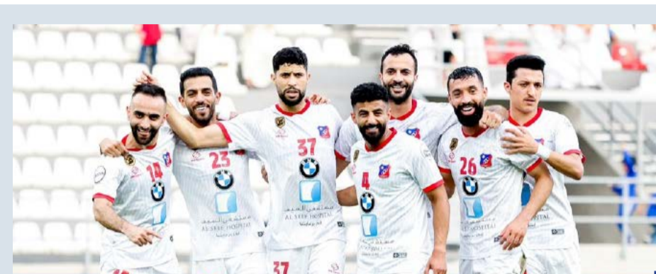
فريق كرة القدم بنادي الكويت

أوقعت القرعة التي سحبت في مقر الاتحاد العربي لكرة الطائرة في البحرين، منتخب الكويت ضمن المجموعة الثانية في البطولة العربية الـ ١٧ للناشئين، التي تستضيفها العاصمة الأردنية عمان من ١٤ إلى ٢٦ أغسطس المقبل.