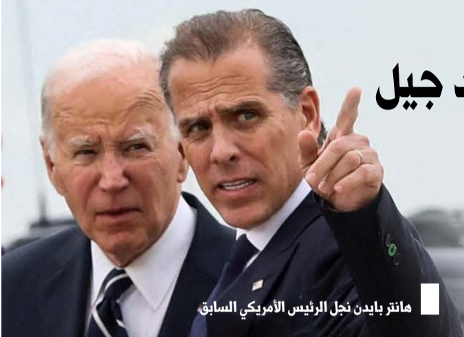
هانتر بايدن نجل الرئيس الأمريكي السابق

اتهم نتنياهو باستغلال التهديد الإيراني كأداة سياسية، قائلاً: «نتنياهو كان مخطئاً في كل مرة، إنه القننى الذي ادعى وجود ذئب (إنداز كاذب) ويوماً ما سيأتي الذئب الحقيقي». مشيراً إلى تحذيرات نتنياهو المتكررة بشأن التهديد النووي الإيراني منذ عام ١٩٩٦. وانتقد بايدن إهمال نتنياهو لقضية الأسرى، قائلاً: «لم يقل كلمة واحدة عن الرهائن الذين يرفض التفاوض للإفراج عنهم». بينما يركز على أمور شخصية مثل حفل زفاف ابنته الملقى. واصفاً إياه بـ«الوحش».