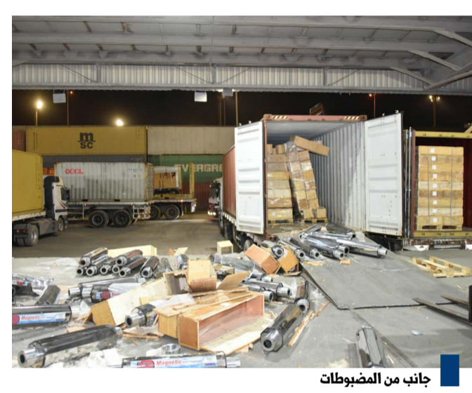
جانب من المضبوطات