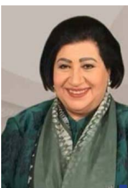
الإعلامية القديرة أمل عبدالله