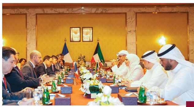
اجتماع وزيرة المالية مع المسؤول الفرنسي