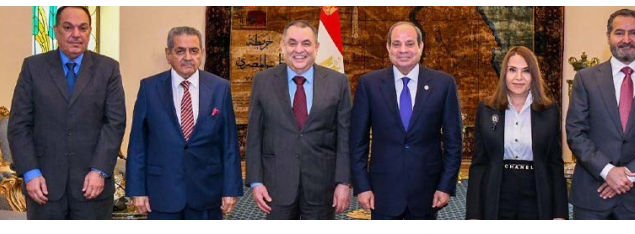
الرئيس المصري يستقبل الوفد الاستثماري الكويتي

أكد الرئيس المصري عبدالفتاح السيسي الخميس، أن العلاقات بين بلاده ودولة الكويت نموذج للتعاون البناء والمثمر القائم على الثقة والاحترام المتبادل. وذكر المتحدث باسم الرئاسة المصرية السفير محمد الشناوي، أن ذلك جاء خلال استقبال الرئيس السيسي وفداً استثمارياً كويتياً برئاسة رئيس الجانب الكويتي في مجلس التعاون الكويتي المصري محمد الصقر. وأعرب الرئيس السيسي عن اعترازه بعلاقة الأخوة التي تربطه وصاحب السمو أمير البلاد الشيخ مشعل الأحمد، والروابط الأخوية المثينة بين الكويت ومصر على مختلف المستويات الرسمية والشعبية. وأشار إلى التحديتات التي يشهدها الاقتصاد العالمي وكذا الظروف الإقليمية والدولية الراهنة وهو