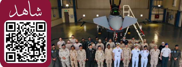
جانب من زيارة مسؤول الناتو العسكري

(كونا) - قام رئيس اللجنة العسكرية لحلف شمال الأطلسي (ناتو) الفريق كافودرونغ والوفد المرافق له الخميس بزيارة ميدانية إلى قاعدة «سالم الصباح» الجوية وذلك في إطار زيارته الرسمية للبلاد. وقالت وزارة الدفاع في بيان صحفي إن هذه الزيارة تهدف إلى تبادل الخبرات وتعزيز التعاون المشترك والإطلاع على الإمكانيات العسكرية والجاهزية العملياتية لقاعدة «سالم الصباح» الجوية.