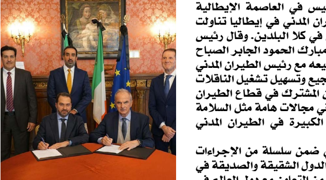
جانب من توقيع المحضر