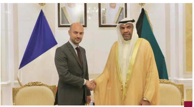
وزير الخارجية الكويتي يستقبل نظيره الفرنسي