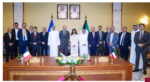
جانب من اجتماع وزراء الأشغال والبلدية والكهرباء مع وزير الخارجية الفرنسي

ترأست وزيرة المالية ووزيرة الدولة للشؤون الاقتصادية والاستثمار، نورة الصمام، اجتماعاً ثنائياً عقد في قصر بيان أمس، مع وزير أوروبا والشؤون الخارجية في الجمهورية الفرنسية، جان-نويل بارو، وذلك في إطار زيارته الرسمية للكويت. وشارك في هذا اللقاء العضو المنتدب لهيئة العامة للاستثمار الشيخ سعود سالم عبدالعزيز، حيث تم بحث سبل تعزيز الشراكات الاستراتيجية والتفاقيات المشابهة المشتركة بين الهيئة العامة للاستثمار والشركات الفرنسية، في ظل رغبة كلا الجانبين إلى تعميق التعاون الاقتصادي الثنائي. وسلط الاجتماع الضوء على نوج الكويت الاستراتيجي في توسيع حضورها الاستثماري على الصعيد العالمي، وجهود فرنسا لجذب الاستثمارات الأجنبية المباشرة. وأكد الجانبان دعم الاستثمارات طويلة الأمد في قطاعات مثل التكنولوجيا، والذكاء الاصطناعي، والطاقة، والتعليم. كما تم التطرق إلى إمكانية قيام الشركات الفرنسية بإنشاء مقرات إقليمية لها في الكويت، في إطار الجهود الرامية إلى تعزيز مكانة الدولة كمركز إقليمي للاستثمار والتبادل، إلى جانب دعم الشراكات المؤسسية. وتفاعلاً مع الزيارة، أعربت فرنسا عن دعمها للشركات الفرنسية العاملة في الكويت، ووافقت وزيرة الأشغال، د. نورة المشعان مع وزير الخارجية الفرنسي جان نويل بارو وقالت المشعان، العلاقات الكويتية - الفرنسية تقوم على أسس