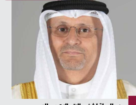
وزير الدولة لشؤون الاتصالات عمر

أعلن وزير الدولة لشؤون الاتصالات عمر العمر الثلاثاء، إطلاق أول رحلة رقمية متكاملة ضمن التطبيق الحكومي الموحد للخدمات الإلكترونية «سهل» تحت اسم «رحلة المولود» انطلاقاً من التوجيهات السامية بتسريع وتيرة رقمنة الخدمات وتبسيط الإجراءات الحكومية وتنفيذ استراتيجيتها الحكومية الرقمية الشاملة. وأكد الوزير العمر أن هذه المبادرة «تجسد الرؤية الحكومية لتسهيل حياة المواطنين عبر تقنيات ذكية وتقديم خدمات إلكترونية مترابطة لا تستدعي مراجعة الجهات الحكومية» مشيراً إلى أن ذلك «يعزز كفاءة الأداء الحكومي ويؤكد التزام الدولة بتقديم خدمات تواكب تطورات المواطن». وعلى صعيد المنظور الصحي لـ «رحلة المولود» أفاد وزير الصحة الدكتور أحمد العوضي بأن الناطق باسم «سهل» يوسف كاظم، إن «رحلة المولود» تتضمن سبع خدمات مترابطة ومبسطة تشمل تسمية المولود، ثم إصدار الرقم المدني، فإصدار شهادة الميلاد، ثم إضافة المولود الكويتي في ملف الجنسية، ثم تقديم طلب البطاقة المدنية، تلي ذلك خطوة إضافة المولود في الترمين وهذا بند اختياري وأخيراً طلب علوة المولود وهو بند اختياري أيضاً.