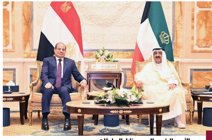
سمو الأمير والرئيس المصري خلال المباحثات

(كويتا) - صدر، الثلاثاء، بيان كويتي - مصري مشترك بمناسبة الزيارة التي قام بها الرئيس المصري عبدالفتاح السيسي إلى الكويت. وجاء في البيان المشترك، أنه «انطلاقاً من العلاقات الثنائية التاريخية والراسخة بين الكويت ومصر وشعبيهما الشقيقين وتعزيزاً للشراكة الاستراتيجية بينهما قام الرئيس المصري عبدالفتاح السيسي بزيارة إلى الكويت، تلبية لدعوة كريمة من سمو أمير الكويت الشيخ مشعل الأحمد». وأضاف البيان، «عقد سمو أمير الكويت الشيخ مشعل الأحمد جلسة مباحثات ثنائية مع الرئيس عبد الفتاح السيسي سبقتها جلسة موسعة ضمت أعضاء الوفدين شهدت تناولاً عميقاً للعلاقات الثنائية بين البلدين الشقيقين وإشادة متبادلة وتقديراً لمعمق وقوة تلك العلاقات الثنائية الوثيقة بينهما على مختلف المستويات الرسمية والشعبية وما شهدته من تضامن كامل عبر مختلف المحطات الحورية والظرفية على نحو برهن بوضوح على التزامهما المتبادل بضمان وحماية أمن ومصالح كلا البلدين الشقيقين وحرصهما الراسخ على حماية الأمن القومي العربي باعتباره كلاً لا يتجزأ». واستطرد «ويحث الجانبان كذلك مختلف أوجه التعاون المشترك في القطاعات الاقتصادية