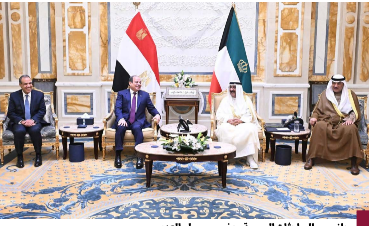
جانب من المباحثات الرسمية بحضور سمو ولي العهد