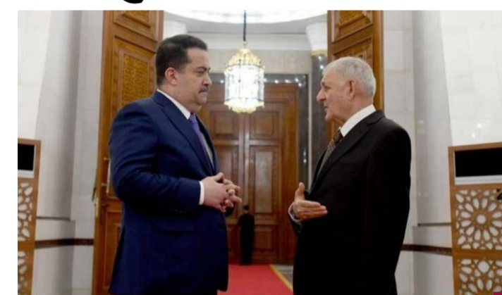
رئيس جمهورية العراق عبداللطيف رشيد ورئيس الوزراء العراقي محمد شياع السوداني

والتي تنص على أن العراق «يرعى مبدأ حسن الجوار ويلتزم عدم التدخل في الشؤون الداخلية للدول الأخرى، ويسعى لحل النزاعات بالوسائل السلمية، ويقفم علاقاته على أساس المصالح المشتركة والتعامل بالمثل ويحترم التزاماته الدولية». بدوره، دعا رئيس الوزراء العراقي، في الطعن الذي قدمه، إلى العدول عن قرار بطلان اتفاقية خور