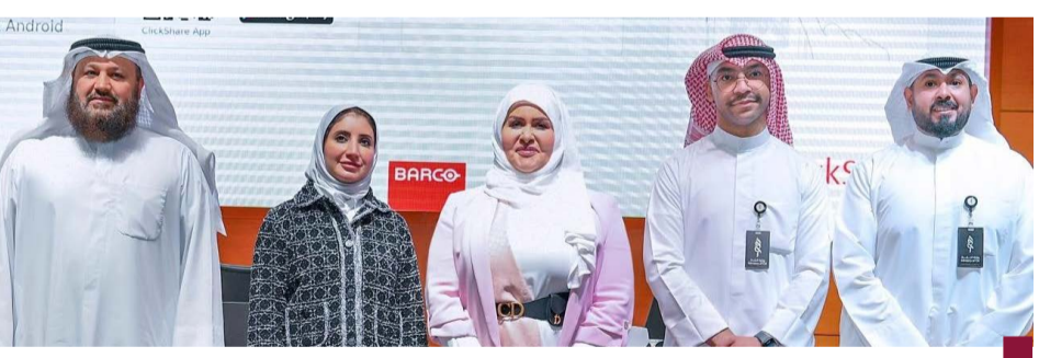
جانب من الحلقة النقاشية

أعلن وزير الدولة لشؤون الاتصالات عمر العمر الثلاثاء، إطلاق أول رحلة رقمية متكاملة ضمن التطبيق الحكومي الموحد للخدمات الإلكترونية «سهل» تحت اسم «رحلة المولود» انطلاقاً من التوجيهات السامية بتسريع وتيرة رقمنة الخدمات وتبسيط الإجراءات الحكومية وتنفيذ استراتيجيتها الحكومية الرقمية الشاملة. وأكد الوزير العمر أن هذه المبادرة «تجسد الرؤية الحكومية لتسهيل حياة المواطنين عبر تقنيات ذكية وتقديم خدمات إلكترونية مترابطة لا تستدعي مراجعة الجهات الحكومية» مشيراً إلى أن ذلك «يعزز كفاءة الأداء الحكومي ويؤكد التزام الدولة بتقديم خدمات تواكب تطورات المواطن». وعلى صعيد المنظور الصحي لـ «رحلة المولود» أفاد وزير الصحة الدكتور أحمد العوضي بأن الناطق باسم «سهل» يوسف كاظم، إن «رحلة المولود» تتضمن سبع خدمات مترابطة ومبسطة تشمل تسمية المولود، ثم إصدار الرقم المدني، فإصدار شهادة الميلاد، ثم إضافة المولود الكويتي في ملف الجنسية، ثم تقديم طلب البطاقة المدنية، تلي ذلك خطوة إضافة المولود في الترمين وهذا بند اختياري وأخيراً طلب علوة المولود وهو بند اختياري أيضاً.