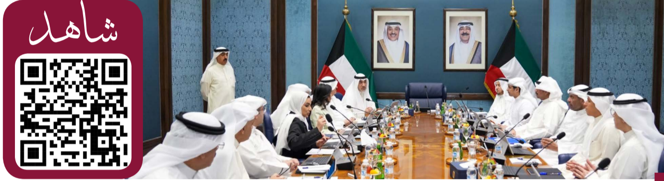
جانب من اجتماع مجلس الوزراء برئاسة الشيخ فهد اليوسف

عقد مجلس الوزراء اجتماعه الأسبوعي صباح يوم الثلاثاء ٨/٤/٢٠٢٥ في قصر بيان برئاسة معالي رئيس مجلس الوزراء بالإنابة ووزير الداخلية الشيخ فهد يوسف سعود الصباح وبعد الاجتماع صرح معالي نائب رئيس مجلس الوزراء ووزير الدولة لشؤون مجلس الوزراء شريده عبدالله المعرجي بأهم ما دار في الاجتماع.