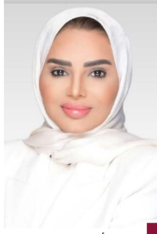
الدكتورة أمثال الحوييلة

الكويت كمرکز للعمل الإنساني وفق الضوابط والآليات المعمول بها في الوزارة. وأضافت أن الاجتماع التنسيقي الذي عقد مع ممثلي الجهات الحكومية يهدف إلى بحث آليات تطوير العمل الخيري في دولة الكويت بما يواكب التطورات العالمية والإقليمية بما فيها المعايير الدولية. وأوضحت الوزيرة الحوييلة أن الاجتماع مع ممثلي الجهات الحكومية المعنية يستهدف توطين العمل الخيري وتطويره من خلال إشراك جميع جهات العمل الخيري وعملية الربط الآلي مع الجهات الرقابية والمتابعة.