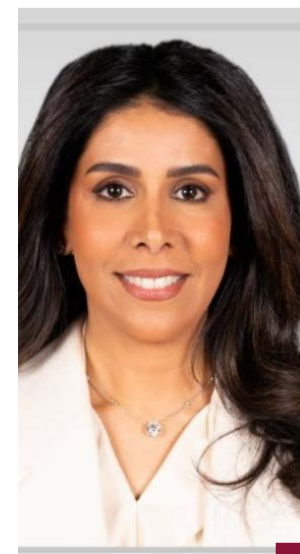
الدكتورة نورة المشعان

وأعلنت وزيرة الأشغال العامة الدكتورة نورة المشعان مواصلة أعمال الصيانة الجذرية لطريق الدائري الرابع، ضمن عقود الصيانة الجذرية الجديدة لأعمال الطرق السريعة والداخلية التي تشمل ١٨ ممارسة كبرى لصيانة الطرق في مختلف مناطق البلاد بالحافظات الست. وأكدت المشعان في تصريح صحفي الثلاثاء، استمرار تنفيذ مشاريع صيانة الطرق بكل المناطق مع الالتزام التام بضمان الجودة وتحقيق المواصفات العالمية، مبينة أهمية الاستثمار في البنى التحتية لردوره بتعزيز النمو الاقتصادي وتحسين جودة الحياة ودعم التنمية المستدامة.