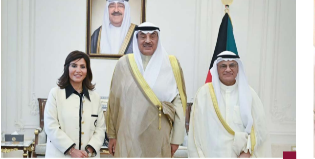
سمو ولي العهد مستقبلاً وزير التعليم العالي ومديرة جامعة الكويت الجديدة