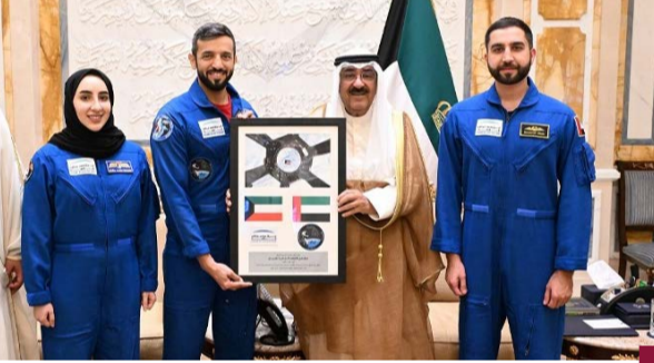
سمو الأمير مستقبلاً الوفد الإماراتي

استقبل صاحب السمو أمير البلاد مشعل الأحمد بقرص بيان وزير الدولة لشؤون الشباب بدولة الإمارات العربية المتحدة الشقيقة الدكتور سلطان بن سيف النيايدي، ورائدي الفضاء ثورة عيسى المطروشي ومحمد عبد الرحيم الملا، وذلك بمناسبة زيارتهم للبلاد. حضر المقابلة وزير الإعلام والثقافة ووزير الدولة لشؤون الشباب عبدالرحمن بداح الطييري، وكبار المسؤولين بالدولة.