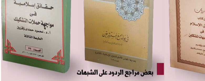
بعض مراجع الردود على الشبهات

شبهة من هذه الشبهات المثارة، والتي تتروى في عصرنا بشكل أو بآخر. من خلال عرض ما جاء في بعض المراجع منها كتاب « حقائق إسلامية في مواجهة حملات التشكيك » للدكتور محمود حمدي زقزوق. وهو من إصدار المجلس الأعلى للشؤون الإسلامية التابع لوزارة الأوقاف في مصر بتاريخ المحرم 1422هـ - أبريل 2001م . وكتاب « مختارات من كتاب حقائق الإسلام في مواجهة شبهات المشككين » - إشراف وتقديم د . محمود حمدي زقزوق - وزارة الأوقاف - القاهرة - بدون تاريخ. وكتاب « في جولة مع المستشرقين - للاستاذ عبد الخالق سيد أبو رابية - المجلس الأعلى للشؤون الإسلامية - القاهرة 1976. ونال أن يسهم نشرنا لهذه الردود في توضيح الصورة الحقيقية للإسلام وإزالة بعض ما علق بالأذهان من سوء فهم لتعاليمه وعقائده، والله من وراء القصد.