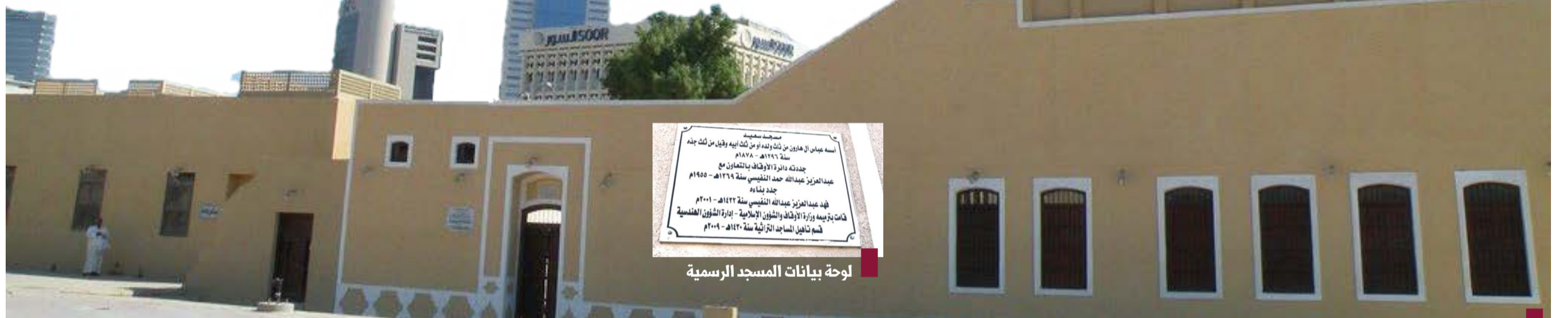
صورة حديثة لمسجد سعيد- مسجد عباس الهارون