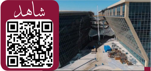
جانب من المشروع

تلقى حضرة سمو الأمير الشيخ مشعل الأحمد اتصالاً هاتفياً من أخيه صاحب السمو الشيخ محمد بن زايد آل نهيان رئيس دولة الإمارات العربية المتحدة الشقيقة جرى خلاله استعراض العلاقات الأخوية المتينة والراسخة بين البلدين والشعبين الشقيقين ويحث عدد من القضايا ذات الاهتمام المشترك والتطورات الإقليمية والدولية متمنيا لسموه رعد الله وافر الصحة وتتمام العافية ولدولة الكويت المزيد من النمو والرخاء في ظل القيادة الحكيمة لسموه. وشكر سمو الأمير أخاه الشيخ محمد بن زايد آل نهيان على هذا التواصل الأخوي المجسد لتعمق العلاقات الوطنية التي تربط الشعبين والشعبين الشقيقين متمنيا لسموه لدولة الإمارات العربية المتحدة المزيد من التقدم والازدهار تحت ظل القيادة الحكيمة لسموه.