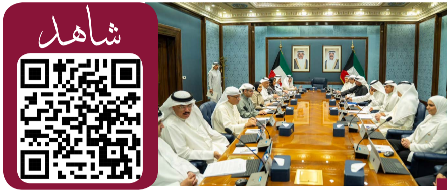
جانب من اجتماع مجلس الوزراء برئاسة اليوسف

(كويتا) - عقد مجلس الوزراء اجتماعه الأسبوعي صباح الخميس في قصر بيان برئاسة رئيس مجلس الوزراء بالإنابة ووزير الداخلية الشيخ فهد اليوسف وأشد المجلس بالكلمة التي ألقاها حضرة صاحب السمو أمير البلاد الشيخ مشعل الأحمد الجابر الصباح حفظه الله ورعاه خلال زيارته إلى المجلس الأعلى للقضاء والتي أعرب فيها سموه حفظه الله ورعاه عن فخره بالقضاء الكويتي النزيه وما يتميز به من مهنية وكفاءة في حفظ الحقوق وإعلاء العدل. من جانب آخر أحيط مجلس الوزراء علما بالزيارات التي قام بها حضرة صاحب السمو أمير البلاد الشيخ مشعل الأحمد الجابر الصباح حفظه الله ورعاه يومي الاثنين والثلاثاء الماضيين إلى النادي الكويتي الرياضي للصحف وديوانية شعراء النبط والنادي الكويتي الرياضي للمعاقين وجمعية المكفوفين الكويتية. من جهة أخرى استعرض مجلس الوزراء التوصية الواردة ضمن محضر اجتماع اللجنة الوزارية للشؤون القانونية بشأن مشروع المرسوم بالقانون بتعديل بعض أحكام قانون الإجراءات والمحاكمات الجزائية الصادر بالقانون رقم (١٧) لسنة ١٩٦٠ وقرر الموافقة عليه ورفعها إلى حضرة صاحب السمو أمير البلاد الشيخ مشعل الأحمد الجابر الصباح حفظه الله ورعاه. من جانب آخر استعرض مجلس الوزراء تقرير جهاز متابعة الأداء الحكومي بشأن الهيئة