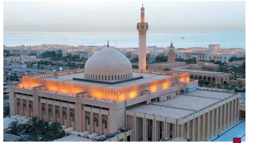
صورة مسجد الدولة الكبير تحفة معمارية

ترميم المسجد الكبير في عام ٢٠١٣ جرى ترميم المسجد الكبير وقبته ومبانيه وإدخال تعديلات على ديكورات المصلى من الداخل، واستخدام الإضاءة الحديثة.