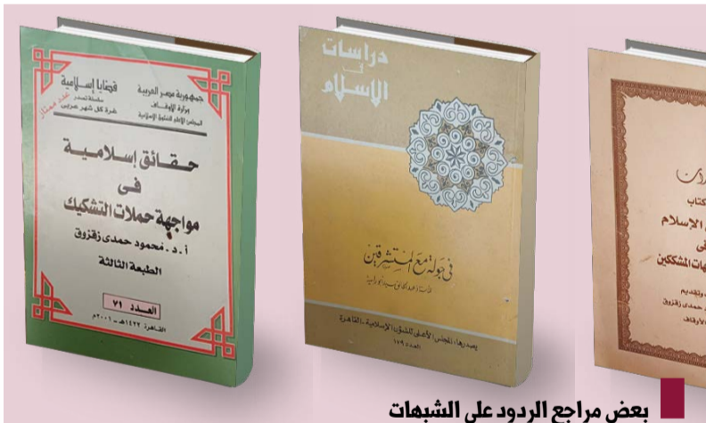
بعض مراجع الردود على الشبهات

على كل شبهة من هذه الشبهات المثارة، والتي تتروى في عصرنا بشكل أو بآخر، من كل عرض ما جاء في بعض المراجع منها كتاب « حقائق إسلامية في مواجهة حملات التشكيك للإسلام منذ ظهر وحتى اليوم هي شهادات مكررة ولا تختلف مع بعضها إلا في الصياغة أو محاولة إعطائها صبغة علمية، ومواجهة تلك الشبهات تكون ببذل جهود علمية مضاعفة من أجل توضيح الصورة الحقيقية للإسلام، ونشر ذلك على أوسع نطاق خاصة في عصر ثورة المعلومات والاتصالات واستخدام المتزايد لشبكة الاتصالات الدولية «الإنترنت»، وقد نشط مفكرو الإسلام - في فترات مختلفة - بإقحام بواجههم في الرد على هذه الشبهات كل بطريقة الخاصة بأسلوبه الذي يعتقد أنه السبيل الأقوم للرد. وتعميماً للفائدة، ستواصل صحيفة « الوفاق » خلال شهر رمضان المبارك، نشر الردود