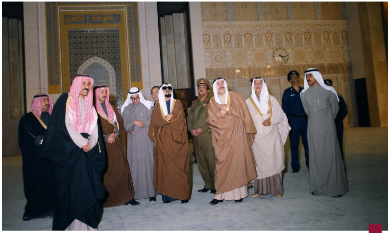
الراحل الشيخ جابر الأحمد يتفقد أعمال إنشاء المسجد قبيل افتتاحه عام ١٩٨٦