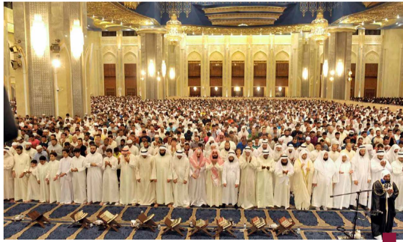
المسجد الكبير من الداخل أثناء صلاة القيام