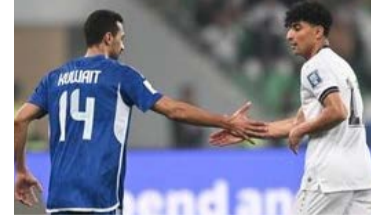
المؤهلة لكأس العالم ٢٠٢٦ ويتصدر المجموعة كوريا الجنوبية بـ١٥ نقطة والأردن والعراق ١٢ نقطة وعمان ٧ نقاط والكويت ٥ نقاط وفلسطين ٣.

تعدال أمس الخميس منتخبنا الوطني أمام العراق ٢-٢ بعدما كان متقدماً بهدفين نظيفين إلا أن الحكم الصيني أضاف عدة دقائق على الوقت الإضافي ٩٠ دقائق تمكن بها المنتخب الخفيف من إدراك الهدف الثاني لتنتهي المواجهة المثيرة بالتعادل ٢-٢ والتي احتضنها ملعب مدينة البصرة في مباراة كان «الأزرق» احق بها بالفوز غير أن الحكم الصيني كان له رأي آخر. وبتلك النتيجة أصبح لمنتخبنا ه نقاط في مجموعته الثانية من تصفيات آسيا