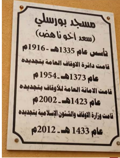
صورة لوحة بيانات المسجد الرسمية