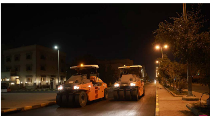
جانب من أعمال الصيانة

نشرت «الكويت اليوم»، في عددها الصادر الأحد، قرار مجلس الوزراء رقم ١٩٥ لسنة ٢٠٢٥ بسحب شهادة الجنسية الكويتية من ١٢ شخصاً، ومن يكون اكتسبها معهم بطريق التبعية، بناء على المادة ٢١ مكرراً «من المرسوم الأميري رقم ١٥ لسنة ١٩٥٩ بقانون الجنسية الكويتية والقوانين المعدلة له. والمادة ٢١ مكرراً»، تنص على ما يلي: «تسحب شهادة الجنسية الكويتية إذا تبين أنها أعطيت بغير حق بناء على عش أو أقوال كاذبة أو شهادات غير صحيحة، ويكون السحب بقرار من مجلس الوزراء بناء على عرض