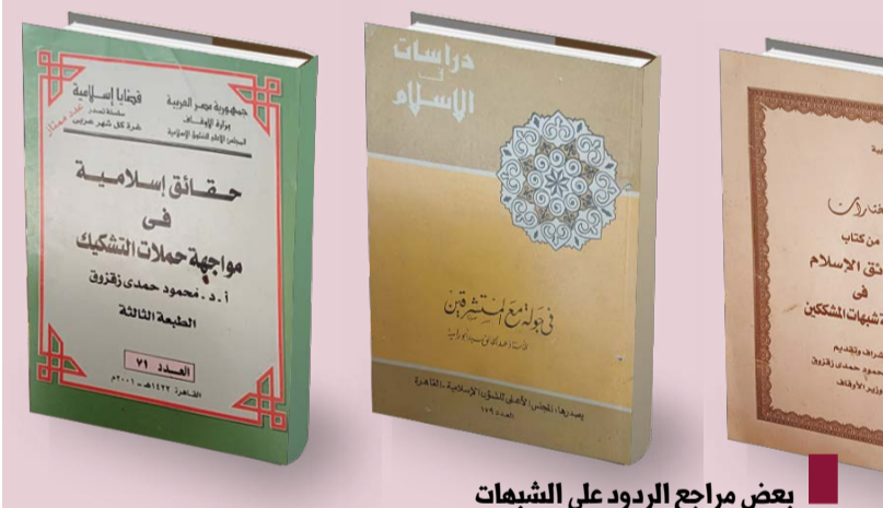
بعض مراجع الردود على الشبهات