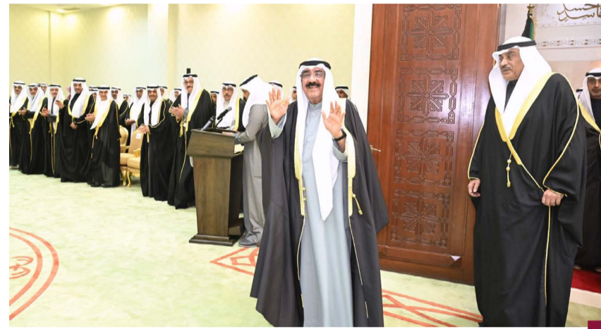
سمو الأمير وسمو ولي العهد خلال زيارة المجلس الأعلى للقضاء

وطنها في هذا المجال الحيوي؛ مما يعكس التزام دولة الكويت بتعزيز المساواة بين الكويتيين رجالاً ونساءً، والمساواة قريبة العدل، والعدل أساس الملك والحكم. وفي هذا الصدد، تشدد على عدم تأييد المناصب في القضاء وفي النيابة العامة، وتؤكد كذلك على أهمية إعداد وتأهيل وتدريب المزيد من الكوادر الوطنية المتميزة للانضمام إلى السلك القضائي، وصقل خبرات القضاة وأعضاء النيابة، وتفعيلهم ومتابعة أعمالهم، وتشجيع البحوث والدراسات القانونية؛ لتعزيز الأداء القضائي، وترسيخ التعاون الثنائي مع الجهات المناظرة في دول مجلس التعاون والدول الشقيقة والصديقة،