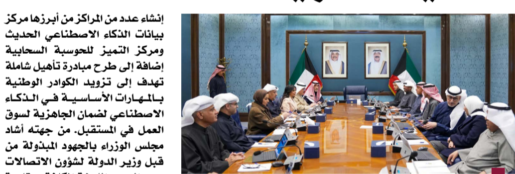
جانب من اجتماع مجلس الوزراء برئاسة اليوسف

«إنشاء مركزين لبيانات الذكاء الاصطناعي والحوسبة السحابية بالشراكة مع «مايكروسوفت»» عربي موحد باتجاه دعم حقوق الشعب الفلسطيني وتمسكه بالبقاء على أرضه. من جانب آخر أطلع مجلس الوزراء على العرض المرئي المقدم من وزير الدولة لشؤون الاتصالات عمر العمر بشأن اتفاقية الشراكة الاستراتيجية بين حكومة دولة الكويت ومايكروسوفت التي تتضمن شاهد عربي موحد باتجاه دعم حقوق الشعب الفلسطيني وتمسكه بالبقاء على أرضه. من جانب آخر أطلع مجلس الوزراء على العرض المرئي المقدم من وزير الدولة لشؤون الاتصالات عمر العمر بشأن اتفاقية الشراكة الاستراتيجية بين حكومة دولة الكويت ومايكروسوفت التي تتضمن