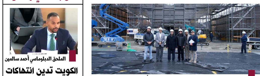
وزير الإعلام يتفقد جاهزية جناح الكويت في «إكسبو أوساكا - كانساي 2025»

الموظفين المشاركين في الجناح حيث أطلع على مستوى التجهيزات والمستلزمات الضرورية للسكن وفق المعايير المطلوبة بالإضافة إلى التأكد وزير الإعلام يتفقد جاهزية جناح الكويت في «إكسبو أوساكا - كانساي 2025» الموظفين المشاركين في الجناح حيث أطلع على مستوى التجهيزات والمستلزمات الضرورية للسكن وفق المعايير المطلوبة بالإضافة إلى التأكد