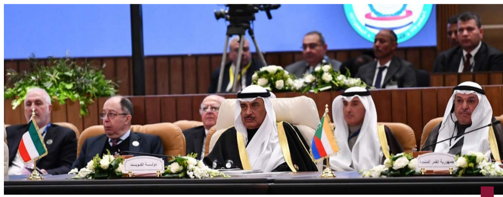
ممثل سمو الأمير سمو ولي العهد الشيخ صباح خالد خلال القمة العربية

مهمته الرئيسية بالحفاظ على الأمن والسلام الدوليين، ووقف التهجير العدواني الإسرائيلي المستمرة على قطاع غزة والضفة الغربية، ومنع أي محاولات لفرض واقع جديد عبر التهجير القسري والتوسع الاستيطاني. لنتفق على أمرين رئيسيين لكي نمضي قدماً بشكل منهجي وموضوعي واستراتيجي.. فالأمر الأول هو أن دعمنا لهذه القضية المركزية واجب ديني وعربي وأخلاقي وإنساني، والأمر الثاني هو أنه لا مجال للعودة لما كان عليه الحال في السابق، حيث إن الكلمات والبيانات والمؤتمرات والقمم لن تجدي نفعاً إذ لم تنتج عن خارطة طريق ملموسة قابلة للتنفيذ والتطبيق على أرض الواقع، بل كجارية عربية في المقام الأول، فوجدتنا هي منارتنا التي نستهدى بها، وتعاضداً يلهمنا القوة والرشاد. وبناء على ذلك، فإن قمتنا اليوم، وفي هذه اللحظة التاريخية الفارقة تقع على عاتقنا مسؤولية صياغة موقف عربي موحد لمواجهة أي محاولات أو مخططات أو دعوات لتهجير الفلسطينيين وتصفيته القضية الفلسطينية على حساب الدول العربية.. ولذلك، نود تسليط الضوء على عدد من المحادثات والخطوات المموسة، نرى أهمية ترجمتها على أرض الواقع، وهي: ١- إعلاء الصوت العربي الراض لأى محاولة لتهجير الشعب الفلسطيني، بالإضافة إلى رفض تحميل دول المنطقة - لا سيما جمهورية مصر العربية، والمملكة