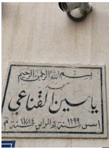
صورة لوحة بيانات المسجد

مسجد ياسين القناعي، أسس المسجد في عام ١١٩٩ هجرية، الموافق عام ١٧٨٤م على يد المحسن ياسين القناعي الذي كانت له أبار مياه في منطقة بير كاظمة، كما كان ينصب «حظور» صيد الأسماك في مياه البحر المقابلة لأباره. واسم الشهرة له هو مسجد سرحان نسبة إلى امام المسجد « سرحان» حسب كتاب معالم الكويت القديمة . وقد تم تجديد بناء المسجد على يد المحسن إبراهيم بن أحمد العبدالجليل في عام ١٨١٣ ثم جددته مرة أخرى في عام ١٨٣٤ للمحسن عيسى بن إبراهيم. وهذا المسجد قائم إلى اليوم. وموقعه وسط مدينة الكويت جنوب البنك المركزي القديم ومقابل سوق الذهب في المباركية. يقول المؤرخ صالح خالد المسباح المريخي : مسجد ياسين القناعي يعتبر من ضمن أقدم المساجد في الكويت تأسس ١٧٨٤م وتم تجديده عدة مرات ، وآخر تجديده له ١٩٩٤ م ، ويقع بجانب البنك المركزي ، وسوق التجار ، ومضى عليه ما يقارب ٢٣٣ عاما ، ومازال إلى يومنا هذا قائم والحمد لله.