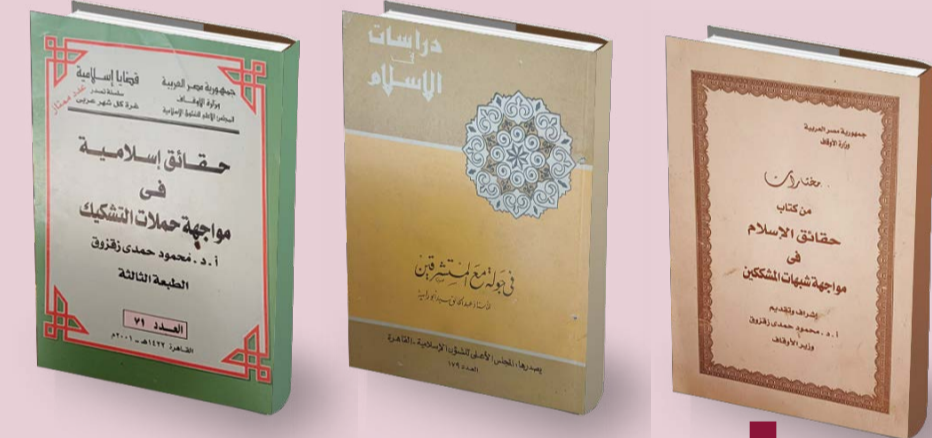
بعض مراجع الردود على الشبهات

« الإنترنت » ، وقد نهض مفكرو الإسلام - في فترات مختلفة - بالقيام بواجبهم في الرد على هذه الشبهات كل بطريقته الخاصة وبأسلوبه الذي يعتقد أنه السبيل الأقوم للرد. وتعميماً للفائدة، ستواصل صحيفة « الوقاف » خلال شهر رمضان المبارك، نشر الردود على كل شبهة من هذه الشبهات المثارة، والتي تتردد في عصرنا بشكل أو بآخر، من خلال عرض ما جاء في بعض المراجع منها كتاب « للداكتور محمود حمدي زقزوق، وهو من إصدار المجلس الأعلى للشئون الإسلامية