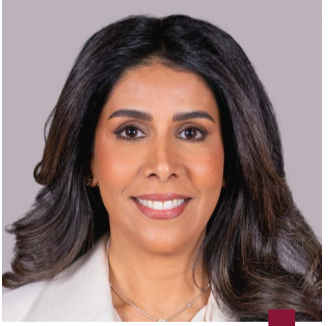
وزيرة الأشغال، نورة المشعان

أعلنت وزيرة الأشغال العامة الدكتورة نورة المشعان مواصلة أعمال الصيانة الجذرية للطرق في منطقة «عبدالله المبارك» ضمن عقود الصيانة الجديدة لأعمال الطرق السريعة والداخلية التي تشمل ١٨ ممارسة كبرى لصيانة الطرق في مختلف مناطق البلاد بالمحافظات الست، وقالت المشعان في تصريح صحفي إن أعمال صيانة الطرق ستبدأ بالمناطق الأكثر تضرراً ثم الأقل مع وجود رقابة وإشراف ومتابعة على أعمال الصيانة، لافتة إلى أن فرق عمل من الوزارة ستراقب تنفيذ أعمال الصيانة إذ تم تشكيل لجنة لاختيار المهندسين المشرفين وعمل اختبارات لهم للتأكد من إدارتهم. وأكدت استمرار تنفيذ مشاريع صيانة الطرق بكل المناطق مع الالتزام بضمان الجودة وتحقيق المواصفات العالمية، موضحة أن الاستثمار في البنية التحتية يعزز النمو الاقتصادي ويحسن جودة الحياة ويدعم التنمية المستدامة.