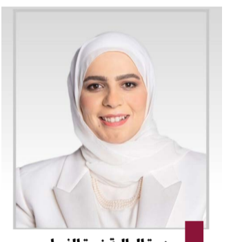
وزيرة المالية نورة الفصام

قالت وزارة المالية إنها بدأت في إرسال إشعارات عبر تطبيق سهل لمستغلي شاليهات الدوحة الغربية لإخلائها وتسليمها للوزارة في موعد أقصاه ٣١ مارس الجاري. وأوضحت الوزارة عبر حسابها الرسمي في منصة «إكس» أن ذلك جاء بناء على كتاب بلدية الكويت الذي وصل إلى وزارة المالية في يناير الماضي، والمرفق به قرار المجلس البلدي رقم (م) ب / ٦ / ١٦٤ / ٢٠٢٤ د بشأن موافقة المجلس على تخصيص الموقع الممتد من حدود محطة الدوحة الغربية حتى حدود محمية الجهراء الطبيعية، لتنفيذ مشروع الواجهة البحرية في الجهراء (الكورنيش). وقالت «المالية»، إنها ستعمل على إخلاء ١١٦ شاليهاً، وتسليمها إلى بلدية الكويت فور الانتهاء من إجراءات إنهاء جميع عقود مستغلي الشاليهات.