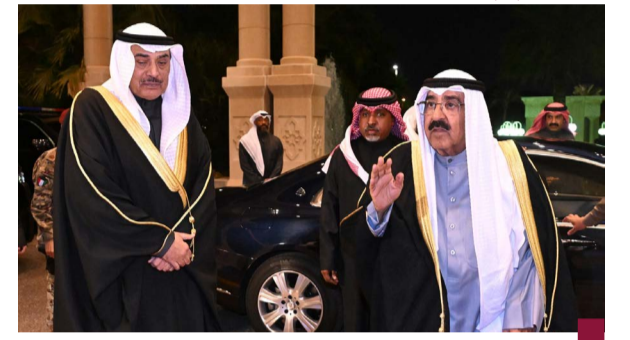
سمو الأمير وسمو ولي العهد يستعدان لاستقبال الممنين بشهر رمضان

في أجواء من المودة والمحبة استمر توافد اليوم الثاني على التوالي جموع الممنين وذلك تهنئة سمو أمير البلاد الشيخ مشعل الأحمد، وسمو ولي العهد الشيخ صباح الخالد، وأسرة آل الصباح الكرام، بحلول شهر رمضان المبارك. حيث استقبل سموهما رؤساء البعثات الدبلوماسية المعتمدين لدى دولة الكويت وكبار القادة في الجيش والشرطة والحرس الوطني وقوة الإطفاء العام وجموعاً من المواطنين والمقيمين. الأخوة التي جبل عليها في مثل هذه المناسبات أعادها الله علينا بالخير واليمن والبركات.