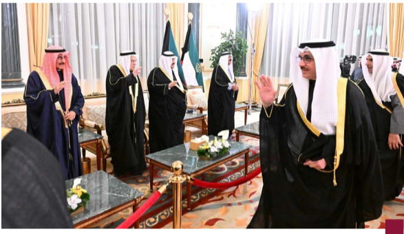
بعض المسؤولين خلال التهنئة