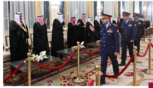
بعض قادة الجتمات العسكرية