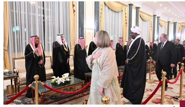
أعضاء من السلك الدبلوماسي