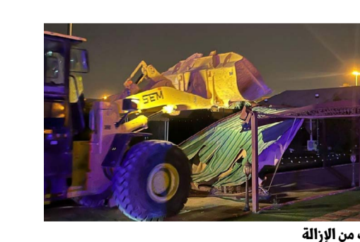
جانب من الإزالة

بدأت فرق بلدية الكويت، ممثلة في أقسام إزالة المخلفات بمحافظات الأحمدية والثروانية والجھراء، بإزالة قاعات المناسبات المؤقتة بعد انقضاء مهلة الإنذارات. ونضمت فرق الإزالة، بمشاركة أعمال رقع ومعدات النظافة المساندة، أعمال رفع مولدات الكهرباء وملحقات القاعات، تنفيذاً لقرار الوزاري القاضي بإزالتها تمهيداً لتطبيق لائحة خيم المناسبات المؤقتة.