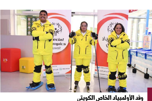
وفد الأولمبياد الخاص الكويتي

يشارك وفد الكويت لرياضة الإعاقات الذهنية من الأولمبياد الخاص الكويتي بدورة الألعاب العالمية الشتوية ال12 للأولمبياد الخاص ٢٠٢٥ التي تستضيفها مدينة تورينو الإيطالية من ٨ إلى ١٥ مارس الجاري، وذلك بعد إقامة عدة مسكرات تهيئة الوفد بهدف تحقيق إنجاز رياضي وطني. وأكدت رئيس مجلس إدارة الأولمبياد الخاص الكويتي هناء الزاوي، أن همة الرياضيين المشاركين بالدورة العالمية عالية جدا والتي تعد دافعا أساسيا لتحقيق مراكز متقدمة تضاف إلى رصيد إنجازات البلاد الرياضية.