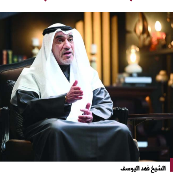
الشيخ فهد اليوسف

وقال اليوسف: لجنة البحث عن مزوري الجنسية والمزدوجين ستستمر ١٠ سنوات أو أكثر وتابع: ستكون هناك هيئة مستقلة للجنسية. وعن ملاحقة الفاسدين قال اليوسف: تم استدعاء مشاهير السوشيال ميديا للتحقيق في مصدر ثروتهم وأي شخص من المشاهير معرض للمساءلة لمعرفة كيف تضخمت ثروتهم بهذه السرعة وأضاف اليوسف: ملفات الفساد التي تم فتحها تشمل شخصيات كبيرة من وزراء ونواب سابقين والمساءلة لن تستثنى أحداً ممن تلوثت يدها بالفساد مهما كان منصبه أو مكانته الاجتماعية وكل يوم عندي قضية فساد غسل الأموال ولا أحد معفي من دخول «الريزرت الكويتي»