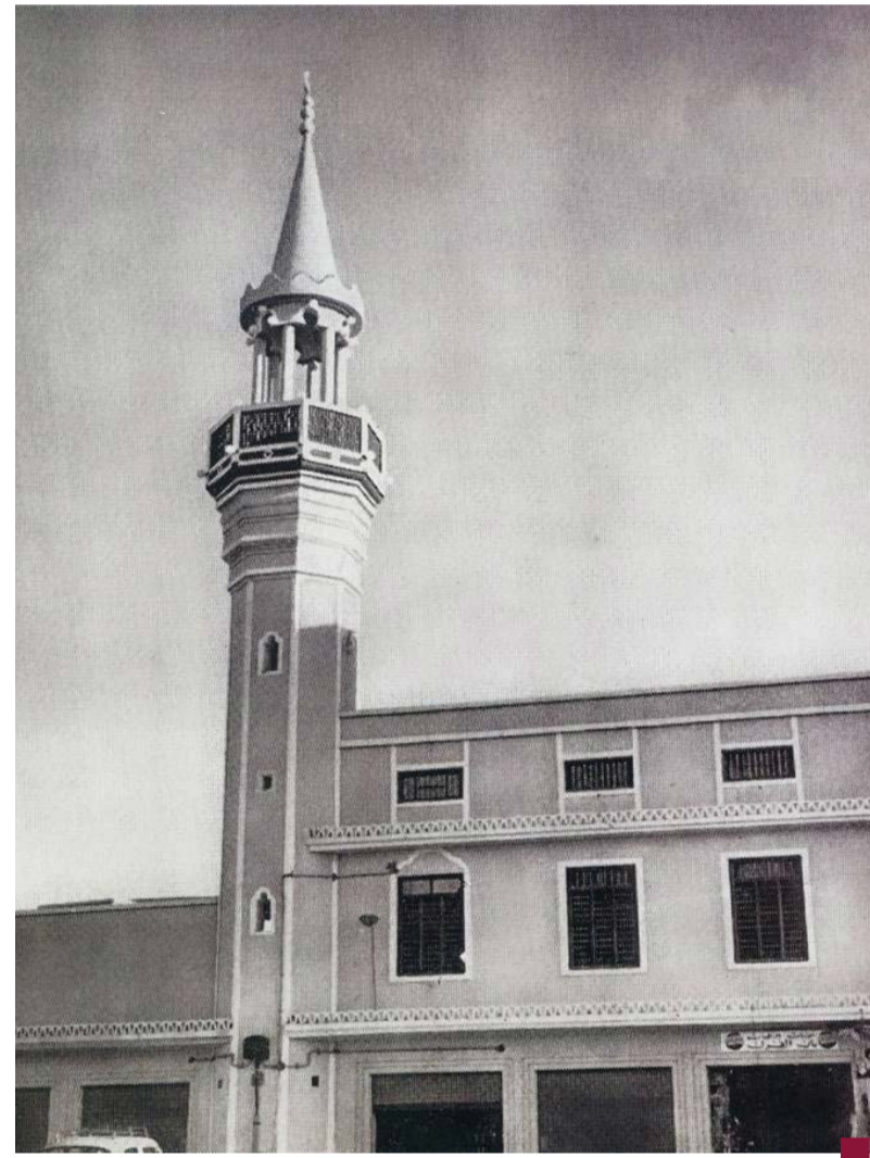
مسجد ابن بحر «مسجد الإبراهيم» أقدم مساجد الكويت

الإبراهيم الذي قام بتجديد المسجد في عام ١٨٥٨ م بعد مضي حوالي (١١٧) عاماً على التجديد الأول. وقد اشتهر بتسميته في بعض الوثائق بمسجد ابن بحر الضرة، كونه يقع مقابل الضرة القديمة، ولتمييزه عن مسجد ابن بحر الواقع في براحة ابن بحر (براحة السبعان).