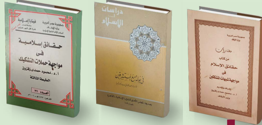
بعض مراجع الردود على الشبهات

في مواجهة حملات التشكيك «للكاتب محمود حدي زرقوق، وهو من إصدار المجلس الأعلى للشؤون الإسلامية التابع لوزارة الأوقاف في مصر بتاريخ المحرم 1422هـ - أبريل 2001م. وكتاب «مختارات من كتاب حقائق الإسلام في مواجهة شبهات المشككين» - إشراف وتقديم د. محمود حدي زرقوق - وزارة الأوقاف - القاهرة - بدون تاريخ. وكتاب «في جولة مع المستشرقين» - الأستاذ عبد الخالق سيد أبو رابية - المجلس الأعلى للشؤون الإسلامية - القاهرة 1976. ونأمل أن يسهم نشرنا لهذه الردود في توضيح الصورة الحقيقية للإسلام وإزالة بعض ما علق بالإنهان من سوء فهم لتعاليمه وعقائده، والله من وراء القصد.