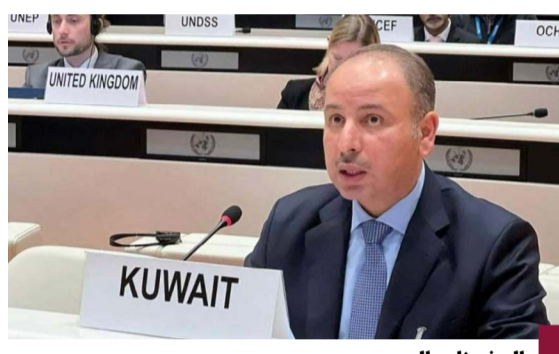
السفير ناصر المين

أمين عام مجلس التعاون المستمرة تهدد أمن واستقرار المنطقة