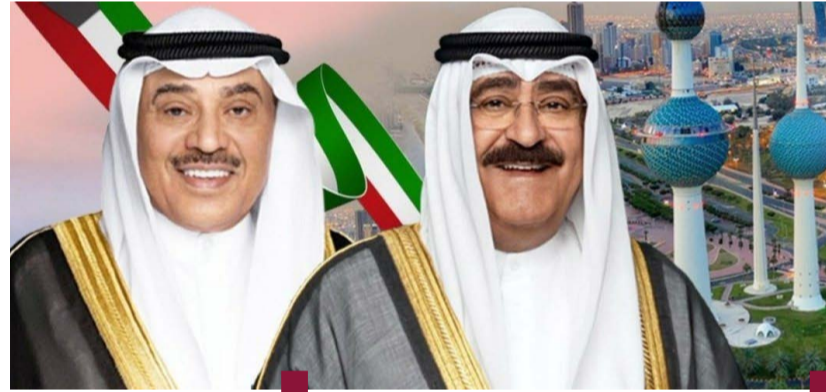
سمو ولي العهد الشيخ صباح الخالد