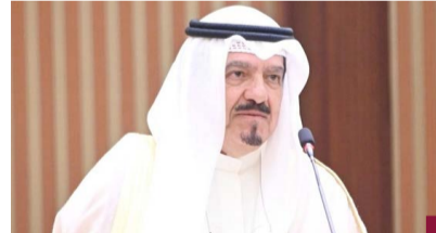
سمو الشيخ أحمد عبدالله

رئيس مجلس الوزراء، وأن يديم عليهم نعمة الصحة والعافية وأن يعيد هذا الشهر الكريم على الوطن العزيز وعلى الأمنين العربية والإسلامية بواقر الخير واليمن والبركات، والشعبين الشقيقين.