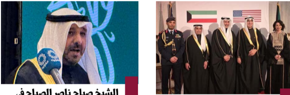
الشيخ صباح ناصر الصباح في احتفال سفارتنا في السعودية