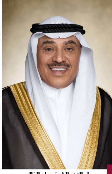
سمو ولي العهد الشيخ صباح الخالد

الوطن الأبرار الذين ضحوا بأنفسهم الابنية ودمائهم الزكية دفاعا عن تراب الوطن الغالي والذود عنه، ميتلا سموه إلى الباري عز وجل أن يتقدمهم بواسع رحمته ومقرته وأن يسكنهم فسيح جناته ويتزلفهم منازل الشهداء. كما وجه سموه رعااه الله تحية تقدير وإجلال لإخوانه أصحاب الجلالة والسمو قادة دول مجلس التعاون لدول الخليج العربية وإلى إخوانه أصحاب الجلالة والفتخامة والسمو قادة الدول العربية الشقيقة والدول الصديقة على مشاركتهم دولة الكويت أفرحها بأعيادها الوطنية سواء على المستوى الرسمي أو الشعبي من خلال مظاهر الاحتفالات والتي جسدت بجلالة عمق وأصغر العلاقات الحميمية التي تربط دولة الكويت ودول مجلس التعاون والدول الشقيقة والصديقة، مثمنا سموه رعااه