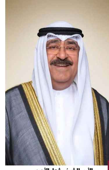
سمو الأمير الشيخ مشعل الأحمد

الوطن الأبرار الذين ضحوا بأنفسهم الابنية ودمائهم الزكية دفاعا عن تراب الوطن الغالي والذود عنه، ميتلا سموه إلى الباري عز وجل أن يتقدمهم بواسع رحمته ومقرته وأن يسكنهم فسيح جناته ويتزلفهم منازل الشهداء. كما وجه سموه رعااه الله تحية تقدير وإجلال لإخوانه أصحاب الجلالة والسمو قادة دول مجلس التعاون لدول الخليج العربية وإلى إخوانه أصحاب الجلالة والفتخامة والسمو قادة الدول العربية الشقيقة والدول الصديقة على مشاركتهم دولة الكويت أفرحها بأعيادها الوطنية سواء على المستوى الرسمي أو الشعبي من خلال مظاهر الاحتفالات والتي جسدت بجلالة عمق وأصغر العلاقات الحميمية التي تربط دولة الكويت ودول مجلس التعاون والدول الشقيقة والصديقة، مثمنا سموه رعااه