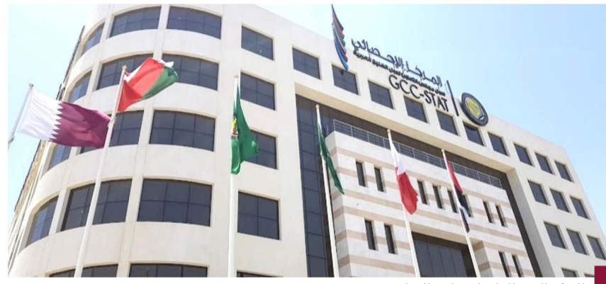
المركز الإحصائي لدول مجلس التعاون