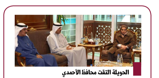
الحويلة التفت محافظة الاحمدي

وأشار إلى أن الاحتفال بهذه المناسبات الوطنية يعكس مشاعر الولاء للوطن والقيادة الحكيمة، مؤكدا أهمية مشاركة جميع فئات المجتمع في هذه الضعاليات تقديرا لتاريخ الكويت العريق واستذكارا لتضحيات شهدائها الأبرار.