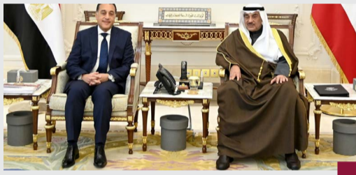
وسمو ولي العهد مستقبلا د. مصطفى مدبولي