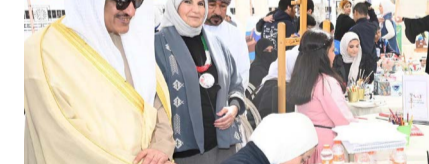
محافظ الجبراء خلال مهرجان السلام الثامن

برعاية وحضور محافظ الجبراء السيد حمد جاسم الحبشي، انطلقت فعاليات مهرجان السلام الثامن في محافظة الجبراء، وذلك ضمن الاحتفالات الوطنية بالعيد الوطني وعيد التحرير. وبهذه المناسبة، أكد المحافظ الحبشي أن مهرجان السلام الثامن يعد نقلة نوعية في الاحتفالات الوطنية، حيث يسهم في ترسيخ مبادئ الوحدة الوطنية والانتماء، وتعزيز الوعي بتاريخ الكويت المشرف، وأضاف أن الضعاليات الوطنية تمثل فرصة مهمة لتعزيز الروح الوطنية بين مختلف فئات المجتمع، صفارا وكبارا، والتعبير عن الفخر والاعتزاز بمسيرة الكويت ونهضتها.