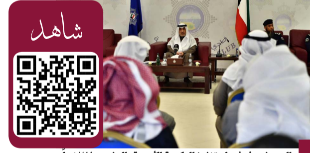
اليوسف يشرف على تنفيذ المكرمة الأميرية بالعفو عن 781 نزيلًا

أعلنت وزارة الداخلية الكويتية العفو عن 781 نزيلًا من سجنهم المكرمة الأميرية بالمرسوم الأميري رقم (٣٣) لسنة ٢٠٢٥ بالإعفاء عن تنفيذ باقي مدة العقوبة أو الغرامة المفيدة للحرية أو الإبعاد القضائي أو تخفيض مدة العقوبة المحكوم بها على بعض الأشخاص بمناسبة العيد الوطني الـ٤٤. وقال النائب الأول لرئيس مجلس الوزراء