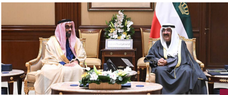
سمو الأمير مستقبلا الشيخ طحنون بن زايد

استقبل سمو أمير البلاد الشيخ مشعل الأحمد بقصر بيان صباح اليوم، سمو الشيخ طحنون بن زايد آل نهيان نائب حاكم إمارة أبوظبي مستشار الأمن الوطني بدولة الإمارات العربية المتحدة، والوفد المرافق وذلك بمناسبة زيارته الرسمية للبلاد. حيث نقل لسموه تحيات وتقدير صاحب السمو الشيخ محمد بن زايد آل نهيان رئيس دولة الإمارات العربية المتحدة، وتمنياته لسموه بموفور الصحة وتتمام العافية ونشعب دولة الكويت المزيد من الرقي والنماء.