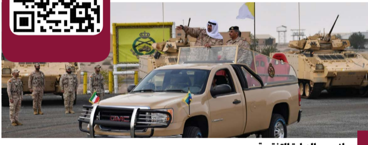
جانب من الزيارة التفقدية

حفظ أمن البلاد. وأكد على منتهى القوة البرية مواصلة البذل والعطاء لخدمة هذا البلد العطاء، داعياً المولى عز وجل أن يديم على كويتنا الغالية وعلى قيادتها الحكيمة وشعبها الوفي نعمة الأمن والأمان والعزة والرفعة.