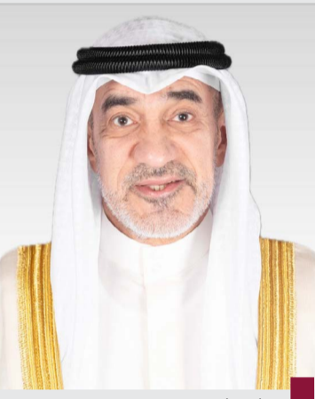
الشيخ فهد اليوسف

عقدت اللجنة العليا لتحقيق الجنسية الكويتية اجتماعاً الخميس، برئاسة رئيس مجلس الوزراء بالإتابة وزير الداخلية الشيخ فهد اليوسف، وقررت سحب وفقد وإسقاط الجنسية الكويتية من 476 حالة تهديداً تعرضها على مجلس الوزراء. وقالت وزارة الداخلية في بيان صحفي إن اللجنة قررت فقد الجنسية الكويتية وفقاً للمادة (١١) من قانون الجنسية الكويتية رقم (١٥) لسنة ١٩٥٩م وتعديلاته من ١٣ حالة للازدواجية. وأضاف البيان أن اللجنة قررت سحب شهادة الجنسية الكويتية وفقاً للمادة (٢١) من قانون الجنسية الكويتية رقم (١٥) لسنة ١٩٥٩م وتعديلاته من ٤٤٣ حالة (غش وأقوال كاذبة «تزيير» ومن يكون قد اكتسبها معهم بطريق التبعية). وأشار إلى أن اللجنة قررت