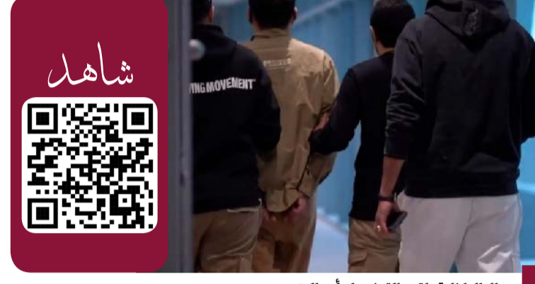
رجال الداخلية يلقون القبض على أحد المتهمين

سحب الجنسية الكويتية وفقاً للمادة (١٣) فقرة (٤) من قانون الجنسية الكويتية رقم (١٥) لسنة ١٩٥٩م وتعديلاته من ٣ حالات (مصلحة عليا للبلاد). كما قررت اللجنة سحب الجنسية الكويتية وفقاً للمادة (١٣) فقرة (٢) من قانون الجنسية الكويتية رقم (١٥) لسنة ١٩٥٩م وتعديلاته من ١٦ حالة (جرائم مخلة بالشرف والأمانة) وهي بالتفصيل (حالتين من حملة إحصاء ١٩٦٥ و٤ حالات «إنشاء كويتيات» وحالتين «أعمال جلية» و٨ حالات «إنشاء التجنسين»). وأضاف أن اللجنة قررت إسقاط الجنسية الكويتية وفقاً للمادة (١٤) فقرة (٣) من قانون الجنسية الكويتية رقم (١٥) لسنة ١٩٥٩م وتعديلاته من حالة واحدة (للمساس بولائه للبلاد).