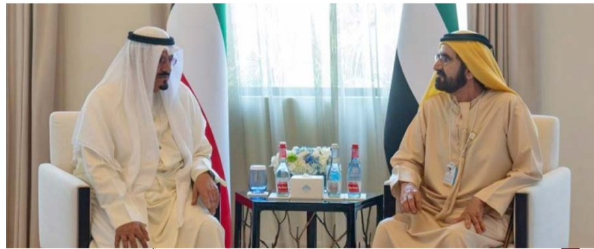
الشيخ محمد بن راشد آل مكتوم مستقبلاً سمو الشيخ أحمد العبدالله

محمد الخالد الصباح، وسفير دولة الكويت لدى دولة الإمارات العربية المتحدة جمال الغنيم، ومساعد وزير الخارجية لشؤون مكتب الوزير السفير بدر التنيب، والقضات العام لدولة الكويت في دبي والإمارات الشمالية خالد عبد الرحيم الزعابي.