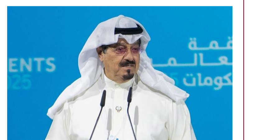
سمو رئيس الوزراء الشيخ أحمد العبدالله