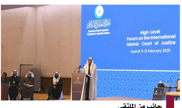
جانب من المنتدى

أكدت الهيئة العامة للغذاء والتغذية عدم السماح بدخول المنتجات الغذائية التي تحتوي على الحشرات إلى دولة الكويت. وأشارت في هذا الصدد إلى رأي اللجنة الفنية الصادر في عام ٢٠٢٣ بشأن ما تم تداوله حول استخدام الحشرات في المنتجات الغذائية؛ حيث بيّنت اللجنة أنه طبقا للائحة الخليجية المعتمدة «الاشتراطات العامة للأغذية الحلال»، والتي تحظر استخدام جميع أنواع الحشرات والديدان في الأغذية، فإنه لا يسمح بدخول المنتجات الغذائية التي تحتوي على الحشرات إلى دولة الكويت. وأكدت أنها ومن خلال إدارتها الفنية المختصة وإبلاغها الوطنية تتابع كل ما يستجد في هذا الشأن.