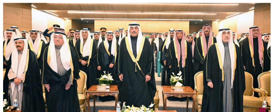
سمو ولي العهد الشيخ صباح الخالد حضر حفل الافتتاح

برعاية حضرة صاحب سمو أمير البلاد الشيخ مشعل الأحمد الجابر الصباح قام ممثل حضرة صاحب سمو أمير البلاد سمو ولي العهد الشيخ صباح خالد الحمد الصباح بحضور افتتاح مبنى قصر العدل الجديد وتفضل سموه بإزاحة الستار عن اللوحة التذكارية. تم افتتاح مبنى المرحلة الأولى من مشروع قصر العدل الجديد، الذي يُعد من أبرز المشاريع التنموية في دولة الكويت وأكبر صرح قضائي في منطقة الشرق الأوسط. ويمثل هذا المشروع الرائد، خطوة كبيرة