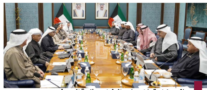
جانب من اجتماع مجلس الوزراء برئاسة اليوسف

عقد مجلس الوزراء اجتماعه الأسبوعي، في قصر بيان برئاسة رئيس مجلس الوزراء بالإذاعة وزير الداخلية الشيخ فهد اليوسف، وبعد الاجتماع صرح نائب رئيس مجلس الوزراء وزير الدولة لشؤون مجلس الوزراء شريدة المعوشجي بما يلي: أحاط رئيس مجلس الوزراء بالإذاعة وزير الداخلية الشيخ فهد اليوسف مجلس الوزراء علما في مستهل اجتماعه بنتائج جولته التي قام بها خلال الأسبوع الماضي إلى كل من مصر والأردن وسلطنة عمان والإمارات وقائه مع القاهرة مع رئيس جمهورية مصر العربية عبدالفتاح السيسي، وفي عمان الملك عبد الله الثاني بن الحسين بحضور ولي العهد الأردني الأمير الحسين بن عبدالله الثاني وأيضا لقاءه برئيس الوزراء وزير الدفاع الأردني الدكتور جعفر حسان، وفي مسقط السلطان هيثم بن