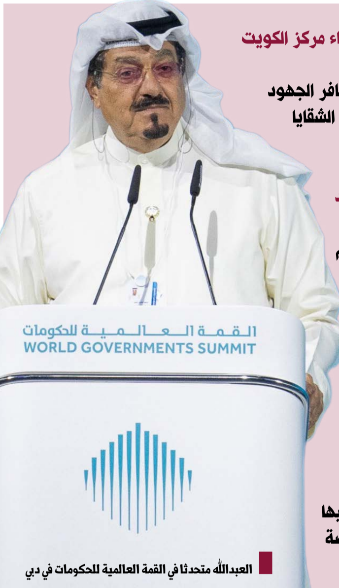
العبدالله متحدثاً في القمة العالمية للحكومات في دبي

أصحاب السمو والعالي والسعادة، ونحن إذ نستقبل الربيع الثاني من القرن الحالي، فإن العالم يقف على عتبات تحولات غير مسبوقة في مختلف المجالات، فالنمو المتسارع في التقنيات الحديثة مثل الذكاء الاصطناعي والأمن السيبراني والواقع الافتراضي Reality Virtual والبيانات الضخمة Data Big إلى جانب التغيرات الديموغرافية المبردة والتحويلات البيئية المتسارعة قد أوجدت واقعا جديدا يعيد تشكيل نمط حياة الشعوب بحمل في كنفه فرصاً وتحديات... أملاً ومخاوف تستدعي تبني رؤية واقعية مشتركة بين حكومات العالم بأمل وأعد بيعث على التنازل نحو آفاق مستقبلية يتحقق فيها الأمن والأمان والاستقرار لشعوبنا والعالم أجمع. وفي الختام، لا يسعني إلا أن أكرر الشكر لكم متمنياً لأعمال القمة كل التوفيق والنجاح لتحقيق الآمال المرجوة التي تتطلع إليها حكومات وشعوب العالم.