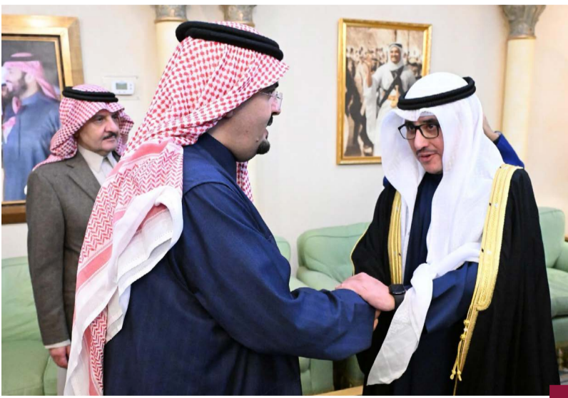
الشيخ الدكتور أحمد ناصر المحمد الأحمد الصباح يقدم واجب العزاء