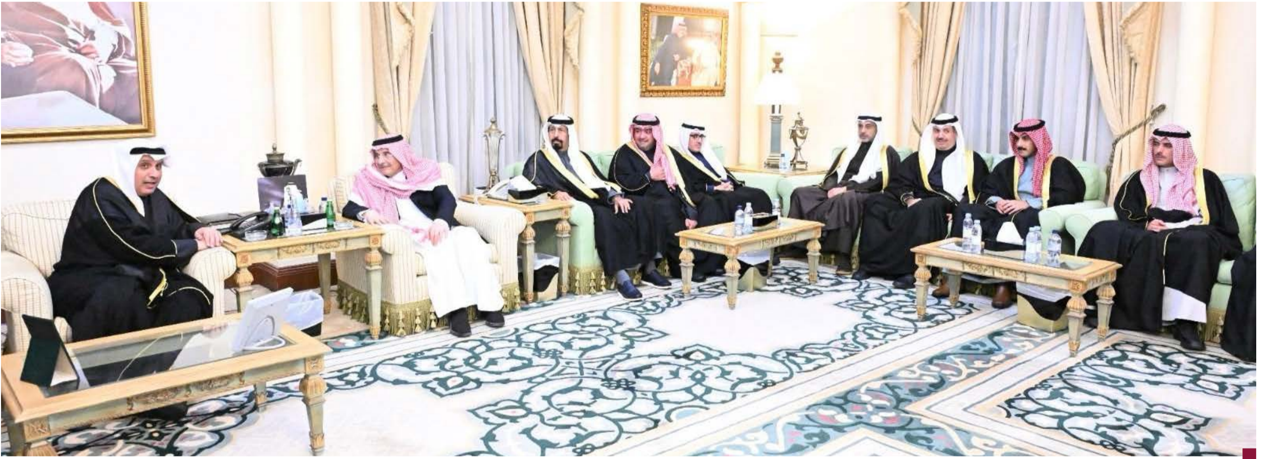
جانب من تقديم الشيخ حمد جابر العلي والوفد المرافق لواجب العزاء لأسرة الفقيد في السعودية

كونا - قام ممثل حضرة صاحب السمو أمير البلاد الشيخ مشعل الأحمد الجابر الصباح حفظه الله ورعاه وسمو ولي العهد الشيخ صباح خالد الحمد الصباح حفظه الله ، الشيخ حمد جابر العلي الصباح عصر الأربعاء بتقديم واجب العزاء إلى أسرة المغفور له بإذن الله