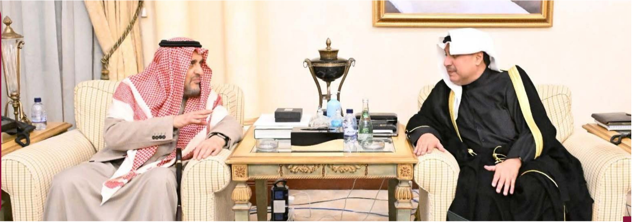
الشيخ حمد جابر العلي ممثلًا لسمو الأمير وسمو ولي العهد يقدم واجب العزاء في الرياض

عبدالله المبارك الصباح والشيخ مشعل جابر العبدالله الجابر الصباح والشيخ عبدالله ناصر صباح الأحمد الصباح ومحافظ الأحمد الصباح والشيخ حمود جابر الأحمد الجابر الصباح والشيخ فراس سعود عبدالله المالك الصباح والشيخ طلال مشعل الأحمد الجابر الصباح.