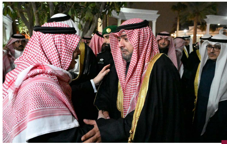
الشيخ ثامر علي صباح السالم الصباح يقدم واجب العزاء