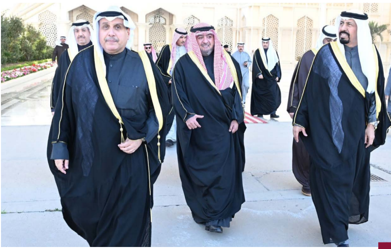
الشيخ حمد جابر العلي لدى مغادرته البلاد إلى السعودية لتقديم واجب العزاء