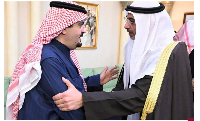
وزير الديوان الأميري الشيخ محمد عبدالله المبارك الصباح يقدم واجب العزاء