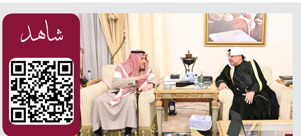
ممثل سمو الأمير و سمو ولي العهد، الشيخ حمد جابر العلي يقدم واجب العزاء في الرياض

نقل تحيات سمو الأمير إلى أعضاء الوفود المشاركة في الاجتماع المقام بالكويت