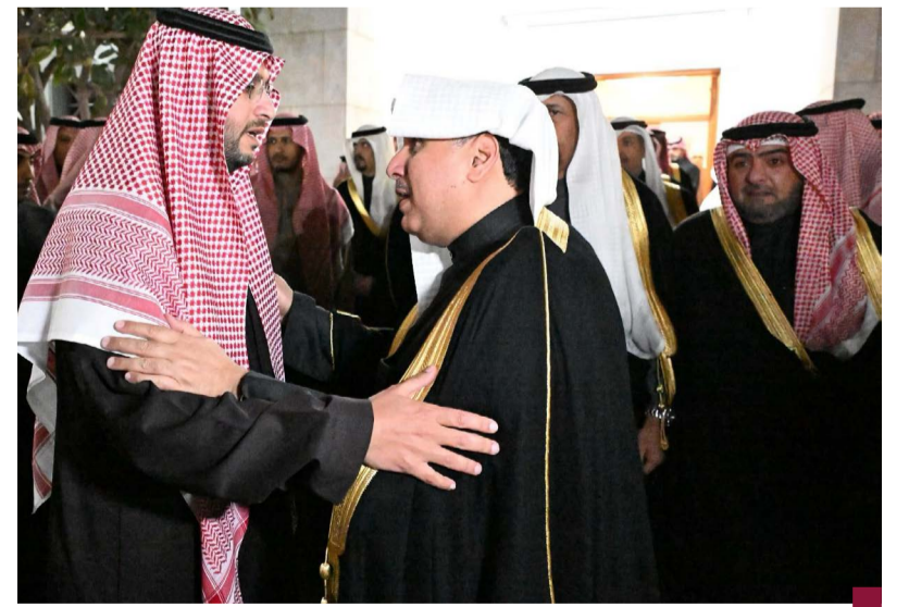
جانب آخر من تقديم الشيخ حمد جابر العلي لواجب العزاء في الرياض