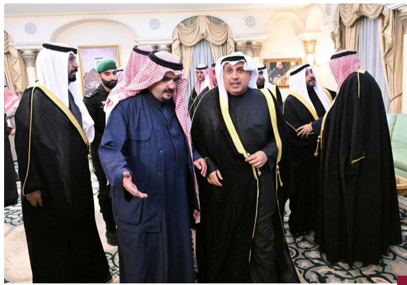
الشيخ حمد جابر العلي ممثلًا لسمو الأمير وسمو ولي العهد خلال تقديم واجب العزاء