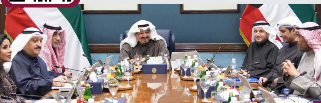
مجلس الوزراء يعقد اجتماعه الأسبوعي برئاسة الشيخ أحمد عبدالله

عقد مجلس الوزراء الأسبوعي الثلاثاء برئاسة سمو الشيخ أحمد عبدالله الأحمد الصباح رئيس مجلس الوزراء وبمناسبة احتفالية مراسم رفع العلم والتي ستقام في قصر بيان يوم الأحد الموافق ٢٠٢٥ - ٢٠٢٥ إيداناً بيده الاحتفالات الوطنية لدولة الكويت يتقدم مجلس الوزراء بخصال التهنية إلى مقام حضرة صاحب السمو أمير البلاد الشيخ مشعل الأحمد الجابر الصباح حفظه الله ورعاه وسمو ولي العهد الشيخ صباح خالد الحمد الصباح حفظه الله والشعب الكويتي الكريم سائلاً الباري عز وجل أن يعيد هذه المناسبة الوطنية على الكويت في كل عام وهي تنعم بالخير والرخاء والأزدهار.