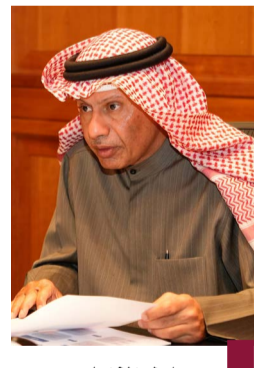
د. عادل الزامل

المقدمة وتحقيق الاستدامة، عقد وكيل وزارة الكهرباء والماء والطاقة المتجددة، الدكتور عادل الزامل اجتماعاً مع القطاعات المعنية بالمياه وخدمات العملاء، حيث تم مناقشة عدة ملفات أبرزها نظام الفوترة وخدمات العملاء ومشروع تركيب العدادات الذكية للكهرباء