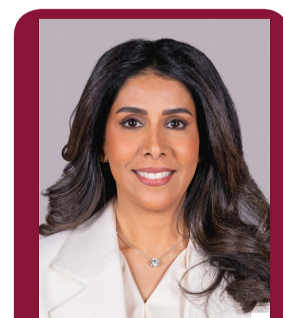
الدكتورة نورة المشعان