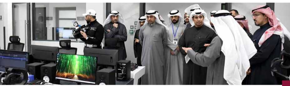
المطيري خلال تشييد المرحلة الثانية من الأرشيف التلفزيوني

استقبل النائب الأول لرئيس مجلس الوزراء وزير الدفاع وزير الداخلية، الشيخ همدان يوسف، اليوم، نائب رئيس أركان القوات المسلحة لدولة الإمارات العربية المتحدة الشقيقة، اللواء الركن الشيخ أحمد بن طحون، وذلك في إطار زيارته الرسمية البلاد. وتم خلال اللقاء مناقشة سبل تعزيز التعاون بين البلدين الشقيقين، لاسيما في المجال العسكري. وتأتي هذه الزيارة في سياق العلاقات المتميزة بين القوات المسلحة في البلدين، والتي تهدف إلى تعزيز التعاون في المجالات الدفاعية. حضر اللقاء نائب رئيس الأركان العامة للجيش اللواء الركن طيار صباح جابر الأحمد الصباح، وسفير دولة الإمارات