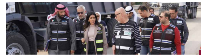
جانب من الزيارة الميدانية

سبل تعزيز التعاون المشترك مع المحافظات، وتناول الاجتماع أبرز التحديات التي تواجه البنية التحتية بما في ذلك صيانة الطرق ومناقشة المشاريع والخطط المستقبلية وآلية تنفيذها. وتناول الاجتماع سبل تطوير الخدمات العامة والاهتمام بالطرق والبنية التحتية وصيانتها، لتنفيذ السياسة العامة للدولة بما يتوافق مع توجهات القيادة السياسية ويرقى لتطلعات المواطنين في جميع المحافظات.