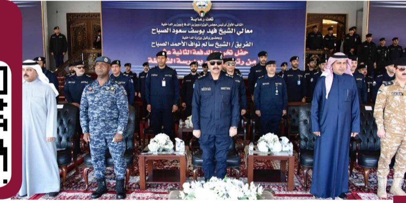
جانب من الاحتفالية

والاستقرار في الوطن، مشيراً إلى أهمية تخصصي الدراجات النارية والأخرى في التعامل مع التحديات الميدانية.