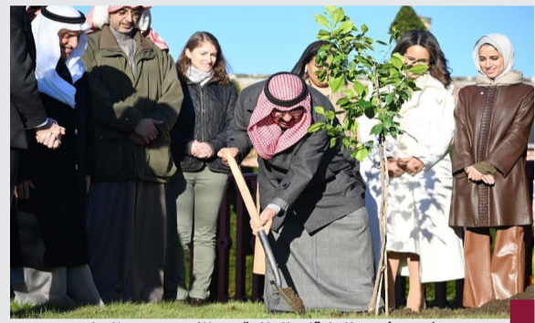
وسموه يغرس شجرة العلاقات الدائمة بين الكويت وبريطانيا