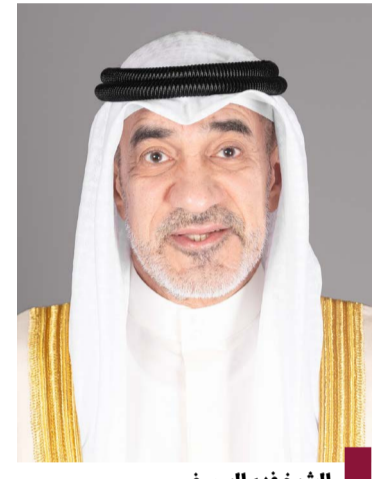
الشيخ فهد اليوسف

وأعربت سفيرة المملكة المتحدة لدى دولة الكويت بيليندا لويس عن بالغ سرورها باختيار صاحب السمو أمير دولة الكويت الشيخ مشعل الأحمد شجرة لغرسها في إحدى حدائق بيت «دمفريس هاوس» بمقاطعة أيرشاير الاسكتلندية قائلة: إن «الشجرة تعتبر رمزاً للصداقة الدائمة والمتنامية مع دولة الكويت». جاء ذلك في