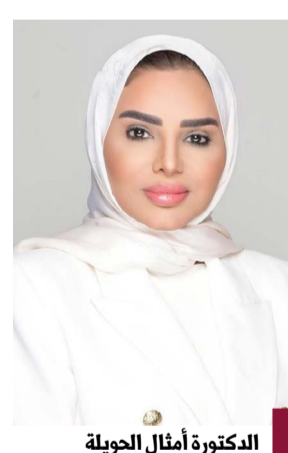
الدكتورة أمثال الحويلة

أعلنت وزير الشؤون الاجتماعية وشؤون الأسرة والطفولة الدكتورة أمثال الحويلة استئناف تسليم الكراسي المتحركة للأشخاص ذوي الإعاقة بعد توقف استمر لسنوات في خطوة إنسانية تهدف إلى تحسين جودة حياتهم وتلبية احتياجاتهم الأساسية. وأوضحت الحويلة في تصريح صحفي أن هذا الإجراء يأتي ضمن خطة شاملة لدعم حقوق ذوي الإعاقة وضمان حصولهم على الخدمات التي تسهم في تحسين جودة حياتهم. وأضافت أنها تعمل على إزالة جميع العقبات التي حالت دون توفير هذه الأدوات والعدات الحيوية خلال الفترة السابقة مشددة على أهمية التعاون مع الجهات المعنية لضمان استمرارية تقديم هذه الخدمة. وأكدت حرصها على بذل الجهود المكثفة لتحسين البنية التحتية وتطوير الخدمات المقدمة للأشخاص ذوي الإعاقة بما في ذلك توفير المعدات الطبية وبرامج التدريب والدعم النفسي والاجتماعي.