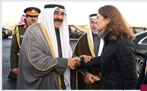
سمو الأمير يغادر اسكتلندا

سموه عاد لأرض الوطن بعد زيارة اسكتلندا بدعوة شخصية من الملك تشارلز الثالث