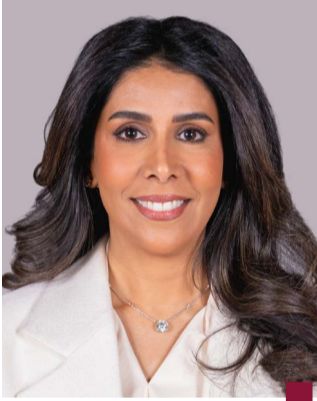
الدكتورة نورة المشعان

النقل المتزايدة. ولضمت إلى ما توليه وزارة الأشغال من اهتمام كبير بمتابعة جميع مراحل التنفيذ من التصميم إلى الإنجاز مع الالتزام بمعايير الجودة والمواصفات الفنية المعتمدة عالمياً لضمان تحقيق أعلى مستويات الأداء والمتانة للطرق.