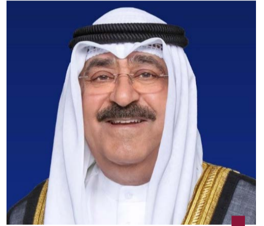
سمو الأمير الشيخ مشعل الأحمد

مؤكدا سموه رعاه الله على التطلع الدائم والمشارك تعزيزاً لأواصر هذه العلاقات التاريخية والارتقاء بها. وطالب التعاون بينهما في مختلف المجالات وعلى كافة الأصعدة إلى أفاق أرحب متمنياً سموه له موفور الصحة والعافية وللمملكة المتحدة وشعبها الصديق كل الازدهار والرفق وللعلاقات الراسخة بين البلدين الصديقين المزيد من التطور والنماء.