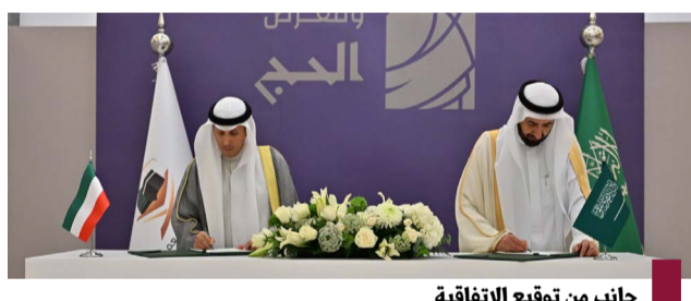
جانب من توقيع الاتفاقية

وزير الأوقاف الكويتي ووزير الحج السعودي اتفقا على ترتيب شؤون حجاج الكويت