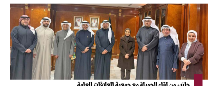
جانب من لقاء الجولة مع جمعية العلاقات العامة

ترأس وزير الخارجية عبدالله اليحيا وفد دولة الكويت المشارك في أعمال اجتماع الرياض بشأن سوريا والذي استضافته المملكة العربية السعودية الشقيقة الأحد. وقالت وزارة الخارجية في بيان إن الاجتماع عقد بمشاركة عدد من وزراء خارجية الدول العربية والغربية ويمتلي المنظمات الدولية لبحث التطورات التي شهدتها سوريا وتوحيد الموقف لدعم وتحسين الظروف المعيشية والإنسانية