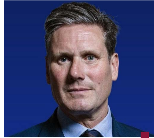
كير ستارمير رئيس وزراء المملكة المتحدة