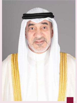
الشيخ فهد اليوسف

عرض وزير الداخلية ويتبني على ذلك سحب الجنسية الكويتية ممن يكون قد اكتسبها عن حامل تلك الشهادة بطريقة التبعية. وأعلن المدير العام لهيئة العامة للمعلومات المدنية بالتكليف جابر الكندري تفعيل تطبيق «هويتي» لزوجات الكويتيين الأجانب، وفقاً للمادة الثامنة من قانون الجنسية الكويتية ممن سحبت جنسياتهن استناداً للكشوفات الواردة من وزارة الداخلية وذلك بناء على توجيهات النائب الأول لرئيس مجلس الوزراء ووزير الدفاع ووزير الداخلية الشيخ فهد