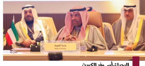
اليحيا ترأس وفد الكويت

للشعب السوري. وأفادت أن الاجتماع بحث أيضاً تقديم الدعم الإنساني والتنموي لتلبية احتياجات الشعب السوري الأساسية وتسهيل عودة المهجرين واللاجئين إلى ديارهم. ودعم عودة الاستقرار السياسي والأمني والتعافي الاقتصادي والتنموي ووضع الخطوات اللازمة لتحقيق ذلك ومناقشة السبل الكفيلة نحو ضمان سيادة سوريا ووحدة أراضيها واستقلالها السياسي.