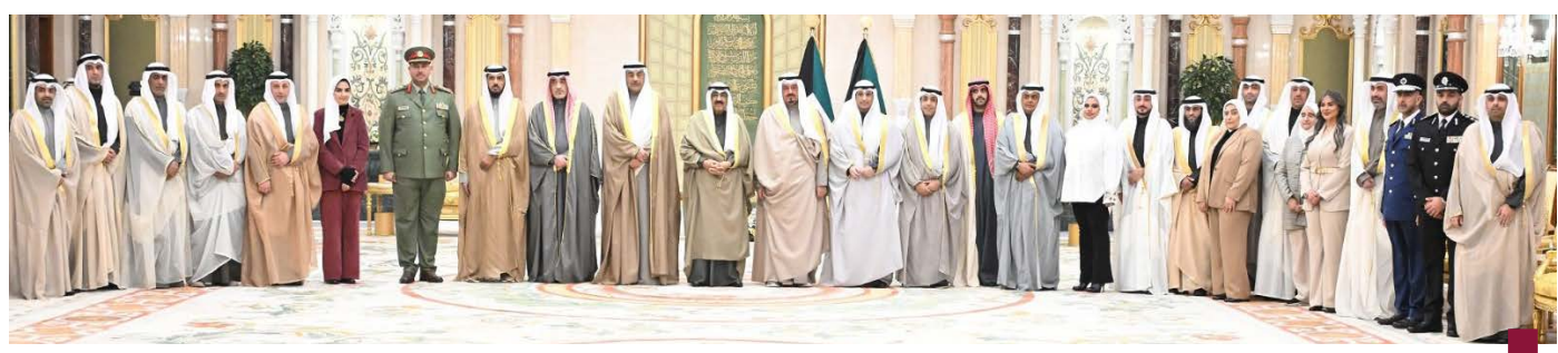
صورة جماعية لسمو الأمير واللجنة المنظمة للبطولة