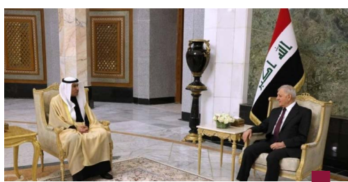
الرئيس العراقي مستقبلاً السفير الكويتي الجديد