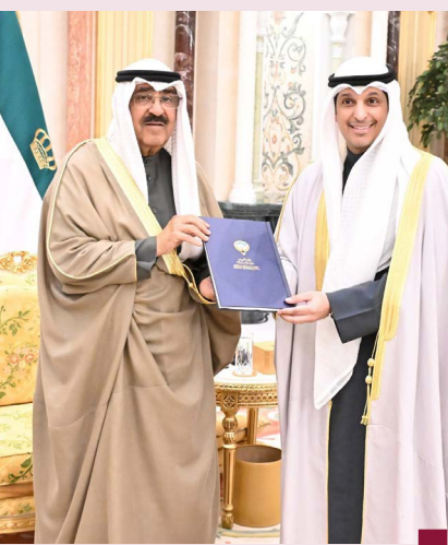
سمو الأمير مع وزير الإعلام

وقال وزير الإعلام والثقافة وزير الدولة لشؤون الشباب رئيس اللجنة العليا المنظمة لـ «خليجي زين ٢٦» عبد الرحمن المطيري، خلال استقبال سمو أمير البلاد الشيخ مشعل الأحمد الجابر له ونائب رئيس وأعضاء اللجنة ورؤساء اللجان العاملة المنظمة للبطولة، إنه «يبرهنني باسمي وباسم أعضاء اللجنة العليا المنظمة لخليجي زين ٢٦ ورؤساء اللجنة المنظمة السخي وأضحيت هذه النسخة علامة فارقة في مسيرة الرياضة الخليجية وراعيانكم الكريمة لهذا الحدث الرياضي تعكس عمق رؤيتكم وحرصكم على ترسيخ التآخي بين شعوب الخليج العربي وتجسيد دور الكويت الرائد مركزاً للمحبة والسلام في المنطقة.