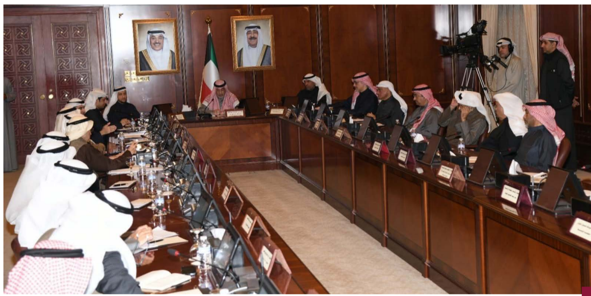
اليوسف خلال اللقاء المفتوح مع رؤساء تحرير الصحف وجمعيات النفع العام

عقد النائب الأول لرئيس مجلس الوزراء ووزير الدفاع ووزير الداخلية رئيس اللجنة العليا لتحقيق الجنسية الكويتية الشيخ فهد يوسف سعود الصباح لقاء مفتوح الأربعاء مع رؤساء تحرير الصحف اليومية والمدير العام لوكالة الأنباء الكويتية (كونا) ورؤساء جمعيات النفع العام المعنية في تمام الساعة العاشرة والنصف صباحاً بقصر السيف. وناقش الشيخ فهد يوسف الصباح خلال اللقاء الذي حضره وزير الإعلام والثقافة ووزير الدولة لشؤون الشباب عبدالرحمن المطيري وعدد من الوزراء المختصين وأعضاء اللجنة العليا لتحقيق الجنسية أبرز ملامح التعديلات على قانون الجنسية الجديد المتضمنة في المرسوم بقانون رقم (١١٦) لسنة ٢٠٢٤ بتعديل بعض أحكام المرسوم الأميري رقم (١٥) لسنة ١٩٥٩ بقانون الجنسية. وقال الشيخ فهد يوسف في بداية اللقاء: «رحب برؤساء تحرير الصحف اليومية وممثلي جمعيات النفع العام وناقشتم هذه الفرصة للإعراب عن تقديراتنا العميقة لمهنتكم ودوركم المحوري كحلقة وصل موثوقة بين الحكومة والوطنيين وأوافقنا» وتجمع اليوم لمناقشة أحد أهم وأخطر الموضوعات السياسية والاجتماعية التي مرت بها الكويت وهو موضوع آثار تساوؤات عدة بين الناس حول سحب الجنسية لاسيما ما يتعلق بالمادة الثامنة من القانون.