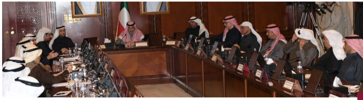
النائب الأول الشيخ فهد اليوسف خلال اللقاء

«أمامنا 2100 حالة تجنيس «أعمال جلية» يتم فحصها.. والخدمات الجلية يجب أن تكون للكويت وليس لشركة أو عضو أو وزير