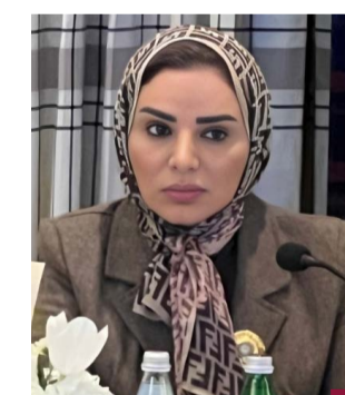
د. أمثال الحويلة

أكدت وزير الشؤون الاجتماعية وشؤون الأسرة والطفولة الدكتورة أمثال الحويلة أهمية الاجتماع والتنسيق الهادئ لوزراء الشؤون والتنمية الاجتماعية بدول مجلس التعاون لدول الخليج العربية باعتبارها منصة لتعزيز التعاون المشترك وتحقيق التنمية والرفاه الاجتماعي لشعب الخليج. وقالت الحويلة في كلمة خلال الاجتماع الذي عقد في مملكة البحرين إن التنسيق الخليجي في القضايا الاجتماعية يعكس التزام الدول الأعضاء بتعزيز العمل المشترك لمواجهة التحديات الاجتماعية وتحقيق أهداف التنمية المستدامة. وقالت الحويلة إن الأسر المنتجة تمثل ركيزة أساسية في تحقيق التنمية الاقتصادية والاجتماعية