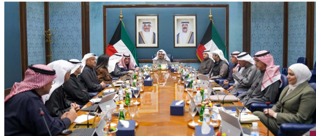
المجلس عقد اجتماعه الأسبوعي برئاسة سمو الشيخ أحمد عبدالله

اعتماد محضر اللجنة العليا بفقد وسحب الجنسية الكويتية من أشخاص حصلوا عليها بالغش والتزوير