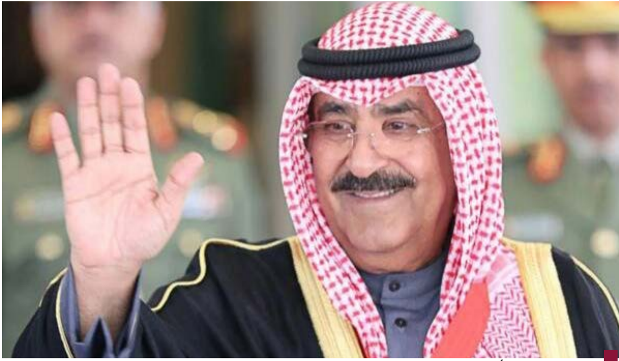
حضرة صاحب السمو أمير البلاد الشيخ مشعل الأحمد

(كويتا) - احتفلت الكويت وشعبها الكريم الاثنين بالذكرى الأولى لمناداة مجلس الوزراء بسمو الشيخ مشعل الأحمد أميراً للبلاد ليخلف على نهج أسلافه أمراء الكويت الكرام في مسيرة الإنجاز والريادة للكويت وعهد ميمون مملوءة الأمل بمستقبل زاخر. ففي ١٦ ديسمبر عام ٢٠٢٣ اجتمع مجلس الوزراء برئاسة سمو الشيخ أحمد السواف اثر إعلان وفاة الأمير الراحل الشيخ نواف الأحمد الجابر الصباح طيب الله ثراه حيث نادى بسمو الشيخ مشعل الأحمد الجابر الصباح أميراً للبلاد باعتبار سموه ولياً للعهد وفقاً لأحكام الدستور والمادة الرابعة من القانون رقم ٤ لسنة ١٩٦٤ في شأن أحكام توارث الإمارة بما عرف عن سموه من حكمة وإخلاص وتضامن لكل ما فيه رفعة الكويت وأمنها واستقرارها.