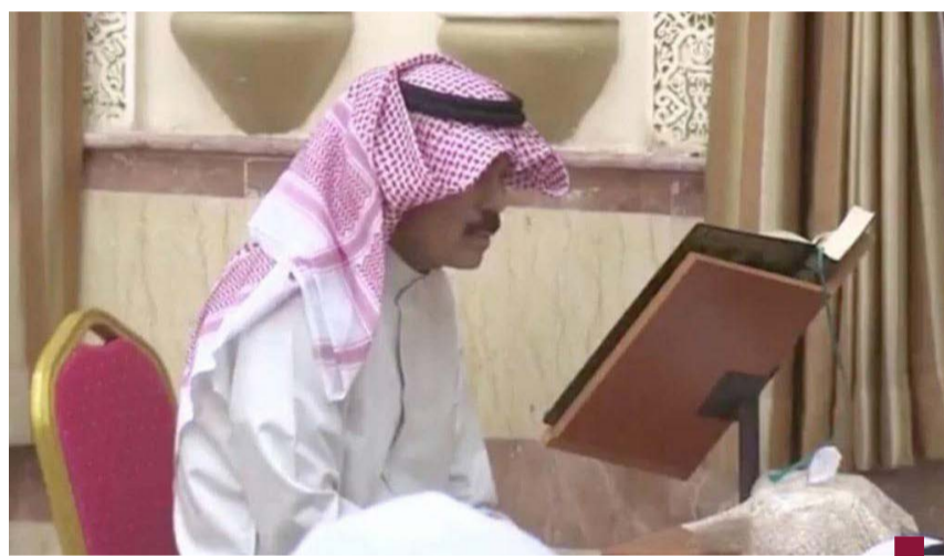
كان معروفا عن الراحل تقواه وورعه

الرحيل وفي يوم ١٦ ديسمبر عام ٢٠٢٣ رحل سمو الشيخ نواف الأحمد، ولكن ذكراه وإنجازاته ومناقبه وخصاله العطرة ستبقى خالدة في سجل تاريخ الكويت لتكون منارة للأجيال تستلهم منها دروس البذل والعطاء وتقديم الغالي والنفيس من أجل عزة البلاد ورفعتها والحفاظ على أمنها وأمانها.