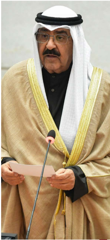
سمو الأمير يلقي خطابه السامي في مجلس الأمة

وفي ٧ مايو الماضي زار سمو أمير البلاد تركيا في زيارة دولة شهد خلالها توقيع ست اتفاقيات في عدة مجالات ثم استقبل في ١٢ مايو الأمين العام للأمم المتحدة أنطونيو غوتيريش كما استقبل في ١١ سبتمبر رئيس المجلس الأوروبي شارل ميشيل إضافة إلى استقبال عدد من المسؤولين من الدول العربية والعالمية. وتمضي مسيرة الخير والإعمار والتنمية والتطوير في البلاد في ظل قيادة سموه الحكيم كما قادها أسلافه الكرام ليستكمل إسهاماتهم الجليلة في صنع تاريخ بلد الخير والعطاء وبناء مجده وإعلاء رايته وتعزيز مكانته إقليمياً وعربياً ودولياً.