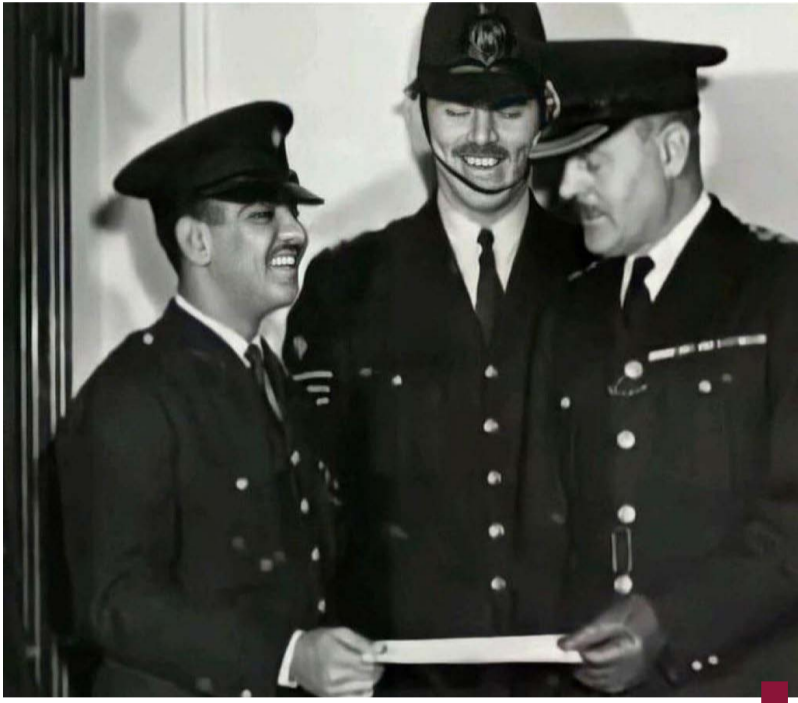
سمو الأمير خلال دراسته علوم الشرطة في المملكة المتحدة

شهدت البلاد خلال الأشهر الـ 12 الماضية في عهد سموه إنجازات في شتى المجالات لتعزيز الدور الريادي للكويت إقليمياً ودولياً