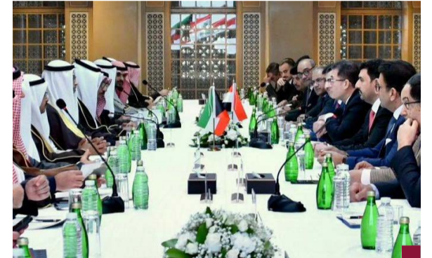
جانب من الاجتماع في بغداد.

بينما تستذكر الكويت بكل مشاعر الوفاء مناقب أمير التواضع الراحل سمو الشيخ نواف الأحمد الجابر الصباح في ذكرى رحيل سموه الأولى، يحتفل الشعب الكويتي بالذكرى الأولى لمناداة مجلس الوزراء لسمو الشيخ مشعل الأحمد أميراً للكويت لتدخل البلاد عهداً جديداً شعاره الحزم والعزم. ويهدى المناسبة العزيزة على قلوبنا جميعاً، ذكرى مناداة صاحب السمو الشيخ مشعل الأحمد الجابر الصباح حفظه الله ورعاها أميراً للكويت، فإننا نجدد الولاء والسمع والطاعة لسموه، ونذعو لله عزوجل أن يمدد بموهبه الصحة وتمام العافية وان يجعله عزاً وذخراً للكويت ولأهلها وأمتنا العربية والإسلامية. والشعب الكويتي يشعر بالفخر والاعتزاز لان دولته قدمت نموذجاً مثالياً يدرس في العالم أجمع لانتقال السلطة بصورة سلسلة وهادئة وحكيمة، ففي ١٦ ديسمبر عام ٢٠٢٣ اجتمع مجلس الوزراء برئاسة سمو الشيخ أحمد النواف إثر إعلان وفاة الأمير الراحل الشيخ نواف الأحمد الجابر الصباح طيب الله ثراه حيث نادى بسمو الشيخ مشعل الأحمد الجابر الصباح أميراً للبلاد باعتبار سموه ولياً للعهد ووفقاً لأحكام الدستور والمادة الرابعة من القانون رقم ٤ لسنة ١٩٦٤ في شأن أحكام توارث الإمارة بما عرف عن سموه من حكمة وإخلاص وتقان لكل ما فيه رفعة الكويت وأمنها واستقرارها. ويمكننا أن نطلق على صاحب السمو أمير البلاد الشيخ مشعل الأحمد الجابر الصباح حفظه الله ورعاها بأنه أمير الحزم والعزم.. فقد كان سموه طوال ١٢ شهراً حازماً في قراراته لحفظ رفاة الدولة وأمنها واستقرارها وسعادة شعبها