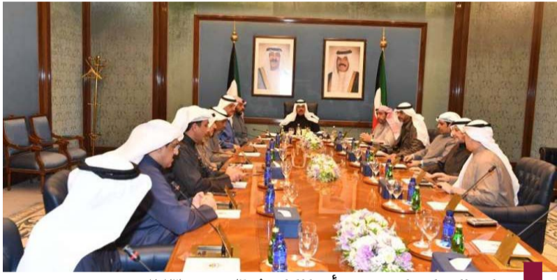
مجلس الوزراء يناقش بسموه أميراً للبلاد في ١٦ ديسمبر ٢٠٢٣

أكد سموه في مناسبات عدة حرصه على حل المشكلات التي تواجه الأمة العربية وقضاياها العادلة