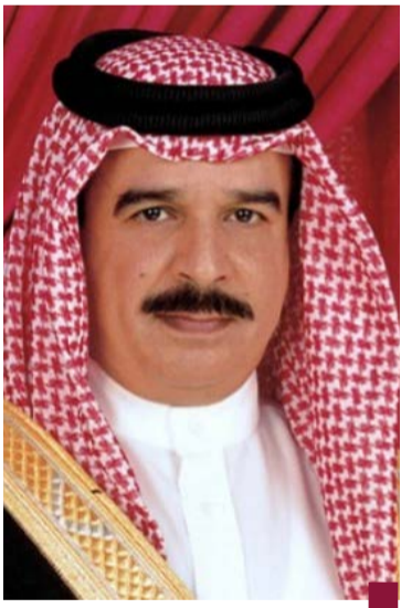
جلالة الملك حمد بن عيسى

سمو رئيس مجلس الوزراء يبعث ببرقية تهنئة إلى الملك حمد بن عيسى بن سلمان آل خليفة ملك مملكة البحرين