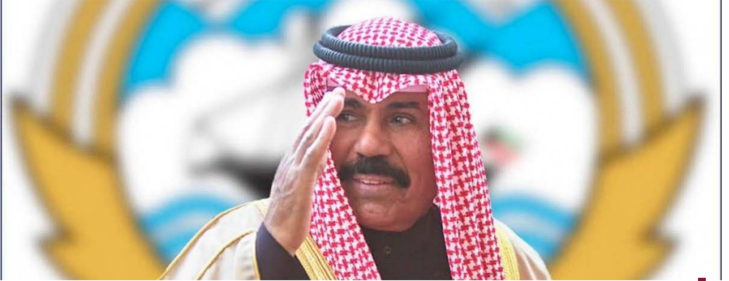
الأمير الراحل الشيخ نواف الأحمد

في الذكرى الأولى لرحيل سموه في 16 ديسمبر 2023