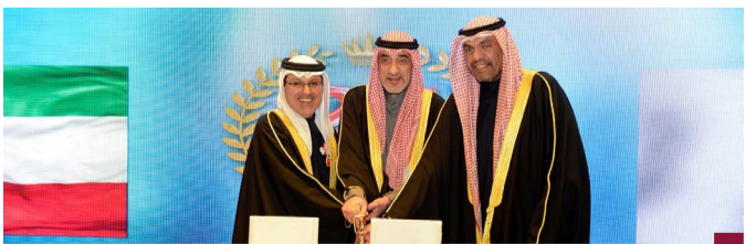
اليوسف والبيجا في احتفال سفار البحرين

قال سفير مملكة البحرين لدى البلاد السفير صلاح المالكي إن التعاون الثنائي بين دولة الكويت ومملكة البحرين يشهد تكاملاً وتطوراً ونمواً مستمراً على الصعد كافة وبما يعود بالخير والنماء على البلدين والشعبين الشقيقين. جاء ذلك في كلمة للسفير المالكي خلال الحفل الذي أقامته السفارة البحرينية لدى البلاد بمناسبة الذكرى الـ٥٣ للعيد الوطني لمملكة البحرين والذكرى الـ٢٥ لتولي الملك حمد بن عيسى آل خليفة مقاليد الحكم بحضور النائب الأول لرئيس مجلس الوزراء وزير الدفاع ووزير الداخلية الشيخ