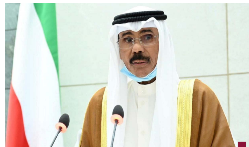
الأمير الراحل وهو يلقي خطابه السامي في مجلس الأمة

وفي ٢٦ يناير عام ١٩٨٨ أسندت إلى الأمير الراحل حقيبة وزارة الدفاع وحرص خلالها على تعزيز المنظومة العسكرية وتزويد الجيش الكويتي بأحدث الأجهزة والمعدات من دول مختلفة وتعزيز القدرات القتالية لأفرادها.