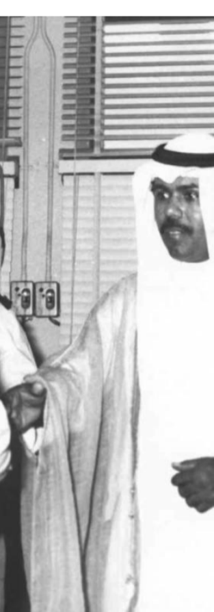
كانت للراحل بصمات في تاريخ الكويت

مع حلول الذكرى الأولى لوفاته سمو الأمير الراحل الشيخ نواف الأحمد -طيب الله ثراه- التي تصادف الإثنين تستحضر الكويت وشعبها الكريم بمشاعر الوفاء والعرفان ذكرى أمير العفو الذي عاشت في ظل قيادته الحكيمة ثلاث سنوات حرص خلالها على تطويرها واستقرارها وإعلاء مكانتها إقليمياً وعالمياً.