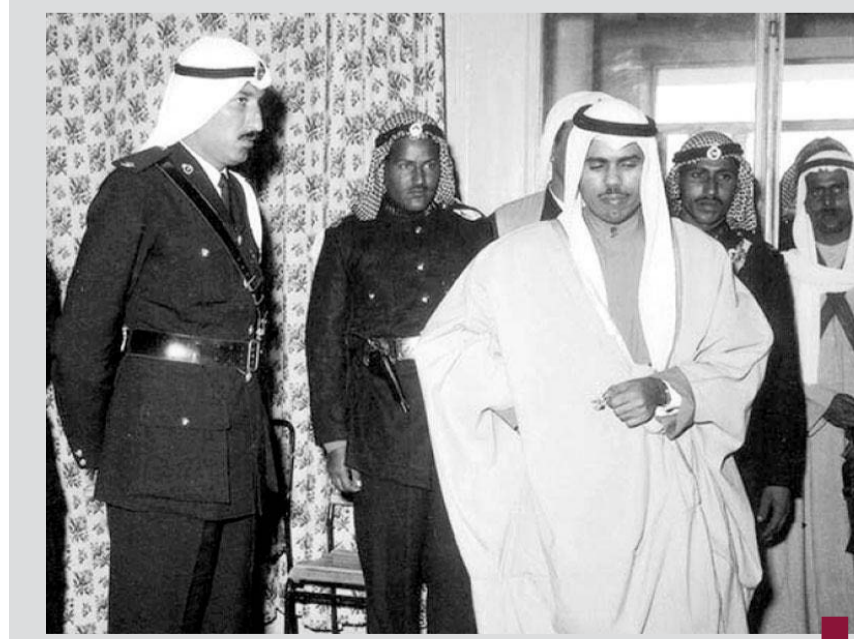
كان للراحل دور في تطوير وزارة الداخلية

- ولد الأمير الراحل الشيخ نواف الأحمد الجابر الصباح، الحاكم الـ١٦ للدولة الكويت، في ٢٥ / ٦ / ١٩٣٧، في فريج الشيوخ (موقع مجمع المثني حالياً) في مدينة الكويت. - وهو النجل السادس لحاكم الكويت العاشر الشيخ أحمد الجابر المبارك الصباح (حكم الكويت في الفترة ما بين ١٩٦١ - ١٩٥٠) - عاش وتربى في بيت الحكم قصر دسمان، وتلقى تعليمه في مدارس الكويت المختلفة، مثل مدرسة حمادة، وشرق، والنقرة، ثم في المدرسة الشرقية والمباركية، وواصل دراساته في أماكن مختلفة من الكويت. - بدأ عمله السياسي منذ استقلال الكويت مطلع الستينات، حيث عينه الراحل الشيخ عبد الله السالم في ٢١ فبراير ١٩٦١ محافظاً لحوالي، لمدة ١٦ عاماً، وظل