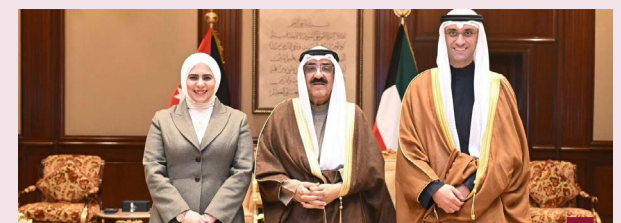
سمو الأمير مستقبلا الفصام والسالم