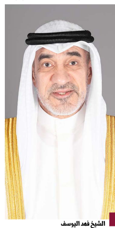
الشيخ فهد اليوسف

يبحث القضايا ذات الاهتمام المشترك واخر المستجدات على الساحتين الإقليمية والدولية، وسبل تنمية وتعزيز مصالح البلدين المشتركة على مختلف الأصعدة. واستقبل سمو ولي العهد الشيخ صباح خالد الحمد الصباح حفظه الله بقصر بيان عصر آخاه صاحب السمو الملكي الأمير الحسين بن عبدالله الثاني ولي العهد في المملكة الأردنية