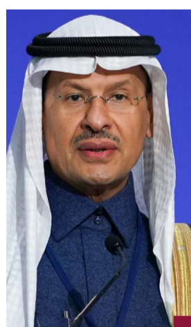
وزير الطاقة السعودي

تواصل فريق دمى الأبرياء في ظل تأخر صيانة الطرق الخارجية لسنوات طويلة، حيث أعلنت قوة الإطفاء العام أن فرقة إطفاء مركز عريضجان تعاملت فجر الأحد مع حادث تصادم بين مركبتين على طريق الأرتال. وقد أسفر الحادث عن حالة وفاة وإصابة شخص وتم تسليم الموقع للجهات المختصة. وطريق الأرتال في المنطقة الشمالية للكويت مهمل تماما وخارج دائرة الاهتمام والمراقبة من قبل الجهات المختصة ويقع في منطقة صحراوية يكثر فيها مشاكل الطريق التي تتفاقم وتنتج عنها الخسائر والأضرار الكبيرة في الأرواح والممتلكات بسبب حوادث الطرق. ويعاني طريق الأرتال من سيارات المستهترين التي تدمر الطرق وتزعج المارة وكذلك تسبب الاطارات المتطايرة بانلاف السيارات بسبب التحصينات المستمر رغم أن هذا الطريق يخدم على السالم الجوية العسكرية، ويوصل أيضا أصحاب الحلال إلى مخيماتهم ومزارعهم في الوفرة.