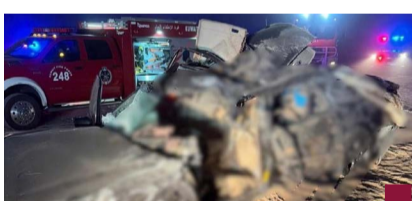
حادث طريق الأرتال أمس

أعلنت وزير الأشغال العامة الدكتورة نورة المشعان بدء أعمال الصيانة الجذرية للطرق في محافظة مبارك الكبير ضمن عقود الصيانة الجذرية الجديدة لأعمال الطرق السريعة والداخلية التي تشمل 18 ممارسة كبرى لصيانة الطرق في مختلف مناطق البلاد بالمحافظات الست. وقالت الدكتورة المشعان في تصريح صحفي إن سرعة إنجاز كل أعمال الصيانة في المحافظة بالجدولة والكفاءة المطلوبين هي أولوية قصوى وفقا للمواصفات الفنية المعتمدة والالتزام بالبرنامج الزمني المتعهد به. وأكدت أن توجيهاتها بالبداية في