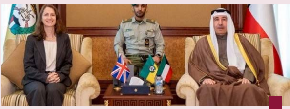
رئيس الحرس الوطني يستقبل سفيرة المملكة المتحدة