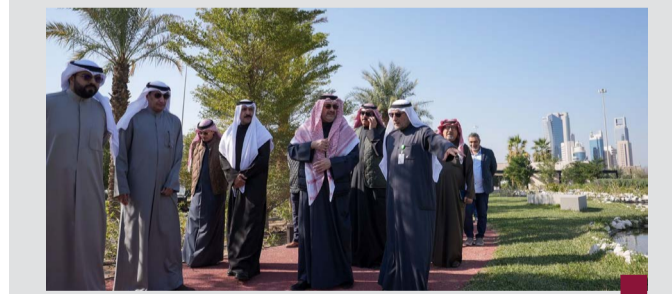
جانب من الجولة التفقدية