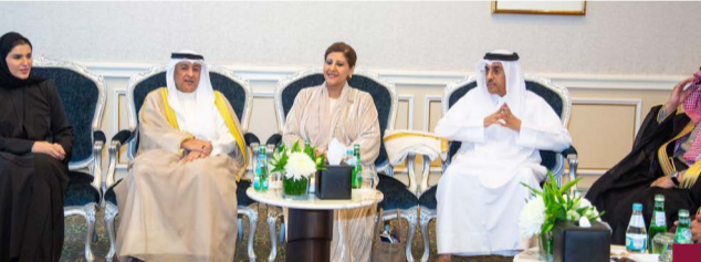
جانب من الاحتفال

بمناسبة اليوم العالمي لحقوق الإنسان تؤكد وزارة الخارجية إيلاء دولة الكويت اهتماماً خاصاً بحقوق الإنسان استناداً إلى التشريعات الوطنية والاتفاقيات والمواثيق الدولية ذات الصلة. وقالت (الخارجية) في بيان صحفي إنه في إطار عضوية دولة الكويت في مجلس حقوق الإنسان للفترة 2024-2026، تؤكد الوزارة على مواصلة تطبيق كل الالتزامات الطوعية المقدمة خلال العضوية تحقيقاً لأهداف التنمية المستدامة 2030 التي تعزز حياة ورفاه الأفراد بما يضمن لهم الحياة الكريمة. وأكدت مساعد وزير الخارجية لشؤون حقوق الإنسان السفيرة الشيخة جواهر إبراهيم الدعيج الصباح التزام دول مجلس التعاون لدول الخليج العربية الراسخ بتعزيز حقوق الإنسان انطلاقاً من التشريعات الوطنية وتعاليم الشريعة الإسلامية السليمة والتعاقد والتقليد والقيم الأصيلة المتجذرة في دول المجلس. وذلك عقب مشاركتها في الاحتفالية الخاصة بدول مجلس التعاون لدول الخليج العربية بمناسبة مرور 10 سنوات على الإعلان الخليجي لحقوق الإنسان. وقال الأمين العام لمجلس التعاون