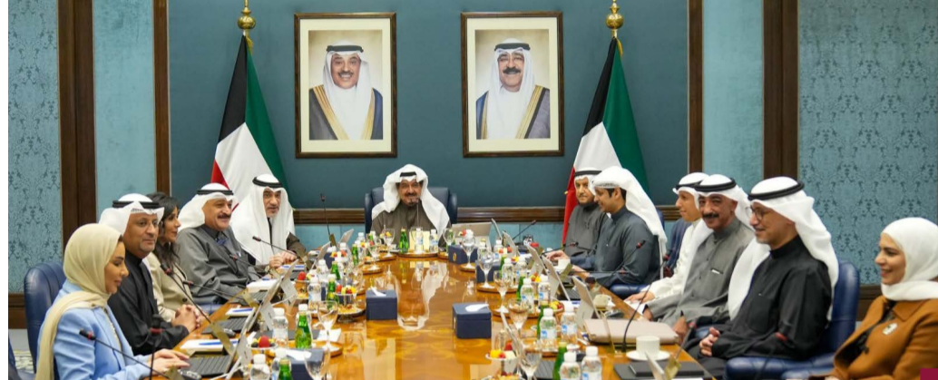
جانب من اجتماع مجلس الوزراء

تم إطلاق تطبيق حجز تذكار حضور المباريات (حياكم) باللغتين العربية والإنجليزية. واطلع مجلس الوزراء على عرض مرئي مقدم من وزارة المالية بشأن تقرير لجنة حصر الأراضي والمباني غير المستغلة والمواقع المسأجرة التابعة للجهات الحكومية والذي يتضمن الإجراءات التي قامت بها اللجنة بالتنسيق مع الجهات الحكومية المعنية إضافة إلى التوصيات التي انتهت إليها بهدف استغلالها بالشكل الأمثل وتحقيق الاستفادة القصوى منها للحفاظ على المال العام ومجلس الوزراء يكلف وزارة المالية بالتنسيق مع الجهات الحكومية المعنية بالضيء قداماً لاتخاذ الإجراءات اللازمة لسرعة تنفيذ التوصيات الواردة في التقرير وموافاة مجلس الوزراء بتقرير دوري كل ثلاثة أشهر عن آخر المستجدات في هذا الشأن. وقرر مجلس الوزراء اعتبار الهيئة العامة للمعلومات المدنية جهة مركزية معنية بنظم المعلومات الجغرافية على مستوى الدولة