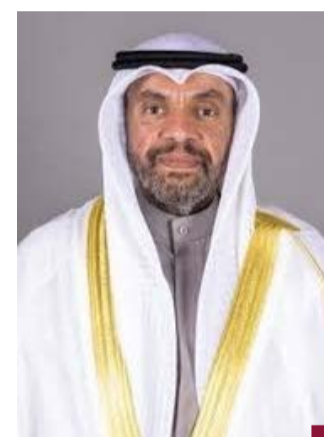
وزير الخارجية عبدالله الجبعا