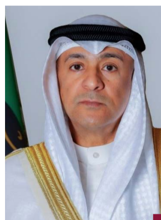
الأمين العام لمجلس التعاون جاسم البديوي

أعربت وزارة الخارجية عن إدانة دولة الكويت واستنكارها الشديدتين لقيام قوات الاحتلال الإسرائيلي باحتلال المنطقة العازلة على الحدود السورية في انتهاك صارخ للقوانين الدولية وقرارات مجلس الأمن والتي أكدت على ضرورة احترام سيادة سوريا واستقلالها ووحدة أراضيها وسلامتها الإقليمية. وأكدت وزارة الخارجية في بيان أهمية اضطلاع المجتمع الدولي بمسؤولياته لوضع حد لسلسلة الاعتداءات الإسرائيلية على دول المنطقة ومحاسبة مرتكبي هذه الانتهاكات حفاظاً على الأمن والسلم الإقليميين والدوليين.