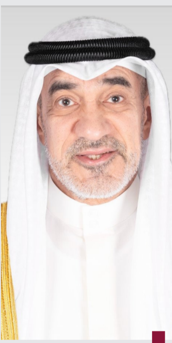
الشيخ فهد اليوسف

الجنسية، وخلال 100 يوم تقريباً من ٢٩ أغسطس الماضي وحتى ٥ ديسمبر وصل عدد من سحبت وفقدت جنسيتهم إلى ٩١٣٢ حالة، غالبيتها تعود لنساء. وبحسب الأرقام المعلنة من قبل اللجنة العليا في اجتماعاتها الأسبوعية، بلغ عدد المشمولين خلال نوفمبر الماضي ٥٨٧٠ حالة، وفي أكتوبر الماضي ٨٢٠، وفي سبتمبر ٢٠٢، و٧٨٥ حالة في أغسطس ويضاف إليها عدد من تم سحب وفقد جنسيتهم يوم ٥ ديسمبر وعددهم (2162) حالة.