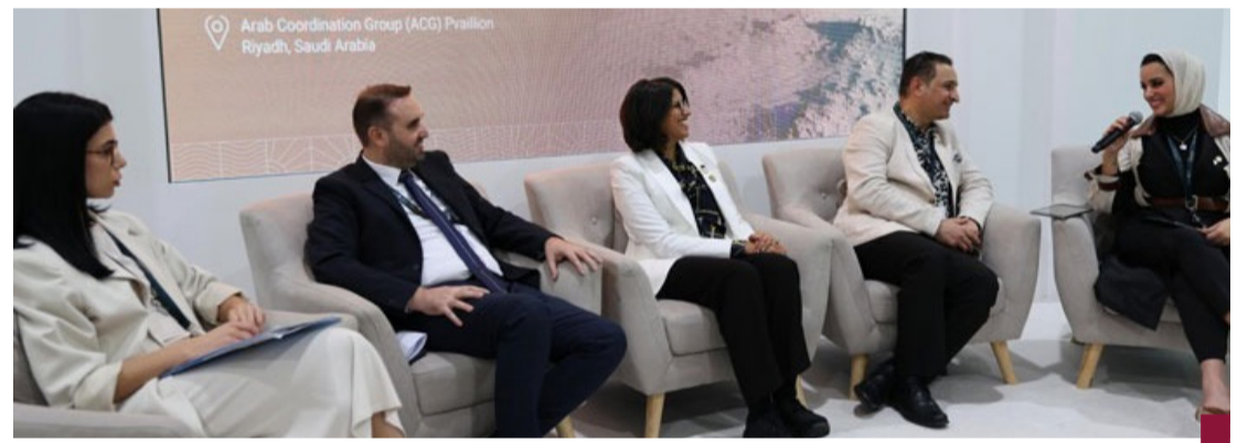
جانب من الجلسة الحوارية

بسرعة إنجاز جميع الأعمال بالجودة والكفاءة المطلوبة وفق المواصفات الفنية المعتمدة والالتزام بالبرنامج الزمني المتعهد به. وشددت على أن ملف صيانة وإصلاح الطرق من أولويات القيادة السياسية في البلاد والتوجيهات السامية لسمو أمير البلاد الشيخ مشعل الأحمد وسمو ولي العهد الشيخ صباح الخالد ودعمهما بشأن مشاريع صيانة الطرق وصولاً إلى تحقيق ركيزة بنية تحتية متطورة ضمن خطة «كويت جديدة ٢٠٣٥». من جانبه أكد المشرف على الصيانة الجذرية لأعمال الطرق في «الأشغال» المهندس عبدالله الكندري، حرص فرق الوزارة على سلامة البنية التحتية لخطوط الصرف الصحي للأمطار من خلال التنظيف وإصلاح الأعطال مشيراً إلى أنه سيتم الانتقال إلى موقع في منطقة العقبيلة، ودعا أهالي المنطقة إلى التعاون لإنجاز الأعمال في الوقت المحدد.