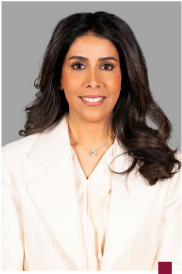
د. نورة المشعان

وجهد وزير الأشغال العامة ووزير البلدية د. نورة المشعان إلى البدء بأعمال الصيانة الجذرية لأعمال الطرق في محافظة الأحمدية ضمن عقود الصيانة الجذرية الجديدة لأعمال الطرق السريعة والداخلية وتشمل ١٨ ممارسة كبرى لصيانة الطرق في مختلف مناطق البلاد بالمحافظات الست. وقالت الوزير المشعان في تصريح صحفي إن العمل سينطلق في المناطق الأكثر تضرراً فالأقل مع وجود رقابة وإشراف ومتابعة على أعمال الصيانة مؤكدة أن جميع الطرق سيتم تعديلها وصيانتها. وذكرت أن فرق عمل من وزارة الأشغال ستراقب تنفيذ أعمال الصيانة لافتة إلى أنه تم تشكيل لجنة لاختيار المهندسين المشرفين وتم عمل اختبارات للمهندسين للتأكد من إدارتهم. وشددت على ضرورة التنسيق لحل المواضيع العالقة الخاصة بأعمال صيانة الطرق، مطالبة