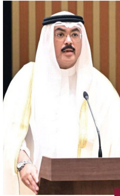
المهندس جلال الطبيباني

أعلن وزير التربية المهندس جلال الطبيباني عن انتهاء أزمة إضراب عمال شركات النظافة المتعاقدة مع الوزارة، مؤكداً استمرار عملها في جميع المؤسسات التعليمية. وأوضح وزارة التربية في بيان أن ذلك يأتي في إطار حرص المستمر على استقرار العملية التعليمية وتهيئة بيئة تعليمية صحية وأمنة لأبنائنا وبناتنا الطلبة وقال الطبيباني إن «وزارة التربية وبتوجيهات القيادة السياسية الرشيدة ومجلس الوزراء المؤقت، قامت باتخاذ كافة الإجراءات اللازمة لصرف مستحقات مالية متأخرة للشركات بعد مراجعات دقيقة وفق النظم واللوائح المعمول بها بالتعاون والتنسيق مع الجهات المختصة، لضمان استمرار تقديم الخدمات دون انقطاع». وأشار الطبيباني إلى «أهمية التعاون بين القطاعين الحكومي والخاص، حيث تعد شركات النظافة شريكاً في توفير بيئة تعليمية آمنة وصحية تعزز استقرار واستمرارية العملية التعليمية» مبيناً أن «الوزارة ملتزمة بضمان حقوق العمالة لدى الشركات المتعاقدة، بما