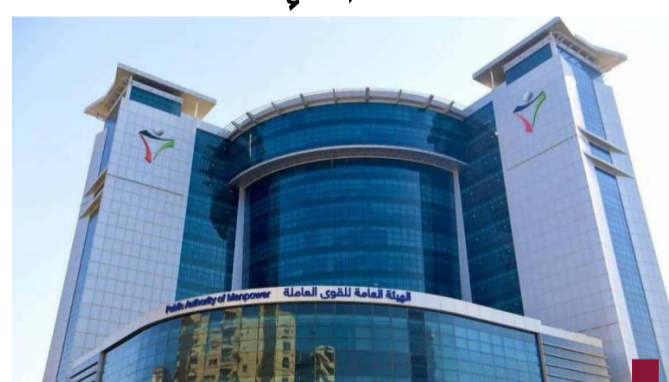
الهيئة العامة للقوى العاملة

أعلنت الهيئة العامة للقوى العاملة، عن بدء تطبيق القرار الوزاري رقم ١٢ لسنة ٢٠٢٤، اعتباراً من يوم أمس، والذي يهدف إلى تسهيل الإجراءات وتعزيز المرونة في تنظيم سوق العمل الكويتي، ويأتي هذا القرار في إطار التوجيهات الصادرة عن النائب الأول لرئيس مجلس الوزراء وزير العمل الداخلية الشيخ فهد اليوسف، وحرص الهيئة على تطوير بيئة العمل بما يلي متطلبات السوق ويعقق التوازن بين حقوق العمالة الوافدة واحتياجات أصحاب الأعمال. أبرز ملامح القرار الوزاري، ١. إلغاء الرسوم الإضافية والتأمين الصحي للعمالة الوافدة فوق الستين عاماً وأعلنت الهيئة عن إلغاء العمل بالقرار السابق الذي كان يلزم العمالة الوافدة التي بلغت الستين