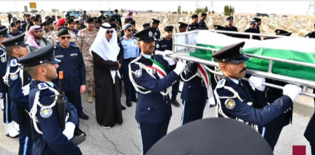
اليوسف يتقدم تشييع الشهيدان

اليوسف: رحلا وهما يؤديان واجبهما في الميدان ما يجسد كل معاني الإخلاص والعطاء للوطن النواف: تضحيات مشرفة مضينة دائماً في ذاكرة الوطن وتجسد أسمى معاني الولاء والانتماء