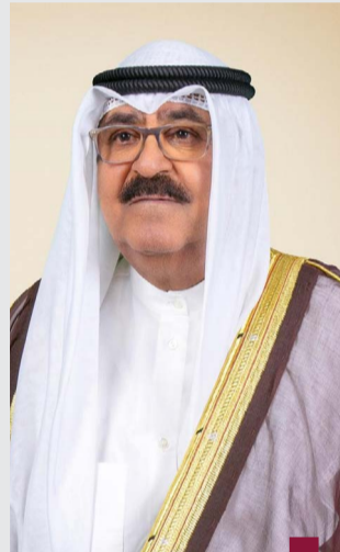
سمو الأمير الشيخ مشعل الاحمد

اليوسف: رحلا وهما يؤديان واجبهما في الميدان ما يجسد كل معاني الإخلاص والعطاء للوطن النواف: تضحيات مشرفة مضينة دائماً في ذاكرة الوطن وتجسد أسمى معاني الولاء والانتماء