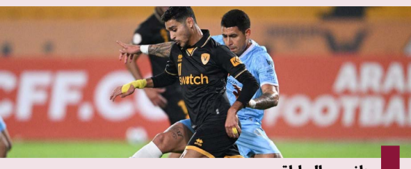
جانب من المباراة

استقبل سمو ولي العهد الشيخ صباح الخالد، بقصر بيان صباح اليوم، وزير الخارجية الأميركي الأسبق جون كيري والوفد المرافق وذلك بمناسبة زيارته للبلاد. حضر اللقاء مدير مكتب سمو ولي العهد الفريق متقاعد جمال محمد الذياب ووكيل الشؤون الخارجية بديوان سمو ولي العهد مازن عيسى العيسى.