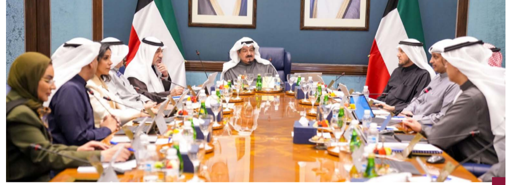
جانب من اجتماع المجلس برئاسة عبدالله

شيعت الكويت في جنازة عسكرية شهيد الوافي وكيل عريف بدر العازمي ووكيل عريف طلال الدوسري من مرتبات الإدارة العامة للمرور التابعة لوزارة الداخلية، والشهيدان توفيا إثر حادث مروري اثناء أداءهما واجبهما الوطني مساء أمس الأول. ويعد سمو أمير البلاد الشيخ مشعل الاحمد، بيرقيتي تعزية إلى أسرتي شهيد الوافي اعرب فيهما سموه عن خالص تعازيه وصادق مواساته بوفاة فقيديهما إثر تعرضهما لحادث دهس مؤلم وهما يؤديان واجبهما الأمني بكل تفرغ وإخلاص مبتهلا سموه إلى البارئ جل وعلا أن يتغمدهم بواسع رحمته ويسكنهم فسيح جناته وأن يلهم أسرتهما الكريمتين جميل الصبر وحسن العزاء. ويعد كل من سمو ولي العهد الشيخ صباح الخالد، وسمو الشيخ أحمد عبدالله رئيس مجلس الوزراء بيرقيتي تعزية إلى أسرتي شهيد الوافي. وشارك النائب الأول لرئيس مجلس الوزراء وزير الدفاع والداخلية الشيخ فهد اليوسف ووكيل وزارة الداخلية الشيخ الفريق سالم النواف ونائب رئيس الأركان اللواء ركن طيار الشيخ