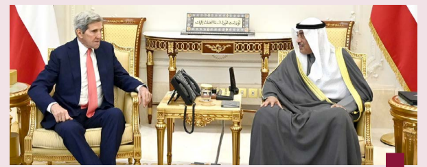
سمو ولي العهد يستقبل جون كيري