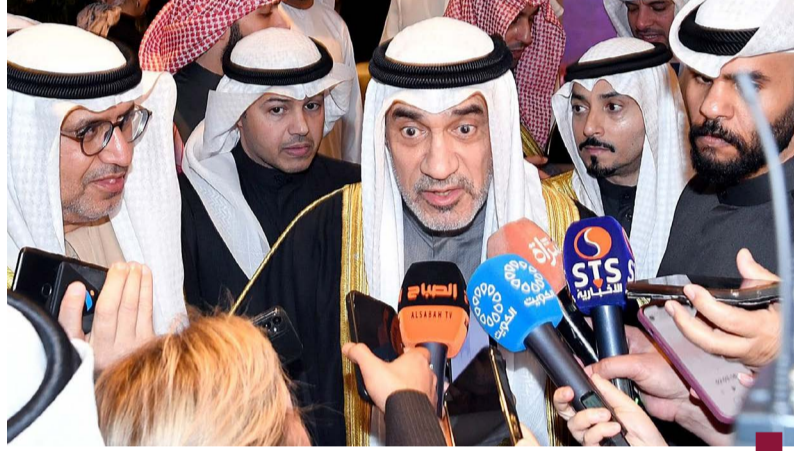
اليوسف يصرح للصحفيين

أكد النائب الأول لرئيس مجلس الوزراء وزير الدفاع وزير الداخلية رئيس اللجنة العليا لتحقيق الجنسية الكويتية الشيخ فهد اليوسف، أن الكويت بلد إنسانية ولن تنسى من خدمها. جاء ذلك في تصريح أدلى به اليوسف للصحفيين عقب مشاركته في الاحتفالية التي أقامتها سفارة الإمارات لدى البلاد بمناسبة الذكرى الـ ٥٣ لتأسيس الاتحاد. وذكر الشيخ فهد اليوسف أن الجنسية شيء والحياة في الكويت شيء آخر، والكويت بلد إنسانية ولن تنسى من خدمها. وجدد التأكيد على أن جميع من سحبت جنسياتهن من زوجات الكويتيين والمطلقات والأرامل الققيات في الكويت بناء على المادة الثامنة من قانون الجنسية سيقين في وظائفهن وسيستأذين وراتبين ذاتها موضعاً أن هذه