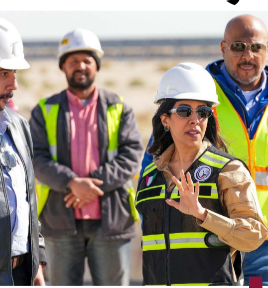
المشعان تتفقد المشروع

أكدت وزير الأشغال العامة الدكتورورة نورة المشعان بضرورة تسريع وتيرة إنجاز مشروع جسر منطقة (صباح الناصر) وأهمية تكثيف المعدات والعمالة للانتهاء من المشروع في المدة الزمنية المحددة وحسب المقدم المبرم. جاء ذلك في تصريح صحفي للمشعان عقب الزيارة التقديرية للمشروع للوقوف على آخر المستجدات ومتابعة تنفيذ أعمال الصيانة الخاصة بالجسر ميدانياً وذلك في إطار جهود وزارة الأشغال في تعزيز البنية التحتية. وشددت على ضرور متابعة حالة الجسر وإجراء الصيانة اللازمة لضمان سلامة الجميع وسلامة الطرق المحيطة بهدف تحسين خدمات الطرق والنقل وضمان استدامتها مستقبلاً أفضل للمواطنين. ووجهت المسؤولين عن المشروع بالعمل على إنهائه لخدمة أهالي المنطقة والسعي لاستكمال أعمال تطويره وصيانته إذ يعد طريقاً حيويًا خاصة مع كثافة الشاحنات على الطريق والازدحامات المرورية. ودعت الفرق المعنية بالوزارة والهيئة العامة للطرق والنقل البري للمضي قدماً نحو استكمال تنفيذ الأعمال واستكمال المراحل التنفيذية وضرورة الإنجاز المطلوب في المواعيد المحددة وفق المعايير المتفق عليها.