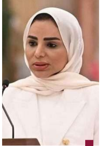
د. أمثال الحويطة

أكدت وزارة الشؤون الاجتماعية أنها ستتحذد الإجراءات القانونية ضد أي أطراف يثبت تورطها في مخالفات قانونية بالجمعيات التعاونية أو بالتوريد لها. وقالت الوزارة في بيان صحفي إنها تحقق في شكوى تقدم بها أحد المواطنين حول أفرع الخضار والفواكه والتي تخضع حالياً للمتابعة الدقيقة من الجهات المختصة للتحقق من محتواها. وأضافت أن هذه الإجراءات تأتي بتعليمات وتوجيهات من وزيرة الشؤون الاجتماعية وشؤون الأسرة والطفولة د.أمثال الحويطة التي أكدت أهمية التعامل الجاد مع هذه القضايا وضمان نزاهة العمل في الجمعيات التعاونية. وأوضحت أنها تعمل بالتنسيق مع الجهات الرقابية للتحقق من صحة ما ورد في الشكوى، مشددة على التزامها باتخاذ كل التدابير اللازمة لضمان الحفاظ على الجمعيات التعاونية والمساهمين.