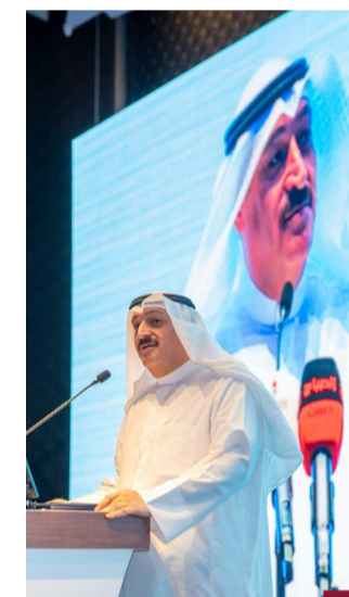
د. احمد العوذي

أعلن وزير الصحة الدكتور أحمد العوذي، أن الكويت أول دولة في الشرق الأوسط توفر تطعيمات لحماية الأطفال من عدوى فيروس الجهاز التنفسي الخلوي والتهاب القصيبات الهوائية والالتهاب الرئوي. معتبراً هذا التطعيم نقلة نوعية تعزز مكانة الكويت في مجال طب الأطفال. وشدد الوزير العوذي في تصريح للصحفيين عقب افتتاح مؤتمر الكويت الثاني لطب الأطفال على أهمية هذا التطعيم