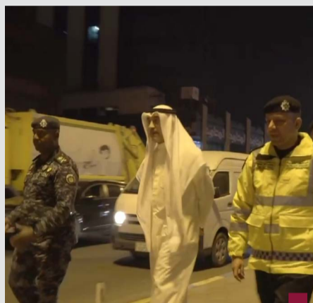
اليوسف يقود الحملة الأمنية