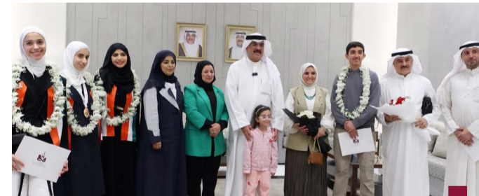
الطبيباني مستقبلي الطلبة الفائزين

أعلنت وزارة الأوقاف والشؤون الإسلامية، إغلاق منصة التسجيل المركزي لموسم الحج 1446 هـ الأحد الساعة ١٢ ظهرا. وأوضحت «الأوقاف» أن عملاء فرز الحجاج ستبدأ مباشرة في تمام الوحدة من ظهر يوم الأحد.