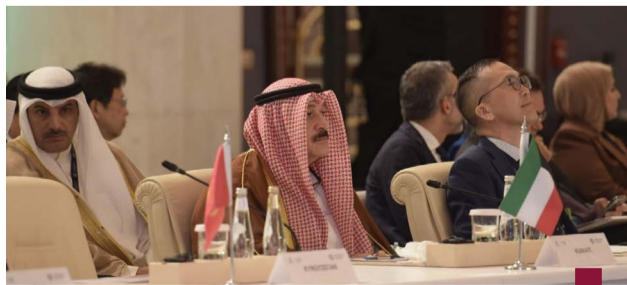
وزير الصحة خلال المؤتمر

قالت دولة الكويت في اللجنة الثالثة للجمعية العامة في البند العنون ب «تقرير مفوض الأمم المتحدة السامي لشؤون اللاجئين والمسائل المتصلة باللاجئين والعائدين والمشردين، والمسائل الإنسانية» إن عقودا من النزاعات التي لم يتم حلها حتى حينه، علاوة على الزيادة المروعة بنسبة ٨٠% أعداد النازحين قسرا، أثبتت الحاجة الملحة والمصيرية لتواجد الوكالات الأممية والأغاثية النبيلة في مواقع النزاعات. وأعربت الكويت عن القلق الشديد إزاء التقارير الأممية القائمة بالاحتلال لجهود إقامة الدولة الفلسطينية.