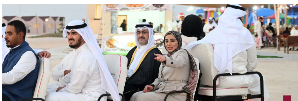
الوزيرة الحويلة ومحافظ العاصمة في افتتاح مشروع المكشآت

أعلنت الإدارة العامة للمرور التابعة لوزارة الداخلية، إغلاق طريق السلطان قابوس بين سعي «الدائري السابع» القادم من القطناس والقادم من الجراء بالاتجاهين مع تحويل المركبات إلى تقاطع «الصليبية وكيد»، وقالت «المرور» في بيان صحفي إن فترة الإغلاق ستكون حتى الانتهاء من أعمال الصيانة الجذرية للإسفلت. وبدأت الهيئة العامة للطرق في أعمال الصيانة الجذرية لطريق الدائري السابع، وذلك ضمن أعمال عقود الصيانة التي وقعتها الوزارة مع الشركات الفائزة، ويعد تنفيذ أعمال صيانة طريق الدائري