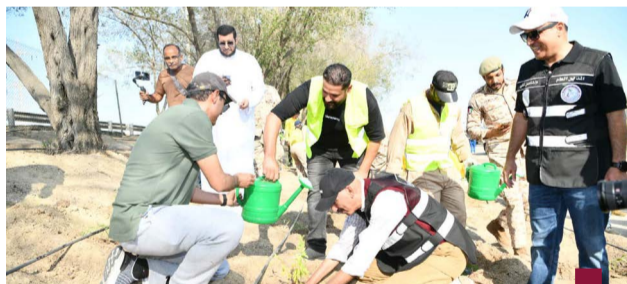
الوزير بوشهري مشاركا في حملة التشجير

أكد وكيل وزارة الأشغال العامة بالتكليف عبد الرشيد أن الوزارة لا تالو جهدا في موضوع الأمن الغذائي باعتباره جانبا مهما وتحرص دائما على دعمه وتوفير ما يمكن توفيره. وأشار الرشيد في تصريح خلال افتتاح سوق العبدلي الموسمي إلى طرح مناقشتين متعلقان بالأمور المختصة بالزراعة للمنطقتين الشمالية والجنوبية بالإضافة إلى الأمور اللوجيستية المتعلقة في الطرق. وشدد على أن وزارة الأشغال حاضرة دعما لكافة الأمور المتعلقة بالأمن الغذائي في البلاد، وقال إن هناك تنسيقا دائما مع كافة الجهات ومن ضمنها اتحاد المزارعين لتلبية كافة احتياجاتهم التي تعزز الأمن الغذائي.