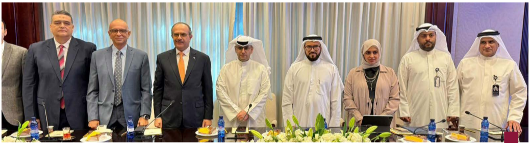
جانب من توقيع العقود

أصدر وزير الصحة الدكتور أحمد العوضي الأحد قرارا بإحالة أربع منشآت صحية إضافية إلى جهاز المسؤولية الطبية وذلك لمخالفتها القرار الوزاري رقم «٨٧» لسنة ٢٠٢٣ المتعلق بضوابط وتوائح تنظيم الإعلانات الطبية في القطاع الأهلي وذلك في إطار الحملة المستمرة لتنظيم القطاع الصحي الأهلي وضمان الامتثال للأنظمة والقوانين. وقالت الوزارة في بيان صحفي إن القرار يأتي بعد رصد فرق التفتيش