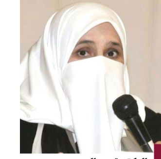
الدكتور عبيد البجوه

أعلنت مدير إدارة تعزيز الصحة في وزارة الصحة الدكتورة عبيد البجوه ارتفاع نسبة الخمول البدني بين اليافعين من عمر ١١ إلى ١٧ عاماً في الكويت وفق إحصائية حديثة إلى ٨٤ في المئة، وبين البالغين إلى ٦٧ في المئة. وقالت البجوه في كلمتها خلال دورة تدريبية تنظيمها الإدارة الأحد بالتعاون مع إدارة الرعاية الأولية بالوزارة، إن الدورة تهدف إلى نشر مفهوم تعزيز النشاط البدني وتعميم الدليل الإرشادي نحو تشجيع وتعزيز النشاط البدني. وذكرت أنه تم تحديث الدليل الإرشادي باللغتين العربية والإنجليزية بهدف نشر الوعي الصحي اللازم لجميع فئات المجتمع وكل الأعمار، مشيرة إلى أن الخمول البدني أحد عوامل الخطورة المسببة للأمراض المزمنة غير السارية. وبيّنت أن الدورة تستعرض جميع الاشتراطات الصحية لتشجيع وتعزيز النشاط