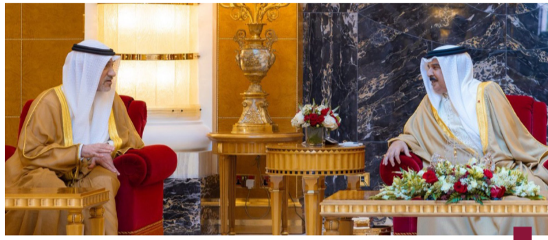
ملك البحرين يستقبل النائب الأول الشيخ فهد اليوسف

وأكد أهمية التشاور والتنسيق المستمر بين الأشقاء في مملكة البحرين ودولة الكويت لا سيما في الظروف الحالية والتحديات التي تواجه المنطقة بما يعزز ويدعم علاقاتهما الأخوية ويخدم مصالحهما المتبادلة. ومن جهته نقل الشيخ فهد اليوسف إلى ملك البحرين تحيات وتقدير أخيه صاحب السمو أمير البلاد الشيخ مشعل الأحمد الجابر الصباح وتمنياته الطيبة لمملكة البحرين وشعبها بدوام التقدم والرخاء تحت قيادته الحكيمة. كما أعرب عن شكره وتقديره لملك