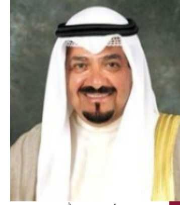
سمو الشيخ أحمد عبدالله

أجرى سمو الشيخ أحمد عبدالله رئيس مجلس الوزراء اتصالا هاتفيا أمس مع دولة رئيس حكومة تصريف الأعمال في الجمهورية اللبنانية الشقيقة نجيب ميقاتي. ونقل سمو رئيس مجلس الوزراء تحيات حضرة صاحب السمو أمير البلاد الشيخ مشعل الأحمد الجابر الصباح حفظه الله ورعاه وسمو ولي العهد الشيخ صباح خالد الحمد الصباح حفظه الله حيث أكد سموه على وقوف دولة الكويت مع الجمهورية اللبنانية الشقيقة في كافة ما تتخذ من إجراءات لحفظ أمنها واستقرارها وسلامة أراضيها إثر ما تعرضت له من اعتداءات سافرة على يد قوات الاحتلال الإسرائيلي شتدا على دعم ومساندة الشعب اللبناني الشقيق. وطلب سمو رئيس مجلس الوزراء من دولة رئيس حكومة تصريف الأعمال في الجمهورية اللبنانية الشقيقة ما يحتاجه الشعب اللبناني من احتياجات إنسانية ووعد سموه بتبليغها في أقرب وقت. وقد ضمن دولة رئيس حكومة تصريف الأعمال في الجمهورية اللبنانية الشقيقة موقف دولة الكويت الثابت والداعم للجمهورية اللبنانية في هذه الظروف العصيبة التي تمر بها.