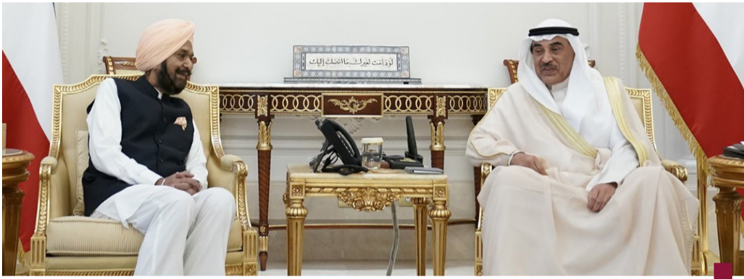
سمو ولي العهد مستقبلاً رئيس المجلس الأولمبي الآسيوي

الشيخ جابر ثامر جابر الصباح ومدير عام المجلس الأولمبي الآسيوي حسين علي المسلم ونائب مدير عام المجلس الأولمبي الآسيوي فينود تيوار.