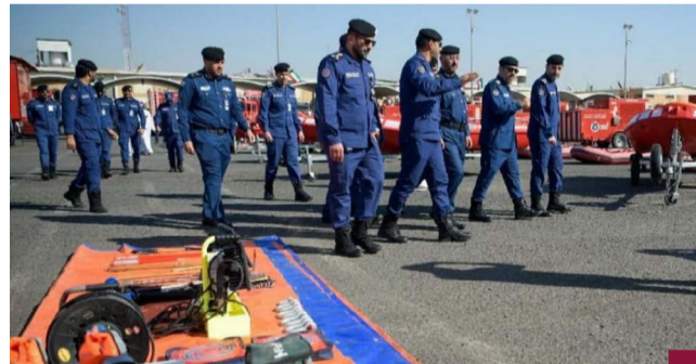
جانب من الجولة

متابعة سير حركة التعامل مع البلاغات وتوجيه الفرق للخروج من الحوادث بأقل الأضرار الممكنة مع معالجة أي تداعيات مصاحبة لحالة عدم استقرار الطقس.