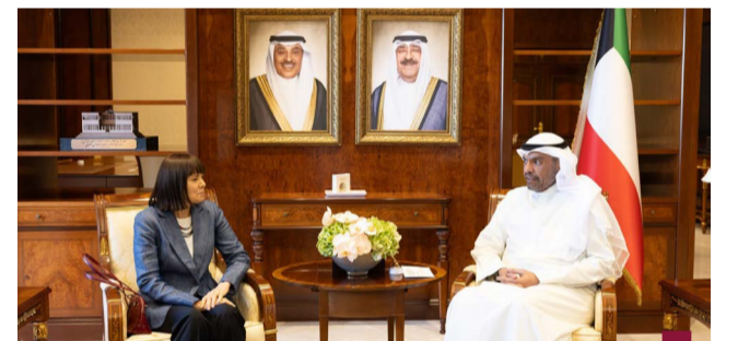
وزير الخارجية التقى السفارة الأميركية لدى البلاد

افتتحت دورة تدريبية في مجال الذكاء الاصطناعي والجرائم السيبرانية لمنسوبي وزارة الداخلية والمؤسسات الحكومية والتعليمية المختصة، تقمها أكاديمية سعد العبد الله للعلوم الأمنية في المعهد العربي للتخطيط خلال الفترة من ٧ إلى ٩ أكتوبر ٢٠٢٤، برعاية وحضور النائب الأول لرئيس مجلس الوزراء وزير الدفاع ووزير الداخلية الشيخ فهد اليوسف، وكبير وزراء الداخلية المساعد لشؤون التعليم والتدريب اللواء فواز خالد الصباح، واستقبال الشيخ فهد اليوسف، داتو سيرى محمد خالد بن نور