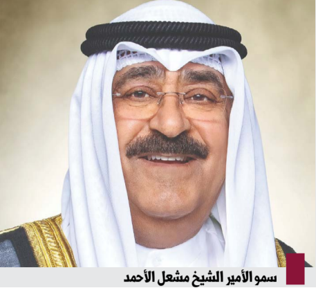
سمو الأمير الشيخ مشعل الأحمد

كويتا - احتفل في قصر بيان أمس بتسلم حضرة صاحب السمو أمير البلاد الشيخ مشعل الأحمد الجابر الصباح حفظه الله ورعاه أوراق اعتماد كل من السفير سعيدي حسين ماسورو سفيرا لجمهورية تنزانيا الاتحادية والسفير إدواردو باتريسيو بينيا هائل سفيرا للولايات المكسيكية المتحدة والسفير رودريغو دي اراوجو جابش سفيرا لجمهورية البرازيل الاتحادية والسفير ايوب خان يونسوف سفيرا لجمهورية أوزبكستان والسفير نوزهران لوماتانيدزه سفيرا لجورجيا والسفير نغيون دوك شانغ سفيرا لجمهورية فيتنام الاشتراكية وذلك كسفرة لبلادهم لدى دولة الكويت. حضر مراسم الاحتفال كبار المسؤولين بالدولة.