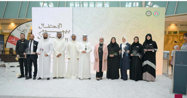
احتفال المؤسسة (بيوم الاسكان العربي)

انطلاقاً من التزام المؤسسة بتوفير السكن الملائم لكل أسرة بما يعزز الارتقاء بنوعية الخدمات السكنية والاجتماعية والتنموية إذ نجحت الكويت على مدى عشر سنوات ماضية بتوزيع وتسليم عشرات الآلاف من الوحدات السكنية للمواطنين، وأوضح