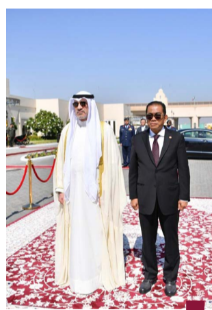
اليوسف مع نظيره الماليزي الدين، وزير دفاع ماليزيا، والوفد المرافق له، بمقر وزارة الدفاع

بمناسبة زيارته الرسمية لدولة الكويت، وقد رحب معالي الشيخ فهد يوسف سعود الصباح بالوزير الماليزي والوفد المرافق له، مؤكدا على عمق علاقات الصداقة والتعاون بين الكويت وماليزيا وحرص الجانبين على تطويرها بما يخدم المصالح المشتركة، خاصة في المجالات العسكرية.