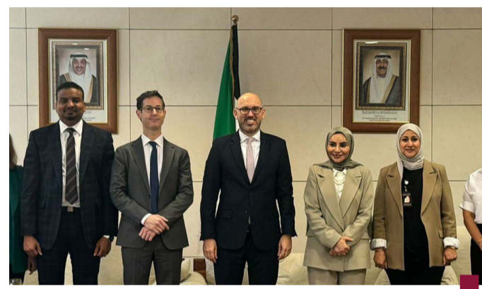
الحويلة مع وفد صندوق النقد الدولي

والإصلاحات الاقتصادية التي تحتاجها الكويت لتحقيق استقرار اجتماعي مستدام. ولفت إلى أن وفد الصندوق قدم خلال الاجتماع ثلاث توصيات رئيسية للكويت تضمنت التركيز على تنويع مصادر الاقتصاد وتطوير وتحسين بيئة الأعمال وذلك للحفاظ على ثروة الوطن وضمان استدامتها للأجيال القادمة. وأفاد بيان الوفد أكد أن هذه التوصيات ستكون خطوات أساسية للحفاظ على استقرار الاقتصاد في مواجهة التحديات المستقبلية. وبين أن الطرفين أكدا أنه لا توجد حلول سريعة أو سهلة للتحديات الاقتصادية التي تواجهها الكويت لكن تمت الإشارة إلى الإمكانيات الكبيرة التي تملكها البلاد وقدرتها على تحقيق التحول المنشود إذا تم العمل على تطبيق الإصلاحات بشكل مدروس ومتوازن.