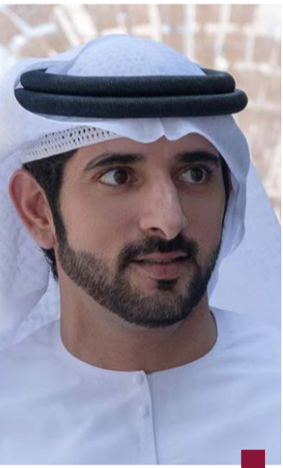
الشيخ حمدان بن محمد بن راشد

يغادر ولي عهد دبي، نائب رئيس مجلس الوزراء وزير الدفاع، الشيخ حمدان بن محمد بن راشد، الإمارات اليوم الثلاثاء على رأس وفد رفيع المستوى، في زيارة رسمية إلى دولة الكويت الشقيقة، وفقا لما ذكرت وكالة الأنباء الإماراتية «وام».