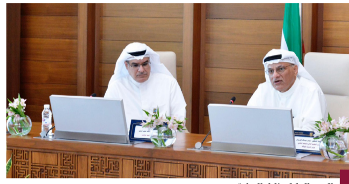
الوزير الجلال خلال الزيارة

أعرب وزير التعليم العالي والبحث العلمي ووزير التربية بالوكالة الدكتور نادر الجلال عن سعادته خلال زيارته الأولى لجامعة الكويت وقائه مدير الجامعة بالإبانة د. أسامة السعيد وقياديينها، وذلك مناقشة العدد من الأمور الأكاديمية والطلابية بالجامعة من ناحية توفير الاحتياجات اللازمة لإنجاح العملية التعليمية من موازنة وكوادر الطلابية، وتقييم الوضع الحالي من الناحية الأكاديمية، ومدى قدرة جامعة الكويت للسنوات الخمس المقبلة وطاقتها الاستيعابية في تحقيق الاحتياجات المطلوبة للتغلب على التحديات، وتعزيز إيرادات الجامعة عن طريق فتح باب الاستثمار بمدينة صباح السالم الجامعية بالتنسيق مع الجهات الرقابية بما يعزز موارد الدولة. وأكد الجلال خلال اللقاء أهمية ربط التخصصات والبرامج التي تقدمها جامعة الكويت مع سوق العمل والطلبات الوظيفية المستقبلية، مع ضرورة الاهتمام بتصنيف الجامعة دولياً وإقليمياً والتركيز