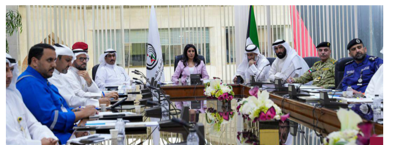
جانب من الاجتماع

فتح المجال أمام الشركات السعودية في مشاريع الطرق بالكويت