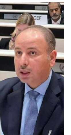
المندوب الدائم لدولة الكويت لدى الأمم المتحدة

استنكر المندوب الدائم لدولة الكويت لدى الأمم المتحدة والمنظمات الدولية في جنيف السفير ناصر الهين الصمت الدولي إزاء الجرائم التي يرتكبها الاحتلال الإسرائيلي ضد الشعب الفلسطيني، محذراً من أن هذا الصمت يرتقي إلى مستوى التواطؤ في حال عدم اتخاذ خطوات فورية وفعالة لوقف هذه الانتهاكات. وحذّر السفير الهين في كلمة ألقاها أمام مجلس حقوق الإنسان في دورته الـ٧٥ في إطار البند السابع من جدول الأعمال المخصص لمناقشة حالة حقوق الإنسان في فلسطين والأراضي العربية المحتلة، من أن استمرار الإفلات من العقاب والتغاضي عن هذه الانتهاكات يقوض احترام القانون الدولي ويضعف مصداقية المؤسسات الدولية. وأكد السفير دعم دولة الكويت الكامل لمبادرة المملكة العربية السعودية لإطلاق تحالف دولي جديد لتعزيز حل الدولتين، كخطوة نحو تحقيق السلام الدائم، مشيداً بقرار الجمعية العامة الداعم لقبول طلب عضوية فلسطين في الأمم المتحدة في العاشر من مايو الماضي.