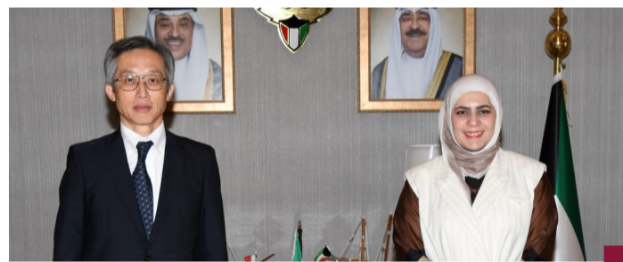
وزيرة المالية مع سفير اليابان