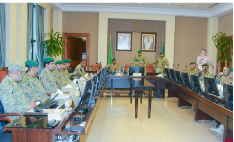
جانب من اجتماع وكيل الحرس الوطني