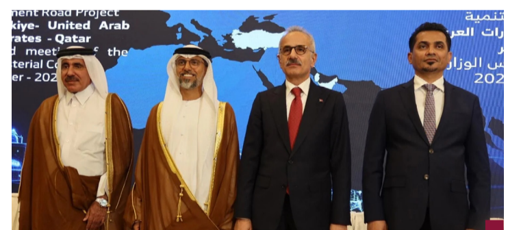
جانب من اجتماع مشروع طريق التنمية وتطوير ميناء الفاو

أعلن وزير العدل ووزير الأوقاف والشؤون الإسلامية الدكتور محمد الوسمي انطلاق جائزة الكويت الدولية لحفظ القرآن الكريم وقراءته وتجويد وتجويد تلاوته للعام ٢٠٢٤ في ١٣ نوفمبر برعاية صاحب السمو أمير البلاد الشيخ مشعل الأحمد الجابر الصباح.