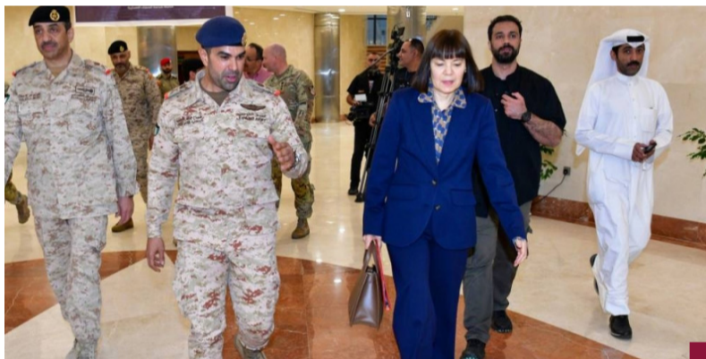
نائب رئيس الأركان مستقبلاً سفيرة الولايات المتحدة