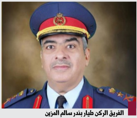
الفريق الركن طيار بندر سالم المرزبان

أصدر النائب الأول لرئيس مجلس الوزراء ووزير الدفاع ووزير الداخلية الشيخ فهد يوسف سعود الصباح، قراراً يقبل طلب التقاعد الذي تقدم به رئيس الأركان العامة للجيش الفريق الركن طيار بندر سالم المرزبان، وذلك بناء على رغبته مع منحه رتبة فريق أول، اعتباراً من تاريخ ٣٠ أكتوبر ٢٠٢٤.