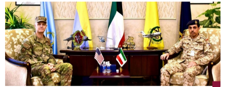
جانب من اللقاء

اختتمت، أمس الخميس، فعاليات نسخة العاشرة من مسابقة (أفضل محارب سيبراني) التي نظّمها الجيش الكويتي ممثلاً بمديرية العمليات السيبرانية بالتعاون مع القيادة الأميركية الوسطى ومشاركة فرق من المؤسسات العسكرية والمدنية من الكويت ودول شقيقة وصديقة. وقالت وزارة الدفاع في بيان صحافي إن حفل الاختتام أقيم برعاية النائب الأول لرئيس مجلس الوزراء وزير الدفاع ووزير الداخلية وبحضور نائب رئيس الأركان العامة للجيش اللواء الركن طيار صباح جابر أحمد الصباح. وأثنى نائب رئيس الأركان على الجهود المبذولة من جميع المشاركين مشيراً إلى أهمية هذه المسابقات في رفع مستوى الكفاءة والجاهزية وتعزيز التعاون بين القوات المسلحة الكويتية ونظيراتها وكذلك المؤسسات المدنية من الدول