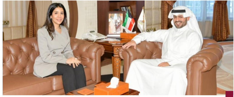
المشعان مع محافظ «مبارك الكبير»

واستقبل محافظ مبارك الكبير الشيخ صباح بدر صباح السالم الصباح في مكتبه بديوان عام المحافظة، وزيرة الأشغال العامة نورة المشعان. وتم مناقشة سبل التعاون بين المحافظة ووزارة الأشغال والتنسيق حول مشاريع عقود وصيانة الشوارع في محافظة مبارك الكبير ويخدم المواضيع المشتركة بين الجهتين بما يخدم الصالح العام. كما قام المحافظ بمعية الوزيرة المشعان بجولة تفقدية في مبنى المحافظة قيد الإنشاء للاطلاع على آخر المستجدات المتعلقة بهذا المشروع.