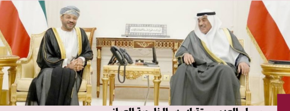
سمو ولي العهد مستقبلاً وزير الخارجية العماني

استقبل سمو ولي العهد صباح الخالد في قصر بيان وزير الخارجية بسلطنة عمان بدر بن حمود اليوسعيدي والوفد المرافق، بمناسبة انعقاد اجتماع الدورة العاشرة للجنة المشتركة الكويتية - العمانية بالكويت. حضر اللقاء وزير شؤون الديوان الأميري الشيخ محمد عبدالله، ووزير الخارجية عبد الله البعيا، ومدير مكتب سمو ولي العهد الفريق متقاعد