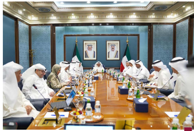
المجلس عقد اجتماعه الأسبوعي برئاسة عبدالله

عقد مجلس الوزراء اجتماعه الأسبوعي الثلاثاء برئاسة سمو الشيخ أحمد عبدالله رئيس مجلس الوزراء. ومن أهم ما دار فيه؛ في البداية أشاد مجلس الوزراء بكلمة دولة الكويت التي ألقاها ممثل حضرة صاحب السمو أمير البلاد الشيخ مشعل أحمد الجابر الصباح سمو الشيخ أحمد عبدالله الأحمد الصباح رئيس مجلس الوزراء في القمة المشتركة الأولى بين دول مجلس التعاون الخليجي والدول الأعضاء بالاتحاد الأوروبي التي عقدت في مدينة بروكسل الأربعاء الماضي