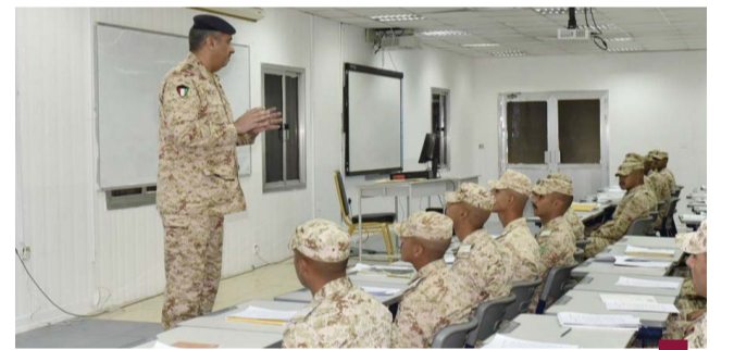
رئيس الأركان خلال الزيارة

قالت وزيرة الشؤون الاجتماعية وشؤون الأسرة والطفولة الدكتورة أمثال الحويلة إن مبادرة «لمة الأهل» التي أطلقتها الشؤون، أخيراً بهدف جمع كبار السن المشمولين بالرعاية في الدور الأيوائية مع الأطفال الأيتام في قطاع الرعاية الاجتماعية تعكس القيم الأصيلة للمجتمع