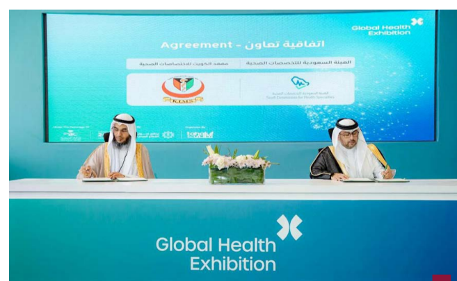
جانب من توقيع الاتفاقية

لهيئة السعودية للتخصصات الصحية الدكتور أوس الشمان. وأوضحت الوزارة أن الاتفاقية تأتي لتوطيد التنسيق بين