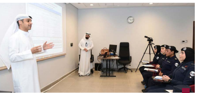
جانب من الدورة التدريبية

في إنجاز صحي جديد يعزز مكانة الكويت في مجال الرعاية الصحية والبحث العلمي، حصلت مختبرات مركز الشبيخة سلوى الصباح للخلايا الجذعية والحبل السري على شهادة الاعتماد الدولي للفحص الجزيئي، من قبل من جمعية النهوض بالدم والعلاجات الحيوية (AABB).