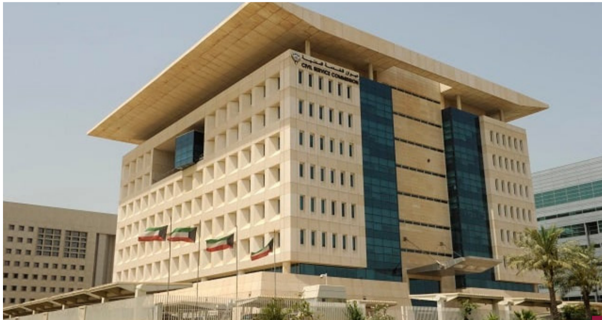
ديوان الخدمة المدنية

أعلن ديوان الخدمة المدنية عن أن نظام العمل في الفترة المسائية في الجهات الحكومية سيبدأ رسمياً في ٥ يناير ٢٠٢٥ وأصدر الديوان تعميماً في شأن الضوابط ويبين أن على كل جهة حكومية أن تحدد مواعيد العمل الرسمية بالفترة المسائية خلال الأيام من الأحد حتى الخميس من كل أسبوع وعدد ساعات فعلية بواقع أربع ساعات ونصف في اليوم، على أن يكون تحديد هذه المواعيد على مستوى الجهة أو مراكز عمل ووحدات تنظيمية معينة أو فئات وظيفية أو مجموعة من الموظفين وذلك حسب مقتضيات ومصلحة العمل على ألا تكون بداية مواعيد العمل الرسمية المعتادة بالفترة المسائية قبل الساعة الثالثة والنصف عصراً، ويجوز للديوان تحديد موعد آخر بناء على طلب الجهة، أما بداية مواعيد العمل بالفترة المسائية خلال شهر رمضان المبارك فتحدد على كل جهة حكومية وفقاً لظروف العمل، ولا يطبق نظام الدوام المن على الموظفين المشمولين بنظام العمل الرسمي بالفترة المسائية.