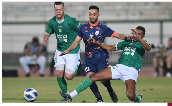
جانب من مباراة العربي واليرموك

السفير الفصام: الكويت ملتزمة بمكافحة الجريمة المنظمة العابرة للحدود