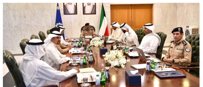
النواف خلال الاجتماع

وتطوير خدمات النقل العام لما فيه من مصلحة للمواطنين والمقيمين، وذلك لوكالة رؤية الكويت الانمائية لتحويلها إلى مركز مالي وتجاري تحقيق هدف إدارة حكومية فعالة وبنية تحتية متطورة ومكانة دولية متميزة.