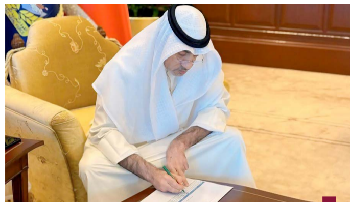
اليوسف يتابع القرعة

شهد النائب الأول لرئيس مجلس الوزراء ووزير الدفاع ووزير الداخلية الشيخ فهد يوسف سعود الصباح قرعة اختيار الضباط وضباط الصف والأفراد المتقدمين لشغل الوظائف الإشرافية الشاغرة لدى القيادة العسكرية الموحدة لدول مجلس التعاون ودرع الجزيرة الذين تنطبق عليهم الشروط والضوابط المطلوبة.